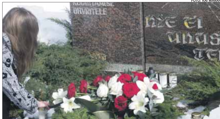
Leinapäeval süütasid vallaelanikud suurküüditamise ohvrite mälestuseks küünlad Rannamõisa kalmistul.