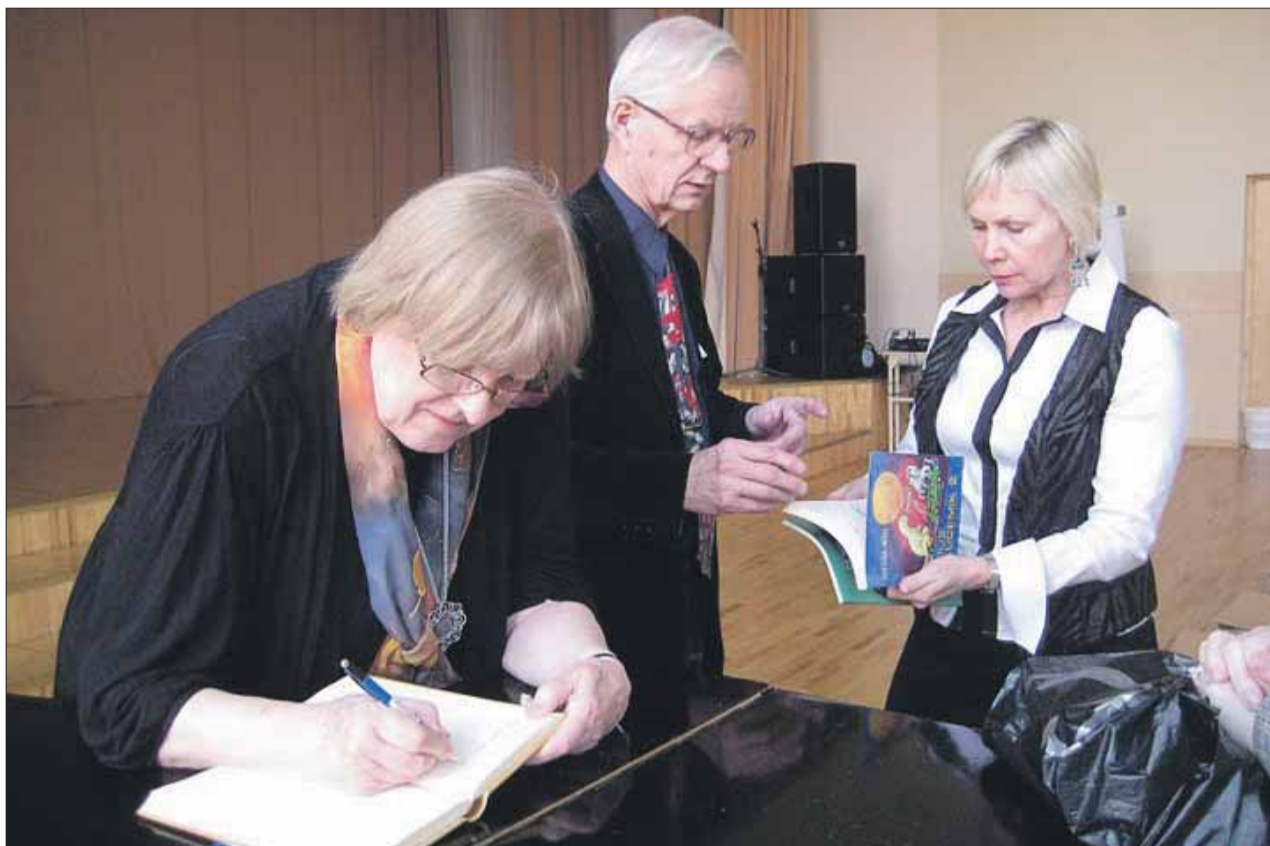
Kirjanikepaar kohtumisel lugejatega.