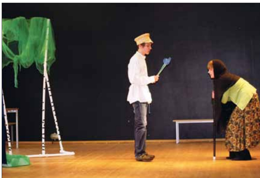
Esikoha toonud lavastuses olid sümboliks sinised lilled.