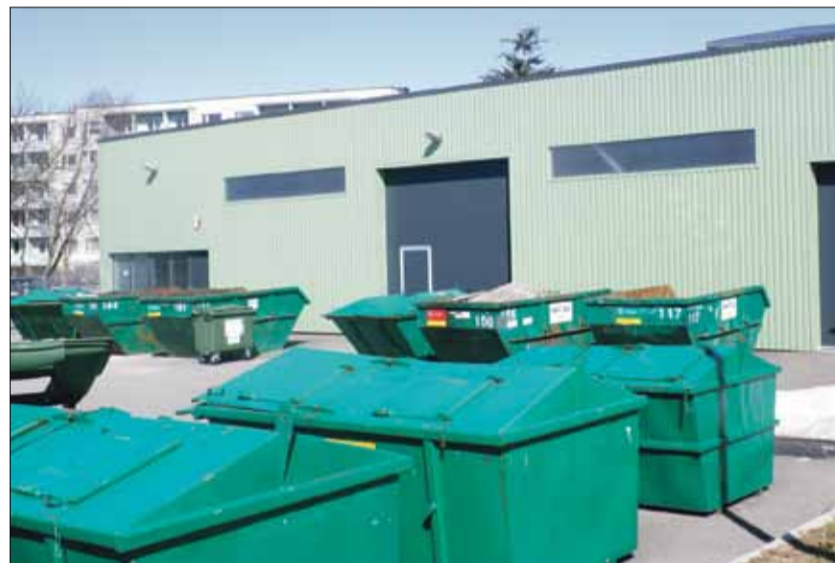
Jäätmejaam Tabasalus (Kooli 5a) on avatud neljapäeviti-reedetel kl 14-19 ja laupäeviti-pühapäeviti kl 10-15.

Heakorraldus pakub Eesti Jäätmeringlus Harjumaal aia- ja haljastusjäätmete (puulehed, niidetud muru jms) tasuta äravedu. Haljastusjäätmed peavad olema kuni 150-liitristes kottides, pealt kinni seotud, kuni 20 kg raskused ning paiknema söi-