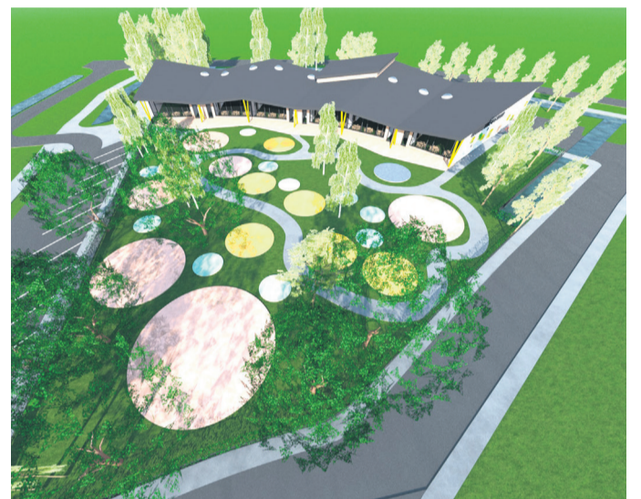
Harkujärve lasteaia projekti autor on arhitekt Vilve Enno arhitektuuribüroost ConArte OÜ. / 3D esküsi ConArte OÜ

lihtsus, vormimäng ja nutikad arhitektuurilahendused. Suhestudes ümbruskonnaga, tuleb ühekorruselise ehitise arhitektuur modernistlikus võtmes, heledates toonides ja lastele omaste erksate värviaksentidega,“ täiendas vallavanem Sandla.