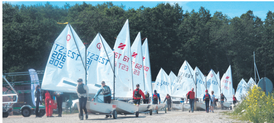
Tilgu Sadama Jahtklubi hooaeg on algamas ning valged purjed saavad taas merele.

Ka sellel suvel kutsume noori purjetajaid üle Eesti oma koduvalda pidama kahepäevast purjetamissüüsi. Regatt toimub 7. ja 8. juulil. Võistleva