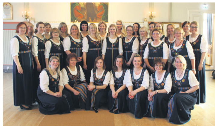
Suurupi naiskoor Meretule andis Soomes Salo ja Turu linnas kaks kontserti Eesti Vabariigi 100. aastapäeva auks.

mas kalurite päeva ja augustis on kõik oodatud suve ärasaamiseks muinastulede ööle. Et hooaeg tuleks edukas, teeme 28. aprillil sadamas ja rannaalal talgupäeva. Hoiaime põialt, et ilmataat toetab meie ettevõtmisi ja kõik huvilised leiavad sellel suvel tee oma kodusadamasse Tilgus. ★