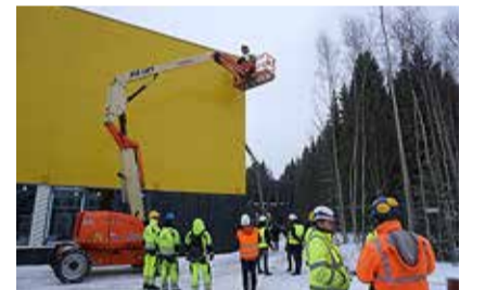
Sügisel valmiv haridushoonete kompleks saavutas lõpliku kõrguse.