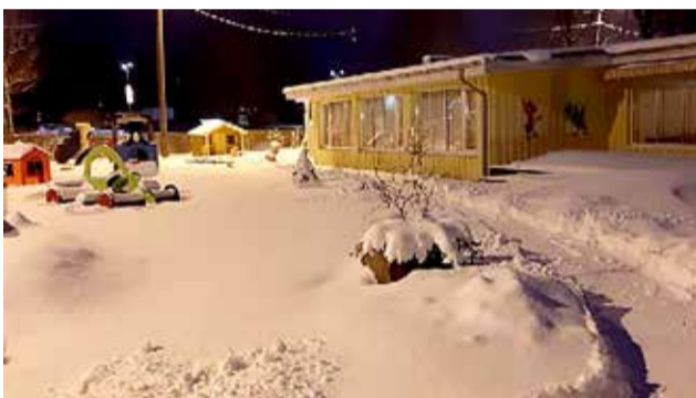
Lastehoid on tegutsenud aastast 2010, pakkudes hoiuteenust 2–3aastastele lastele.

Vallavalitsus avab sügisel täiendavad lasteaiarühmad praeguste munitsipaallasteadeade juures. (Harku Valla Teataja)