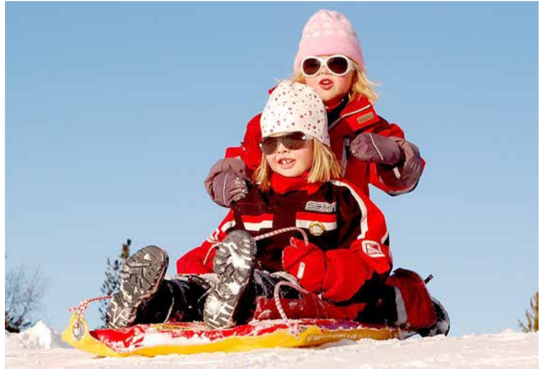
Et vähendada nakatumisriski, võetakse lapsed lasteaeda vastu terrassil või õues.