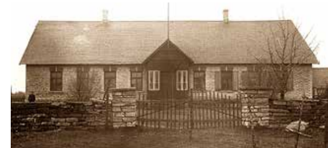
Praegu tegutseb kunagises vallamajas Triibu ja Liine eralastehoid.