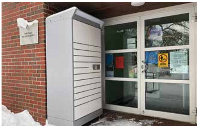
Pakiautomaadist saab raamatuid kätte, millal aga isu on, nii öösel kui ka päeval.

Tabasalu raamatukogu peasissekäigu (Teenuste 2) ees on nüüd pakiautomaat, mis võimaldab lugejatel tellitud raamatuid kätte saada ööpäev läbi.