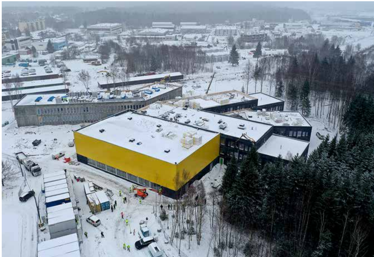
Peagi avavad ukseid koolihooned, värske spordihoone ja riigigümnaasiumimaja kuni 360 õpilasele.