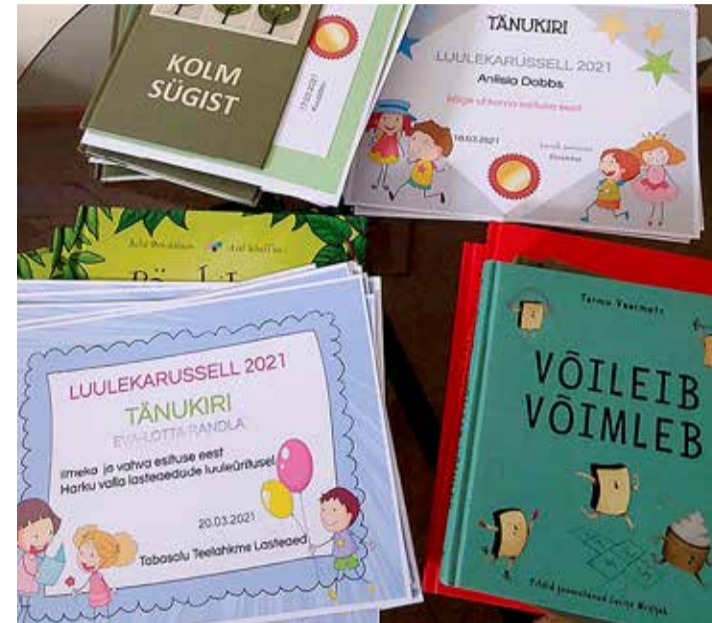
On ju teada, et luuletused toetavad lapse sõnavara arengut ja eneseväljendusoskust.