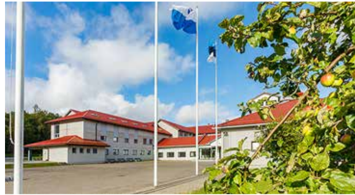
Aastatel 2002–2016 toimetas Meriküla õppehoones sisekaitseakadeemia umbes 200 kadetiga.

Samuti leidis kohus, et vald pidanuks oma otsust paremini põhjendama, pidades silmas Tilgu tee ohutuse küsimuse täpsustamist. Kohus leidis siiski, et koolibusside näol on õpilaste turvalisus tagatud, ja ei saa öelda, et turvalisuse kriteerium oleks nullis ning kaalutusotsus välistatud.