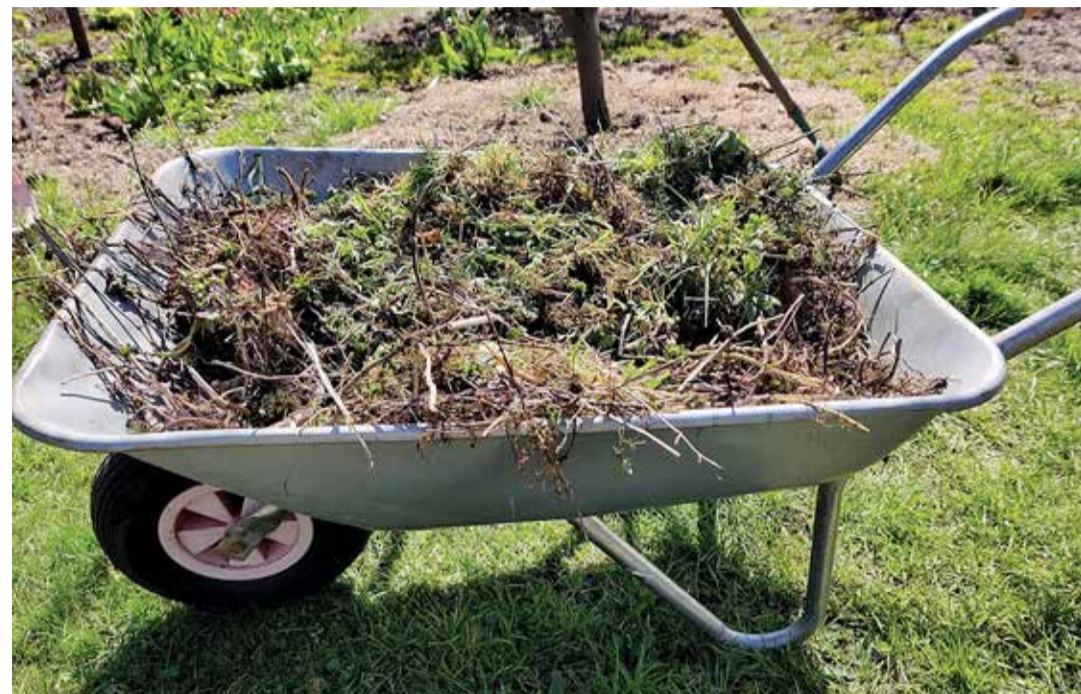
Kevadiste koristustööde käigus kogunenud üsna sageli arvestatav kogus jäätmeid.

Aiast kokku kogutud puulehed ja teised taimeosad on soovitatavalt kohapeal kompostida. Kompostimine on lihtne ja looduslik protsess, mille käigus kasvavad bakterid, mikroorganismid, seened ja ka vihmaussid erineva päritoluga orgaanilist materjali (nagu