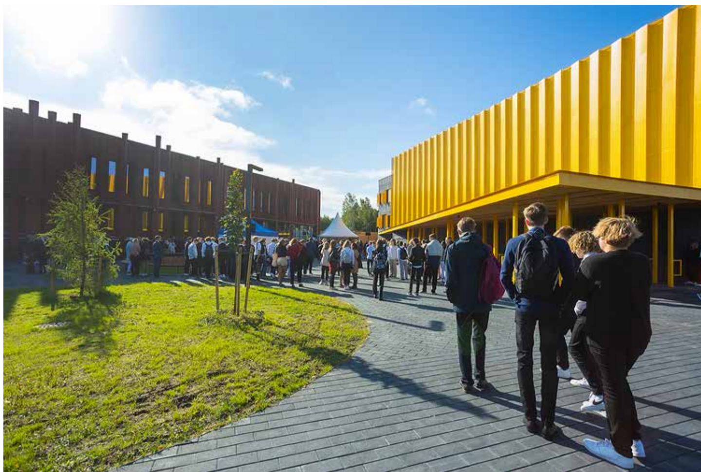
Tabasalu hariduslinnak, mis on Harku valla ajaloo suurim haridusinvesteering, valmis selle aasta septembriks.