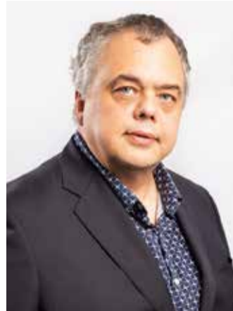
Valla arengut tuleb vaadata tervikuna.

kui heita pilk nende aastate jooksul tehtud kulutustele, vaatavad vastu numbrid, mis näitavad, et enim on investeeritud haridusvaldkonda. 2018. aastal moodustasid haridusvaldkonna kuld valla eelarvest 54%, 2019. aastal 66 ja aasta hiljem 62%, käesoleval aastal kuulub eelarvest 64% haridusvaldkonnale.