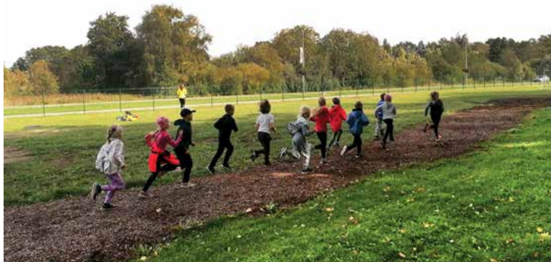
Koolitee alguses olevad esimese ja teise klassi lapsed saavad tasuta kaasa lüüa treeningutel, mis erinevaid spordialasid tutvustavad!

"Sport koolis" on algselt Eesti Olümpiakomitee (EOK) algatatud projekt, mis on osas Tallinna koolides toimunud juba mitu aastat. Esimest korda sel aastal laienes projekt