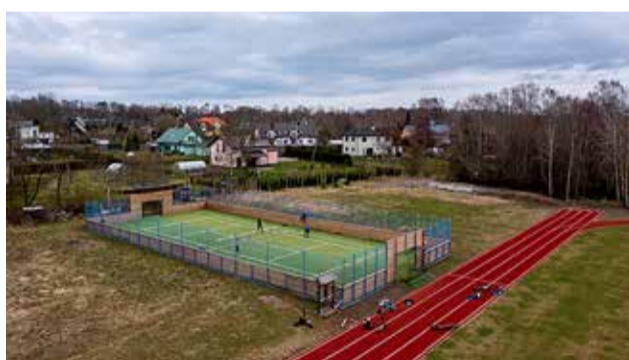
2020. aastal ehitati Vahur Vatteri ettepanekul Vääna-Jõesuu kooli staadionile mitmfunktsiooniline spordiväljak.