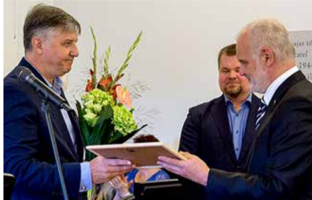
On põhjust uhkust tunda oma valla muusikaõpetajate ning Tabasalu muusika- ja kunstikooli üle.

Kultuurkapitali helikunsti sihtkapital ja Eesti Muusika-koolide Liit andsid 25. septembril Rahvusoper Estonia Sinises saalis üle tänavused tunnustuspreemiad Eesti parimatele muusikaõpetajatele. Sel aastal sai muusika-hariduse sõbra tiitli Harku vallavalitsus. Tiitliga tunnustatakse kohalikke omavalitsusi, kes toetavad muusika-kooli(de) tegevust ning panustavad igakülgset muusika-hariduse jätkusuutlikkuse. (Eesti Kultuurkapital)