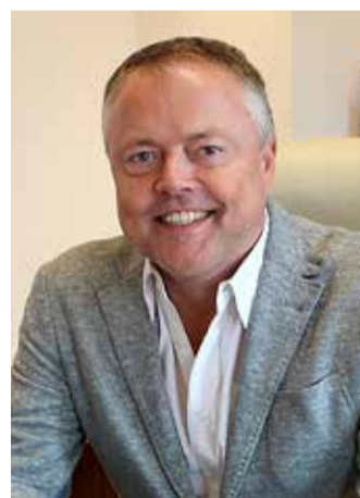
Vald on suurepäraselt hakkama saanud.