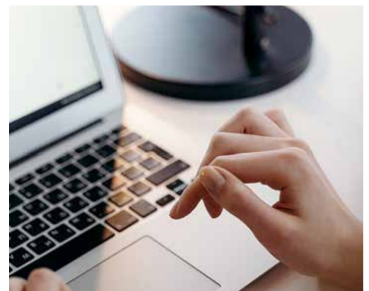
Elektroniliselt saab häält anda alates 11. oktoobrist.

Teisel eelhääletamise perioodil, 15.–16. oktoobril on avatud kõik kolm valimis-