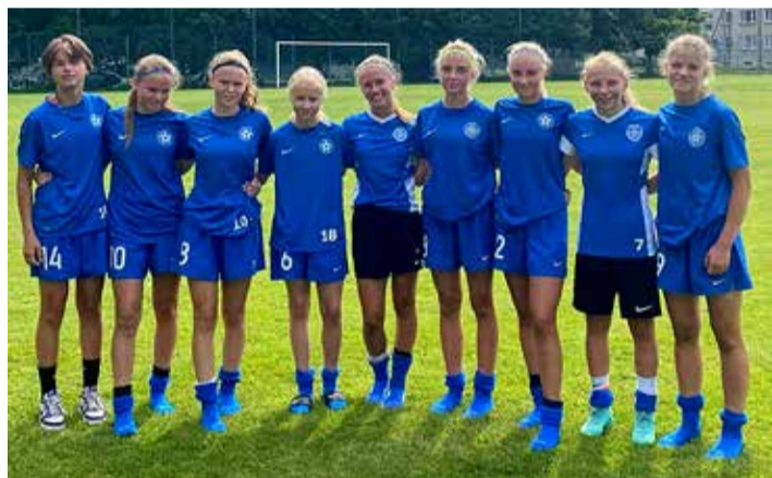
U15 ja U17 neiud Eesti koondises.