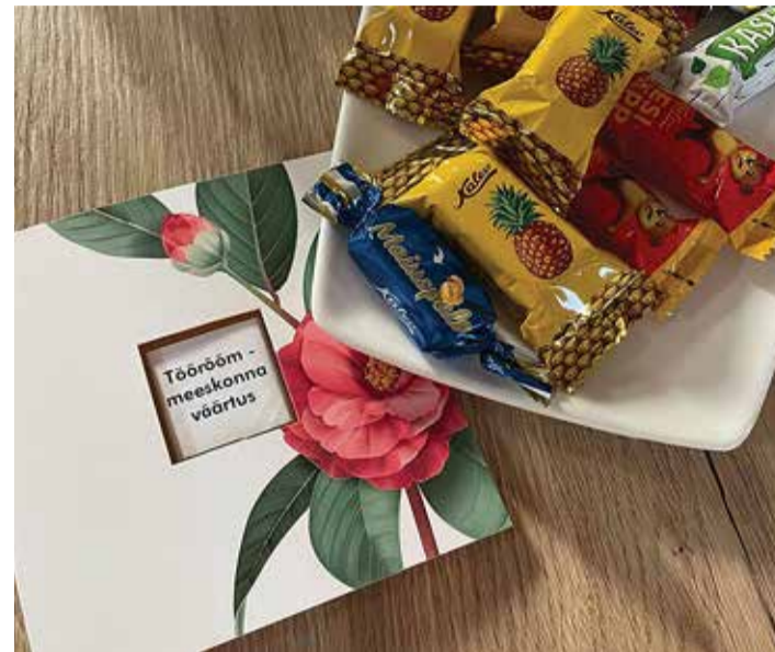
Minna rõõmsa meelega tööle ja sealt sama reipalt tagasi koju tulla? See on võimalik!

lapsi ja rahvastik kasvaks, peame pöörama tähelepanu olemasolevatele inimestele ning nende enesetundele.