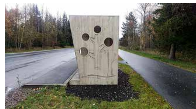
2018. aastal valmisid Urmas Amburi ettepanekul omanäolised betoonist bussiootepaviljonid.