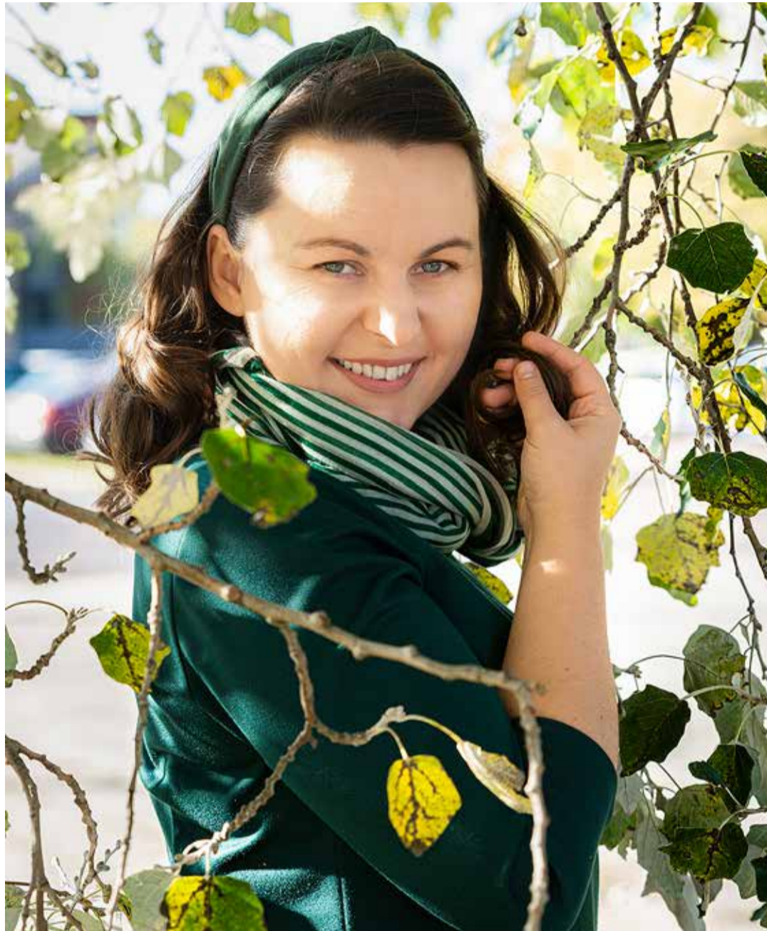
Eestlased mõistavad ukrainlasi ja ukrainlased eestlasi märksa paremini kui paljud teised.

Kui võrdlete Eestit ja Ukrainat, mis on teie jaoks kõige suuremad erinevused ja millised on sarnasused?