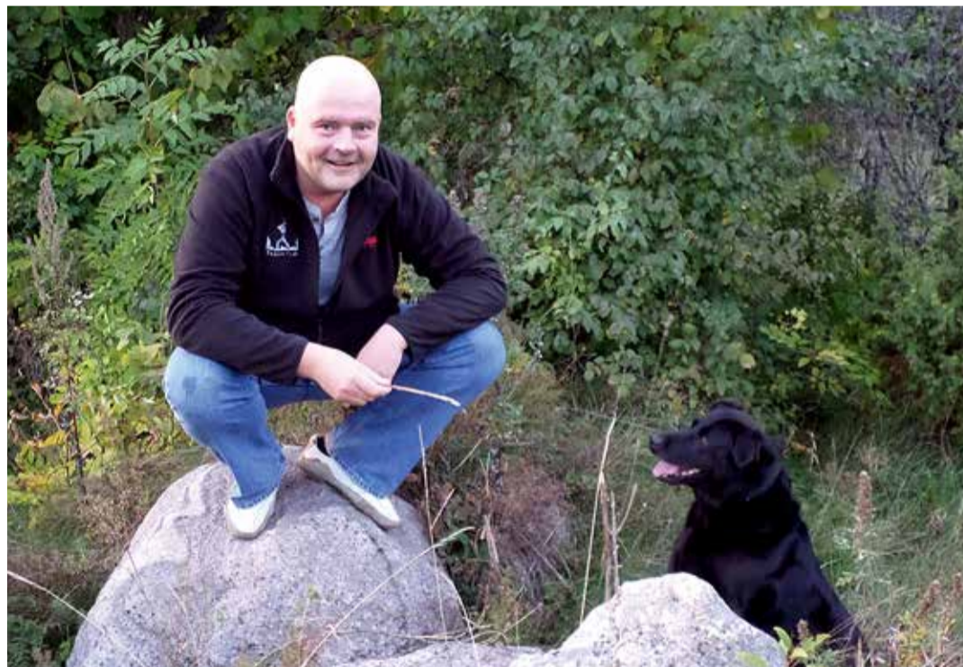
Andres Anvelt panustas Ukrainas õigusriigi ja õiguskaitse projekti "Pravo Police".

Ukraina oli varasemalt mulle suhteliselt kauge ja tundmatu maa. Olin küll oma politseiüle erinevatel etappidel kohtunud Ukraina kolleegidega, teinud koostööd menetlustest koolitusteni, kuid see kõik sarnanes koostööga paljude teiste lagununud Nõukogude imperiumi saatusekaaslastega. Olukord muutus aga tunduvalt, kui asusin 2014. aastal justiitsministri ametikohale. See oli vahetult pärast Kiievi Maidani sündmuse ning Ukraina asus läbi viima väga selget ja eesmärgipärast õigusriigi saavutamise, Euroopa Liidu ja NATO-suunalist poliitikat. Hiljem, kui olin siseministri positsioonil, oli poliitiline kokkupuude veelgi tihedam. Ukraina viisavabadus jõustus 2017. aasta juunis. Vastavateemalised Euroopa Liidu siseministrite nõupidamised polnud lihtsamate killast, kuna Euroopa seisis samal ajal silmitsi ulatusliku migratsiooni-