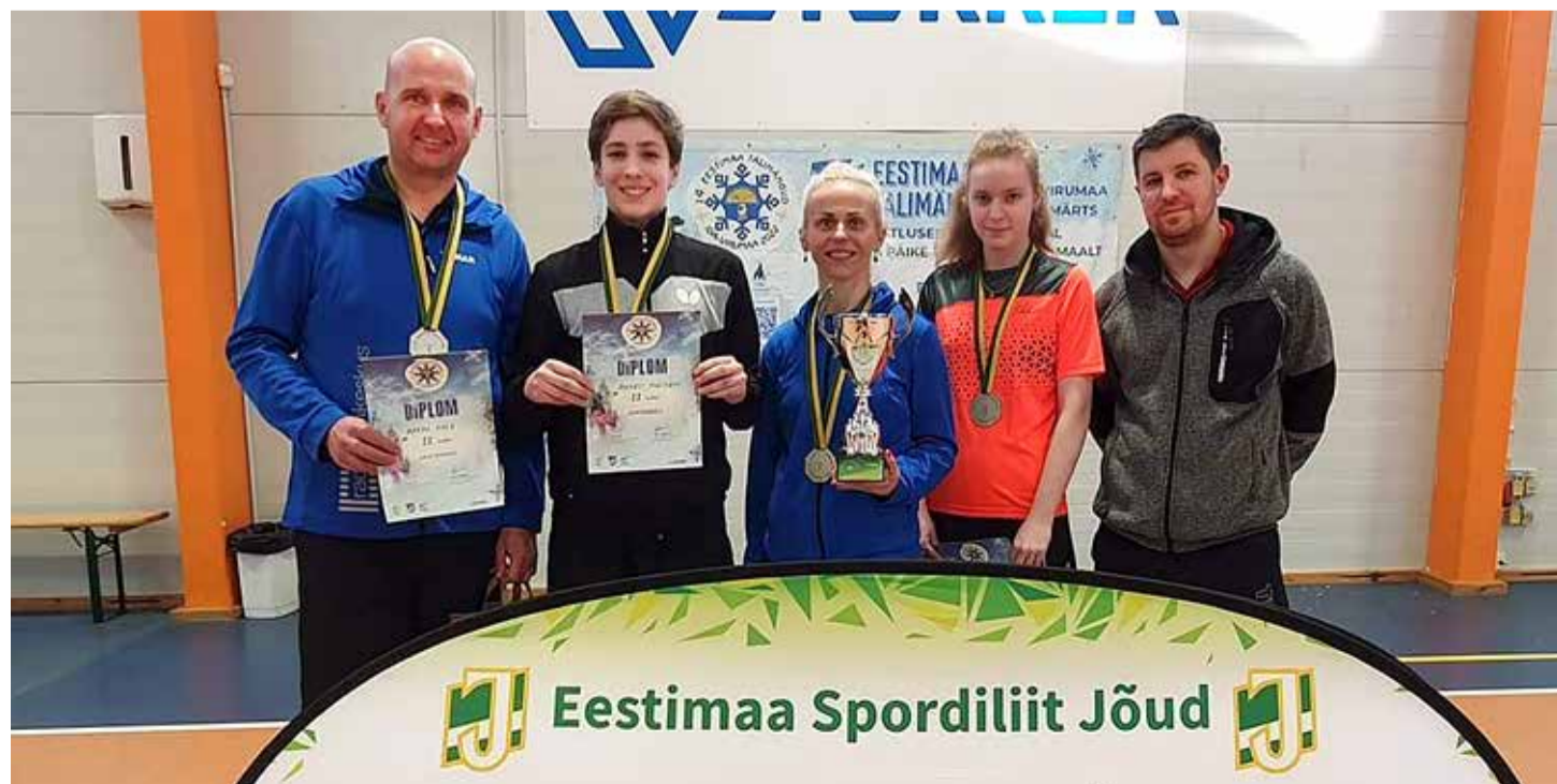
Meie tubli lauatennise võistkond pälvis teise koha.