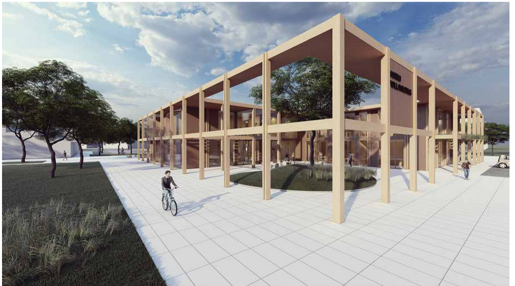
Konkursi võitis Kuu OÜ ideekavandiga "Kandik".