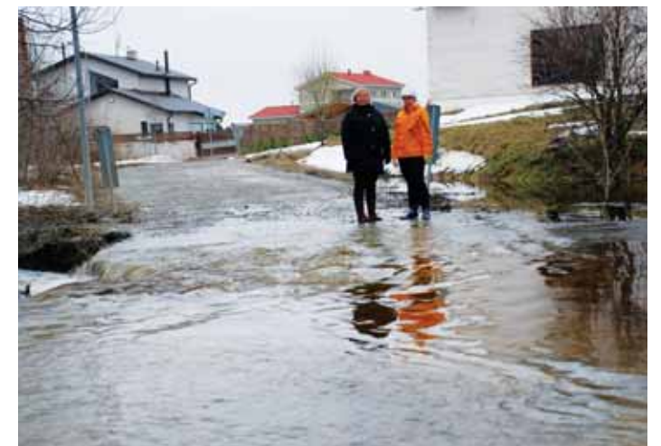
Kindlasti tuleks vaadata, kas kindlustuskaitse laieneb ka piirkondadele, kus toimuvad üleujutused sageli. Pildil Harkujärve küla eelmisel kevadel.

Kindlustusandja valimisel ära otsusta hinna põhjal, vaid selle järgi, kes pakub sinu vajadustele kõige paremini sobivaid tingimusi.