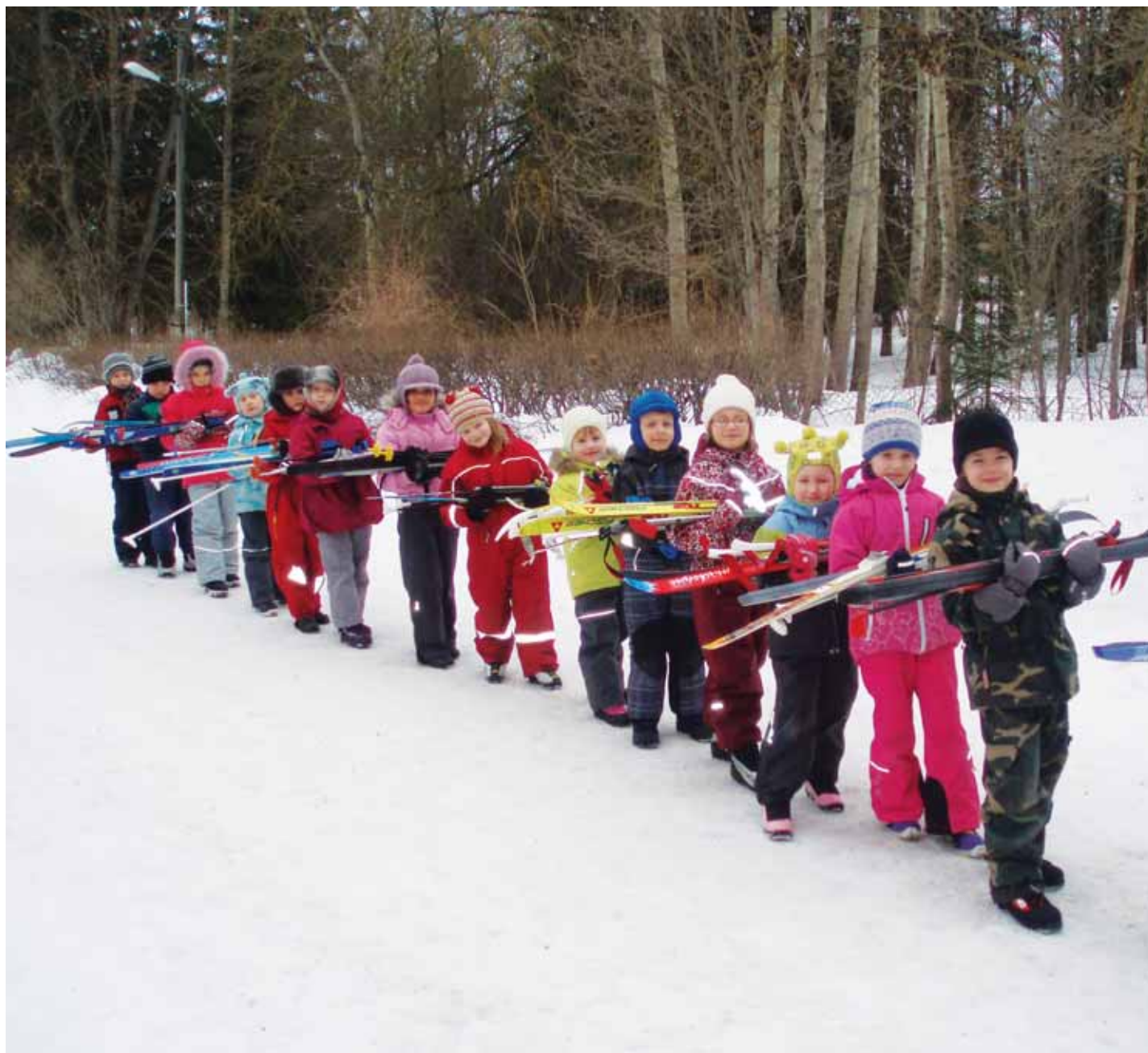
Aega ja kannatust vajab juba suusaraja ärde jõudmine, nii et kogu varustus ikka süles püsiks.