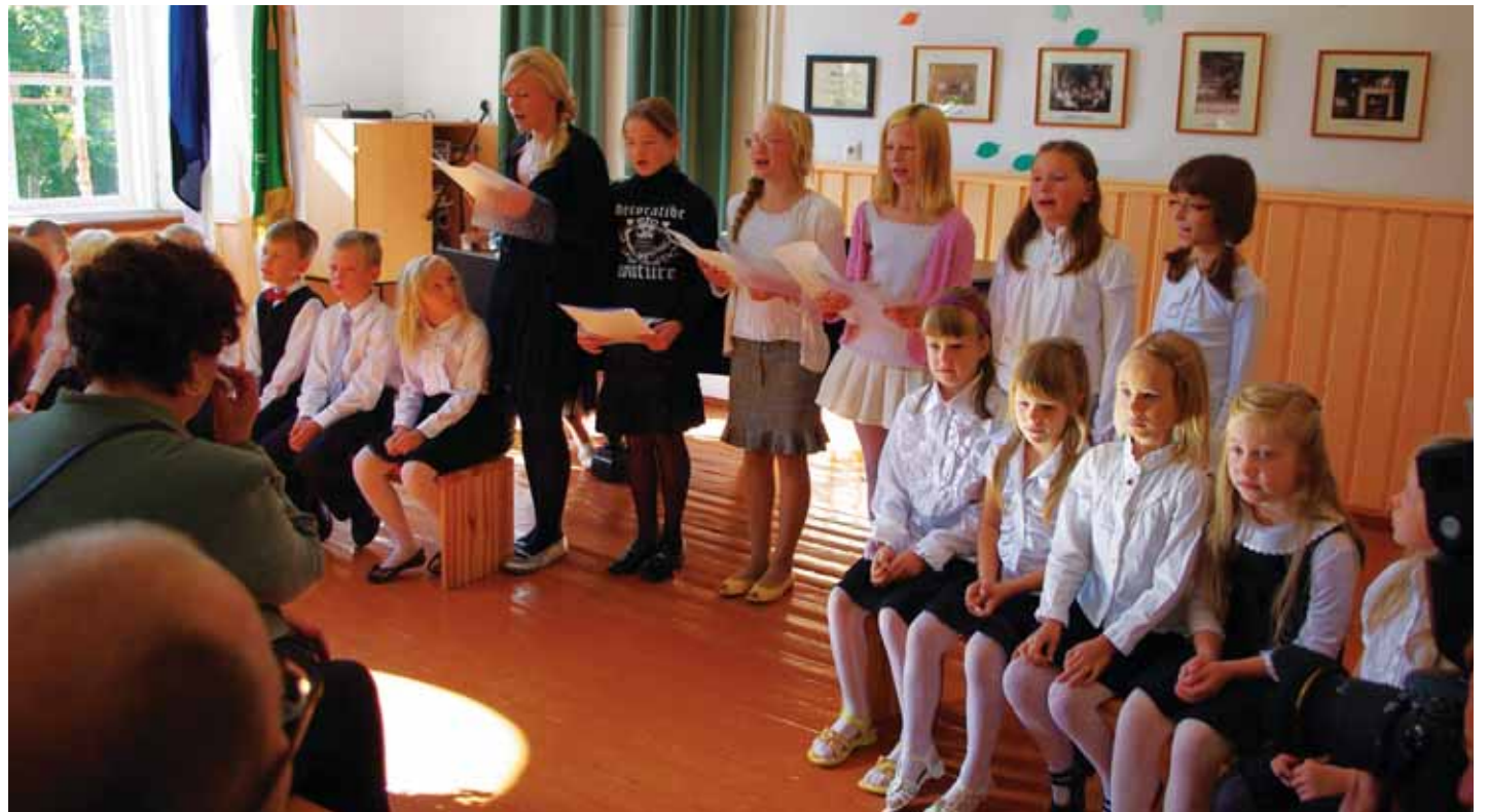
Koolialguse aktus Väana Mõisakoolis 1. septembril 2010.

Sotsiaaltoetuste süsteemi korrigeerimine on sisse kirjutatud ka valla arengukavasse, suurem osakaal peaks edaspidi olema just vajalike teenuste pakkumisel ja toimik juhtumipõhine toetuste määramine.