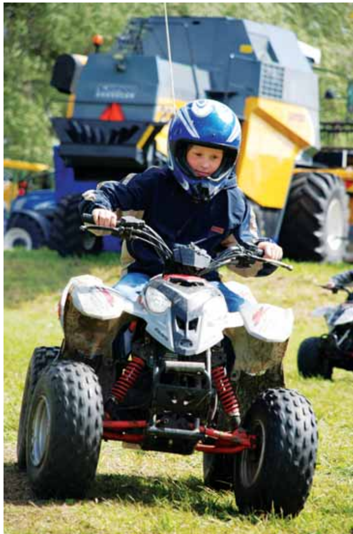
AGRI pakub kõigile midagi - pereisad saavad uudistada tehnikat, pereemad kauneid hobuseid ja graatsilisi ratsanikke kaunites kleitides, pere pesamunad kihutada aga ATVdel.