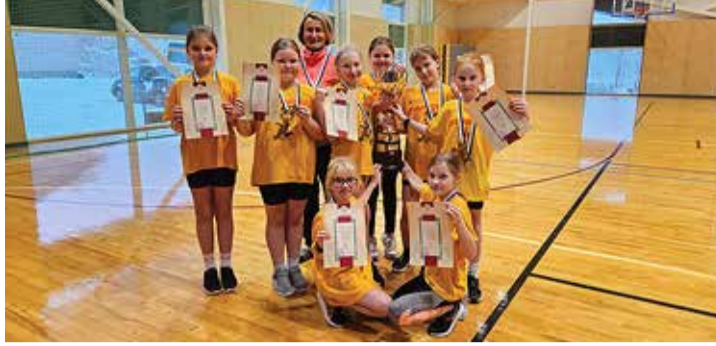
Tabasalu kooli tüdrukud on eriti edukad olnud rahvastepalli võistlustel.

Tabasalu kooli tüdrukud võitsid rahvastepallis rändkarika ning nii poisid kui ka tüdrukud on olnud edukad TV 10 Olümpiastardi võistlustel.