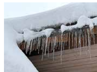
Majaomaniku kohustus on hoida oma maja katust puhas ja ohutu.

le osale, sest nii võib tekkida liigne koormus hoone madalamale osale ja põhjustada selle varingut; • kui lund visatakse inimeste ja sõidukite liikumistsooni, tuleb enne piirata inimeste ligipääsu sellesse tsooni; • ohutuks liikumiseks on soovitatav paigaldada katusele katusesillad ja -redelid; • lume ja jää katusest varisemise takistamiseks paigaldada katusele lumetõke;