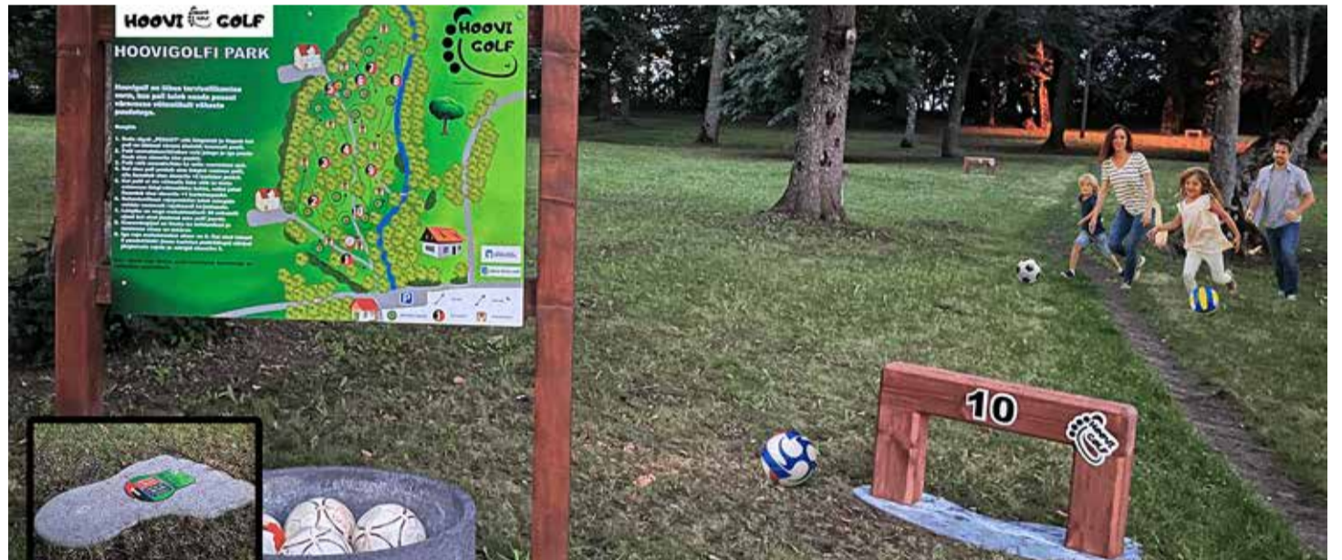
Hoovigolf on uudne ja lõbus tervise liikumise vorm. Foto on illustratiivne.

Kaasava eelarve võiduidee realiseeritakse järgmise eelarveaasta (2024) jooksul. Harku vald alustas kaasava eelarvega 2017. aastal. Eelmisel aastal võitis kaasava eelarve hääletusel harkulaste südame projekt "Atraktiivsed ronimispüramiidid" Muraste ja Väana-Jõesuu kooli õuele. Varem on kaasava eelarve toel rajatud seitse eridisainiga betoonist bussiootepaviljoni (2018), Väana-Jõesuu ranna jõulinnak ja atraktsioonid väikelastele (2019), Väana-Jõesuu mitmetarbeline kunstmurukattega spordiväljak (2020) ja Tilgu sadama puhke- ja ürituste korraldamise ala (2021) ja projekt "Liikuma kutsuv Harku vald – maastiku tõukerattapargid" (2022).