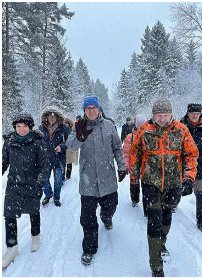
Sõrve looduskaitseala on loodud! Esireas vasakult: vallavanem Katrin Krause, minister Kristen Michal ja loodusmees Val Rajasaar.

puhke- ja matkapaiga ning loodusaridust pakkuva koha, kus mitmekesiste ökosüsteemidega tutvuda," ütles kliimaminister Kristen Michal, kui otsustas Sõrve looduskaitseala moodustamise eelnõu kooskõlastusringile saata.