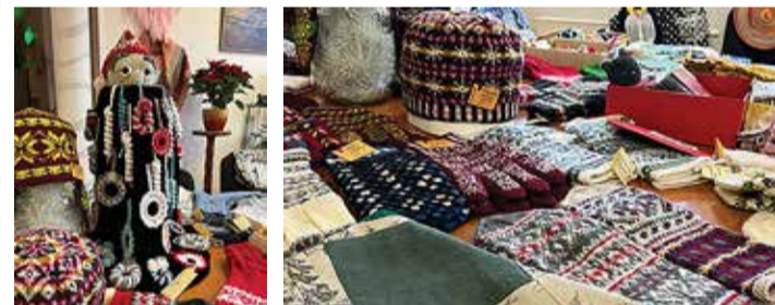
Jõulumüügilt leiab kingitusi jõuluvana kingikotti. / Fotod: Merike Pinn

akate päevakeskuses pakutakse käsitööd väikestest heegeldatud päkapikkudest kuni suurte lapitekkideni. Osta saab puust mänguasju, jõulupärgi, tikitud kaarte, pehmeid mänguasju ja kootud kindaid