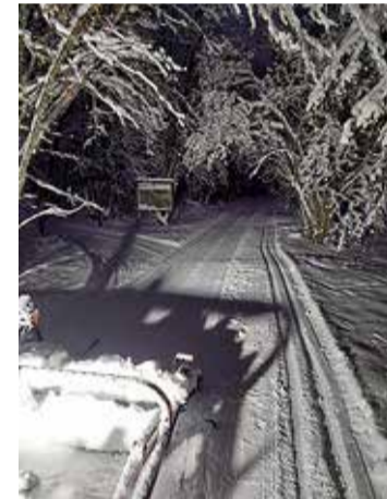
Jagunud on nii lund kui ka külmakraade ja nüüd saab suusad alla panna.

Suusarajad on valmis saanud Tabasalu looduspargis, kus raja pikkus on 8 km, Tabasalu kooli territooriumil on sees pooleteise kilomeetri pikkune suusaring ja suusajäljed on sisse aetud ka Alasniidu mänguväljakul.