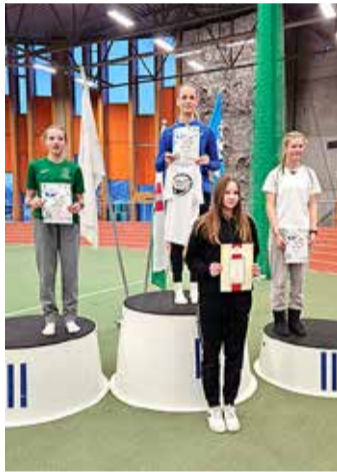
Edukad ka TV 10 Olümpiastardis.

4. ja 5. klassi poiste mängud peeti 16. novembril Sakus ning seal osales 33 võistkonda. Poisid jäid 17. kohale.