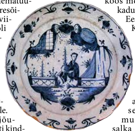
Suurupi purjekaga Hollandi taldrik.

Mässi juhtimisel Soome lahe keskelt 74 meetri sügavuselt põhjamudast peaaegu püstloodis seisev selle laeva vrakk. Tööd tegi rahvusvaheline meeskond. Nüüd on küll Vello Mässi elutöö kuhjaga täis.