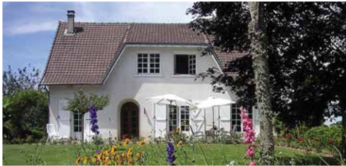
Toetuse saamiseks peab majapidamine asuma hajaasustusalal.

Programmi eesmärk on tagada hajaasustusega maapiirkondades elavatele peredele head elutingimused ja seeläbi aidata kaasa elanike arvu püsimisele hajaasustusega maapiirkondades. Eesmärgi saavutamiseks toetatakse programmist majapidamiste vee- ja kanalisatsioonüsteemide, juurdepääsuteede ning autonoomsete elektrisüsteemidega seotud tegevusi. Hajaasustuse programmi rahastatakse Eesti riigi ja kohalike omavalitsusüksuste eelarvest ning toetus on kuni 67% konkreetse toetusprojekti abikõlblikest kuludest.