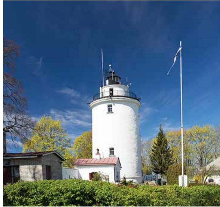
Harku kanti sobib hästi loodusturism.

mine peab olema tasakaalukas. Näiteks tõi ta militaarse objektid, kus talvituvad nahkhiired. Kaitsealuste liikide pesitsust häiritaks, kui intensiivse turismi reklaamimise tagajärjel hakataks tegema giidituure ka talvel.