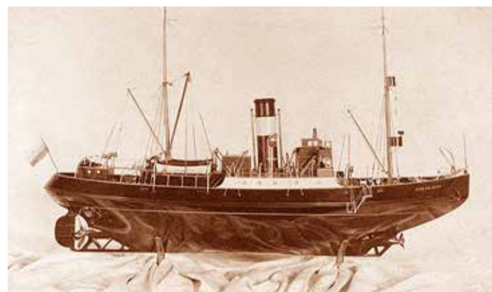
Jäälõhkuja Pjotr Veliki laevamudel Göteborgi muuseumis.

uuritud ja merepõhjas käidud seal leival mootorpurjekal, eestiaegsel puitplankudest kerega laeval Jaen Teär, mis uppus 1945. Laev vedas Tallinnast Saaremaal asunud Nõukogude vägedele sõja- ja muidu moonna. Isegi suusad olid lastis. Puksiiris veeti laeva läbi merejää, mis lõikas läbi kereplangud ja laev uppus. Või oli koter-