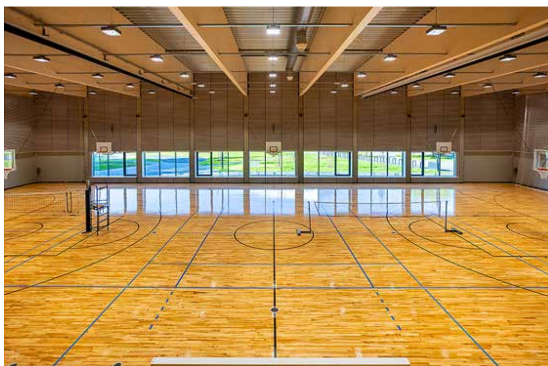
Spordisaal.