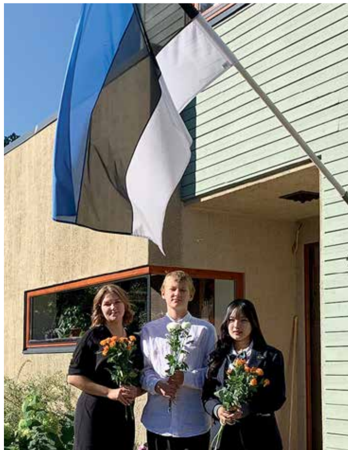
1. september. / Fotod: Sille Roots

Vaatasime kaua Eestisse saabuvate vahetusõpilaste tutvustusi. Omal ajal Inglismaal tekkisid mul jaapanlastest sõbrannad, kellega hoiame Facebooki vahendusel siiani ühendust. Kuigi me ise Jaapa-