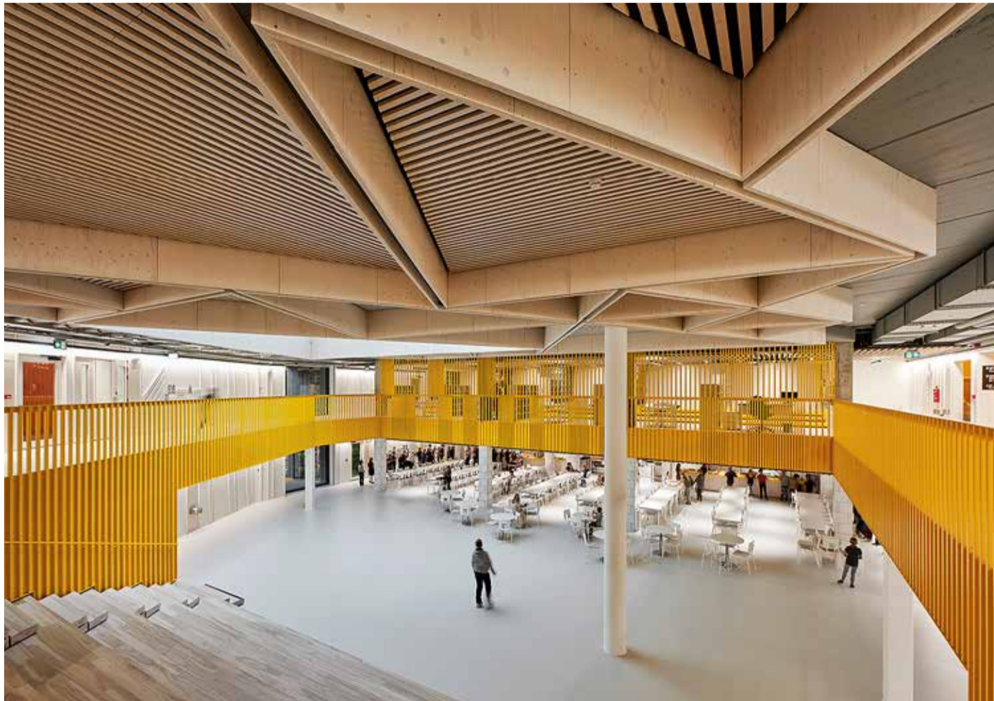
Vaade läbi mitme korruse.