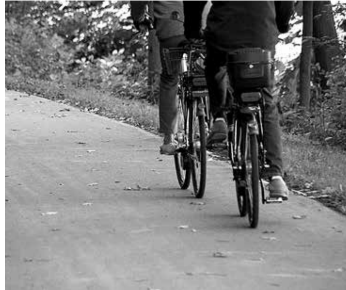
Harku vald saab juurde mitu jalgrattateed.