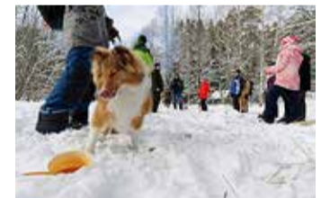
Kõigil osalejatel sai kõht täis.

Sõrve kaitseala ja Põlma oja metsapikniku paika läheme eeldatavasti kordusretkele 23. aprillil. Liikumisaasta jüripäeva kõnnu kutse on õhus! Puudel mahlad juba liikumas ja varsti kollase liblika aegki!