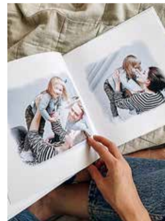
Fotoraamatut sirvimas.

mõnus isekeskis sirvida või lähedastele kinkida.