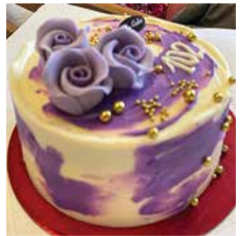
Almire Kuusemets oma 102. sünnipäeval.