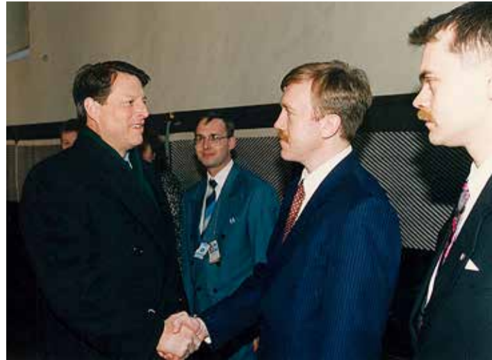
Märts 1995. USA asepresident Al Gore'i visiidi ajal Tallinnas.

Selle töö üldine reegel on, et vastutab vastuvõtja riik. Aga loomulikult, kui 1991. aasta sügisel külastas Tallinna toonane USA riigisekretär James Baker, siis ei jätnud jänkid midagi juhuse hooleks. Samamoodi oli 1992. aastal, kui Tallinnasse tegi visiidi USA asepresident Dan Quayle – secret service'i agendid olid kohal kaks nädalat varem. Tagantjärele võib öelda, et see oli üks parimaid koolitusi üldse. Ja praktikast esimestel aastatel jätkus – viis-kuus riigivisiiti, st kõige kõrgema taseme tur-