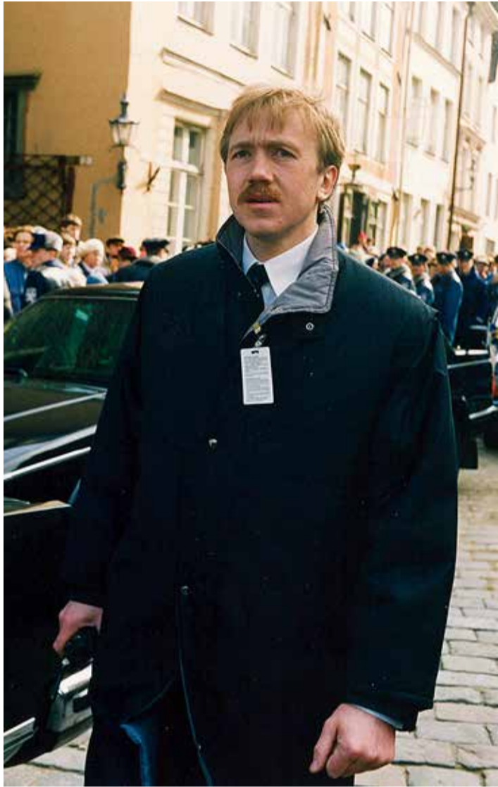
Aprill 1992. Ivar Pritsi Rootsi kuningapaari Eesti visiidi ajal.

kogu eriteenistuse relvaarsenal. Alguses tähendas valvamine peamiselt hoonetesse sissepääsukontrolli ja õist valvet. Hiljem lisandus sellele keskne objektide videovalve ja häiretele reageerivad patrullid.