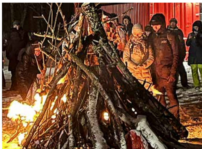
Tilgu sadamas ootas matkajaid lõke.