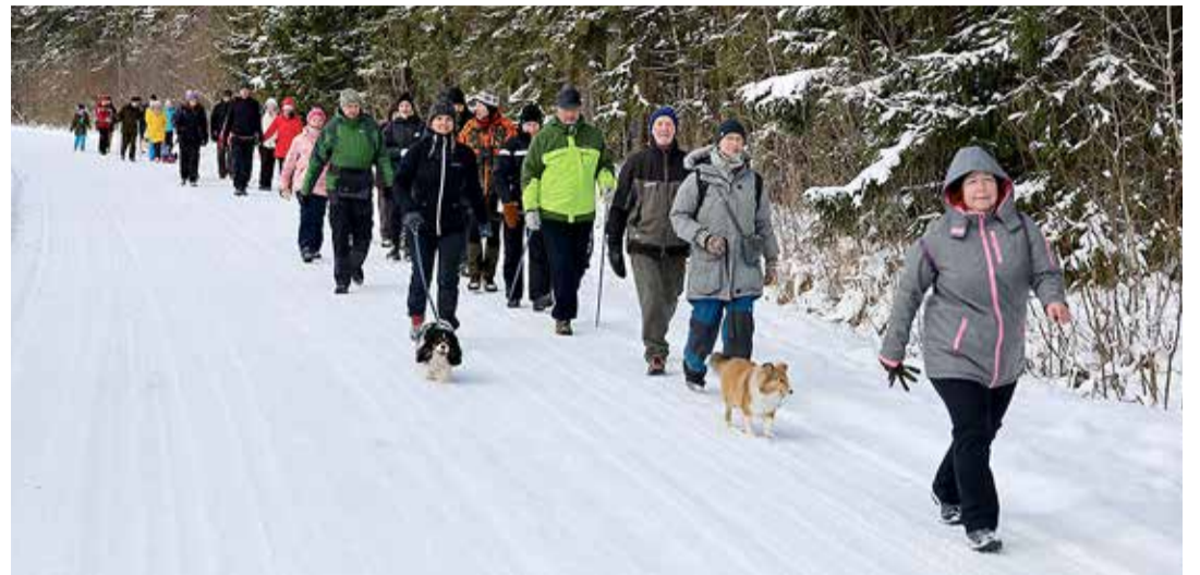
Peaegu hanerivis Tammi teel.