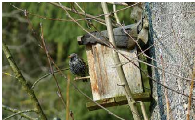
Suvise aialinnuvaatluse käigus saab tundma õppida oma aia elurikkust.

Projekti toetab keskkonnainvesteeringute keskus. (Eesti ornitoloogiaühing)