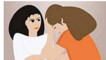
Vaimse tervise teenused on tasuta.

võtta laste puhul lastekaitse-spetsialistiga ja täiskasvanute puhul sotsiaalhoolekandespetsialistiga.