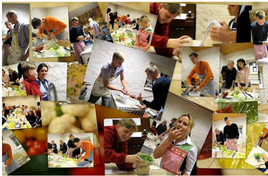
Kokkamise töötod on popid.

väljastpoolt. Populaarsed on olnud toidutegemise õpitoad. Õpitud on seepi tegema ja viltima, hõbesavist ja klaasist ehteid on tehtud, maalitud jne. Sõbrapäeval küpsetame muffineid ja jagame neid kõigile maja külastajatele ning viime ka koostööpartneritele. See on tänu neile, et meid toetavad. Fantaasiakuuse võistlus on juba läinud üle-eestiliseks. Osalejad on Kohtla-Järvelt Kanepini.