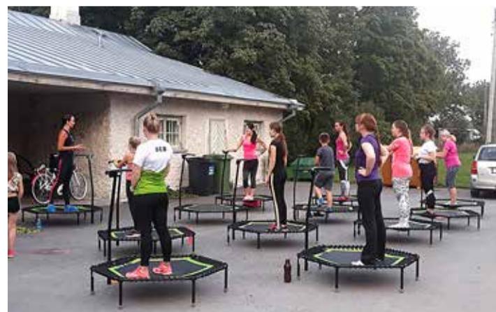
Treenida saab nii majas sees kui ka väljas – täiskasvanute jumping.