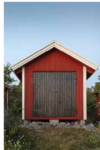
Väikeehitis on näiteks alla 20 m 2 kuur.

(ehitusseadustikust, looduskaitseadusest, haldusmenetluse seadusest jt) tulenevaid nõudeid. Tagatud peavad olema tuleohutus ja naabusõigused (ei tohi kitsendada piirnevate kinnisasjade kasutamist ega tekitada märkimisväärset negatiivset mõjutust, mida ei ole võimalik vähendada või leevendada).