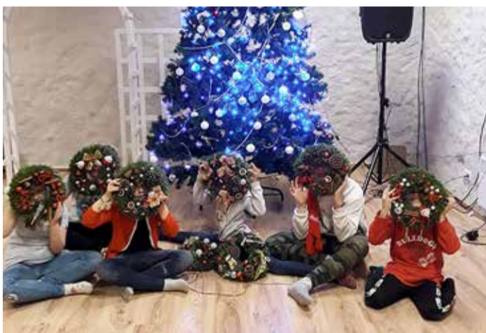
Traditsioon on jõulupärgade valmistamine eakatele.