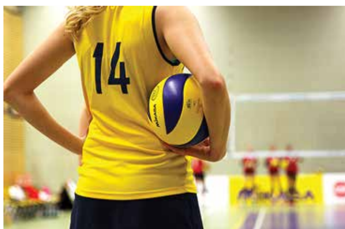
Alanud on sporditoetuste taotlemine järgmiseks aastaks.

Tegevustoetust võib taotleda spordiorganisatsioon ja -klubi, mille põhitegevus on organiseeritud huvitegevuse korraldamine 7–9-aastastele