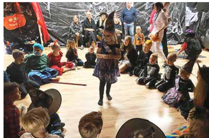
Halloweeni tähistamine toob kokku palju noori.

Kui igas Eestimaa külas tehakse jaanituleid, siis Kumnas ei võtnud asi vedu. Jaanipäevaks kippus Kumna üsna tühjaks jääma – inimesed läksid jaanide ajaks mujale. "Nii tek-