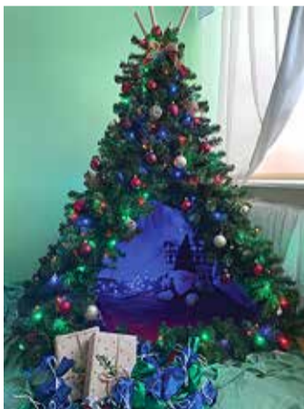
Fantaasiakuusk, mille on teinud Keila Vikerkaare lasteaias Arabella rühm.

mesed siin, lapsed, ja see on üks, mis teda Kumnas hoiab.