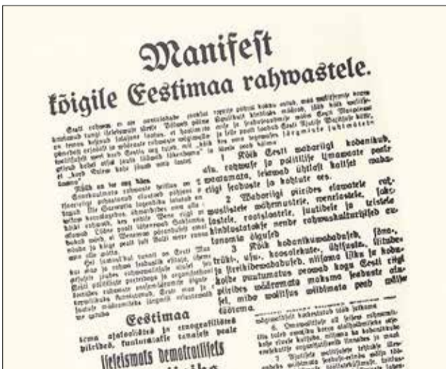
105 aastat tagasi avaldatud dokument.

Meil kõigil lasub kohustus Eesti elu edasi viia. Soovin selleks meie tahet, meelekindlust ja koostöövalmidust. Head 105. aastapäeva, armas Eesti!