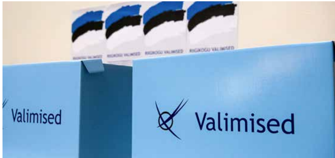
5. märtsil on riigikogu valimised.

• Kodus hääletamine toimub valimisnädala reedest pühapäevani. Taotlust selleks saab esitada telefoni teel reedel ja laupäeval kell 12–20 ning pühapäeval kell 9–14.