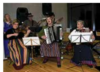
Öölaulupeol kõlab ka rahvamuusika.

Öötantsu- ja laulupidu on rohkem kui lihtsalt pidu, see on kogukonna tunne. See on suurepärase võimalus luua sõprussuhteid ja mälestusi, mis kestavad kogu elu, samuti tähistada üheskoos meie riigi tähtsat päeva.