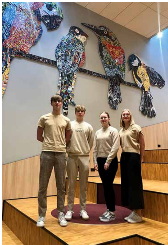
Noorte endi valitud paik foto tegemiseks.

ja. Oskar ja Kaisa täiendavad omalt poolt, et nende mentorid on pigem suunajad, mitte need, kes ütlevad, kuidas peab või kuidas ei tohi.