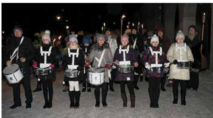
Tantsu- ja laulupeo tõrvikurongkäik.