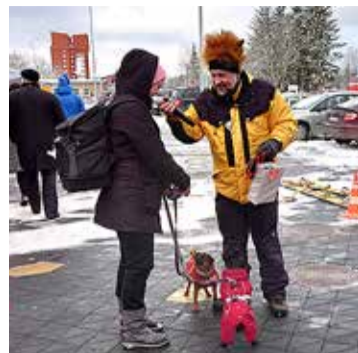
Liikumisaasta aväiritus pakkus tegutsemislusti nii suurtele kui ka väikestele.

11. veebruaril sai Tabasalu keskuse pargis tehtud algus ja avapauk Harku valla liikumisaastale.