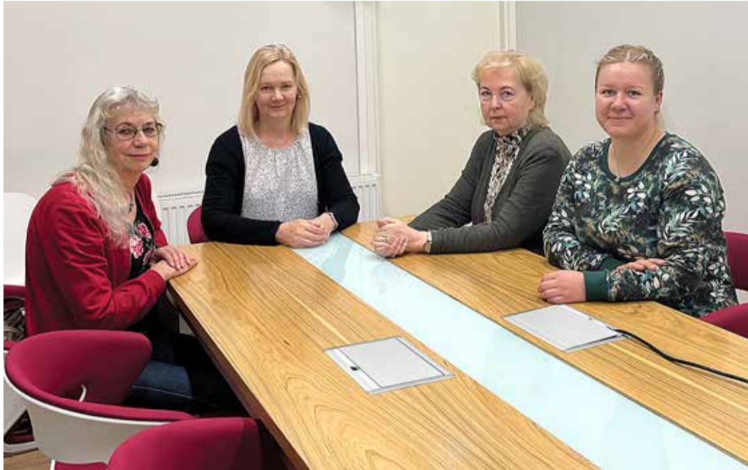
Harku valla hariduse tugiteenuste osakonna logopeedid. / Foto: erakogu

ne laps ei pea hääldama r-i ja sellega võib oodata, kuid viieaastane peaks. Hiljemalt kuueaastase lapse r-iga tuleks kindlasti tegeleda, et enne kooliminekut hääldusprobleem ületada. Kui kolme-nelja-aastase lapse puhul on kõne vähene, ebaselge ja võrastele arusaamatu, on vaja sellega kiiresti tööle hakata.