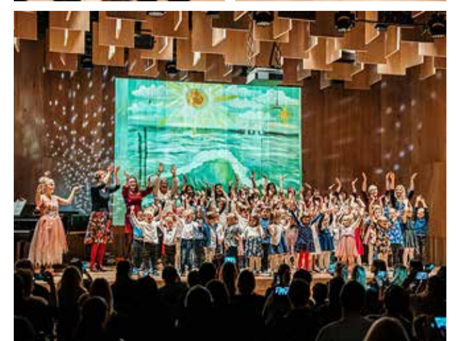
Pangapealse lasteaias lapsed pidasid uhkelt lasteaias sünnipäevapidu.