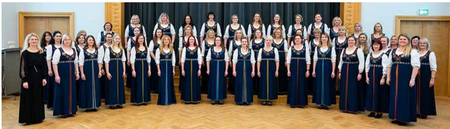
Hetk pärast konkursi Tallinna ülikooli aulast.