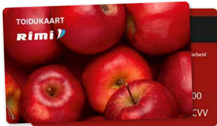
Esimesed toidukaardid jagatakse aprillis.

Toidukaart võetakse kasutusse selle aasta aprillis ja Euroopa Struktuurfondide perioodi lõpp on 2027. aastal.