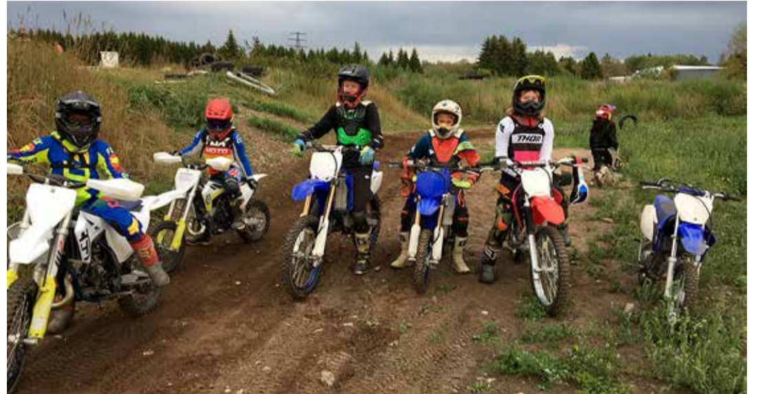
Ootame pikisilmi maa tahenemist, et alustada treeninguid uute rühmadega.

esimalt teeme selgeks, kuidas kasutada turvavarustust. Seejärel alustame sammhaaval esimeste sõiduvõtete omandamisega. Treeningu käigus omandavad õppurid ohutu sõidu põhialused ja tulevad toime sõitmisega motokrossirajal.