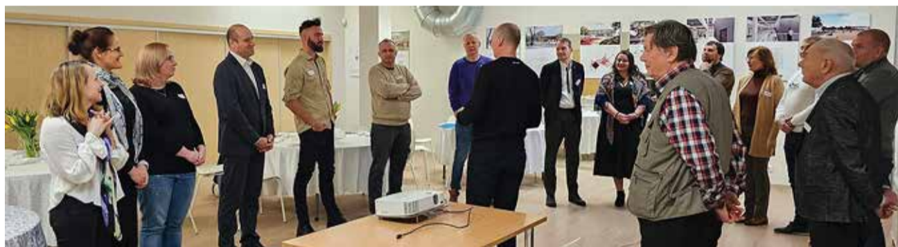
Kasulik päev nii ettevõtjatele kui ka vallavalitsusele.

Kolmanda töörühma moodustasid tööstusettevõtjad. Märkigi, et väiksemates kohtades on keeruline leida töötajaid; töökohti justkui on, aga käib pendelränne. Mõõndi, et koostöö vallaga on lüklilik, kuid valmisolek