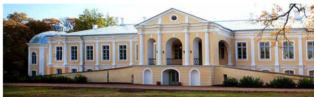
Väana mõisakool.

Lisaks on vanematele palve, et võimaldaksite lastele kas suvel või muul ajal aastas pikemat puhkust koos pere ja lähedastega.