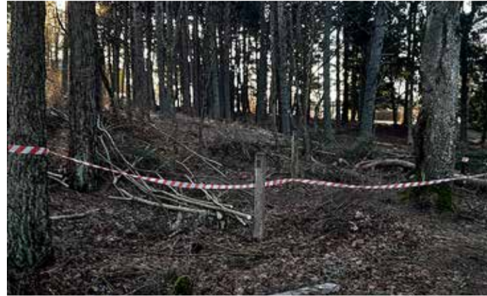
Raie tööd Vääna-Jõesuu lasteaia ehitusplatsil.