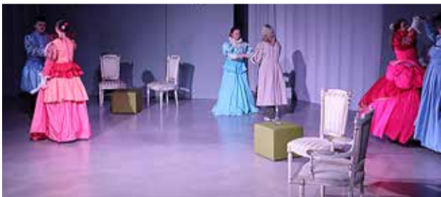
Esietendub "Kaunitar ja koletis".

"Kaunitari ja koletise" esietendus 24. märtsil kell 19 Muraste koolimajas Lee tee 9. Sisepääsu lunastab 7 kuld-münti (või 7 eurot). Avatud kohvik, arveldamine sularahas.