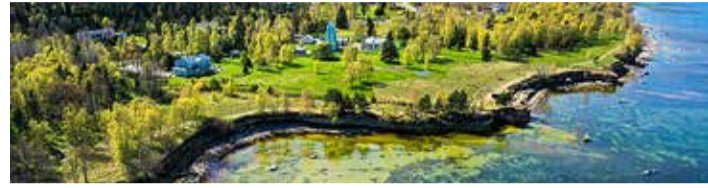
Väärtustame looduslähedast elukeskkonda.

sammud seab. Arengu planeerimisel on olulised kolm küsimust: kus me oleme, kuhu me tahame jõuda, kuidas me seda teeme? Arengukava peamine eesmärk on valla kestlikuse ja elanike rahulolu tagamine. Arengukava peateemad on juhtimine, avalik ruum, energia, liikuvus, keskkond, majandus, turvalisus, sotsiaalne kaitse, noortetöö ja huviharidus, vaba aja tegevused ja liikumisharrastused, haridus.