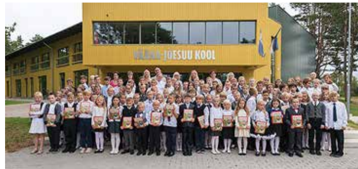
Vääna-Jõesuu kool.