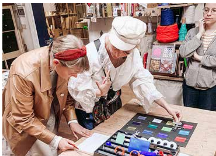
Ka meie pidime oma loovuse proovile panema.