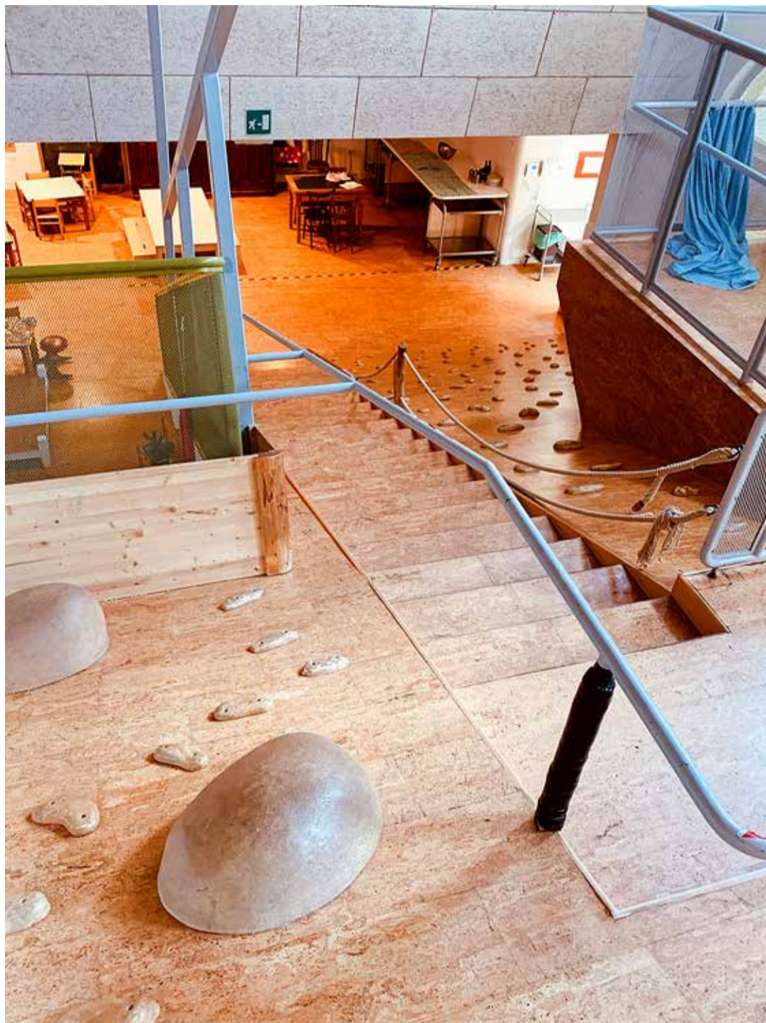
Majas sees sai nii ronida, liuelda kui ka turnida.

vaheline suhtlemine oli vaba ja siiras, hakkas silma, kuidas arvestati üksteisega, hoolimine ja hoolitsemine teise eest, kaaslase märkamine, palju koostegutsemist. Omavahelised reeglid määratakse ise.