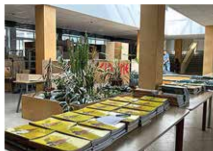
Rekonstrueerimistööd Tabasalu koolis on lõpusirgel. Rohkem kui nädal tagasi pildistatud fotodel on käsil viimased viimistlustööd.

"Sõna "eesmärk" võib ära hirmutada, aga näiteks algklassides on need lihtsad asjad: loen nädalaga raamatu läbi, käin kaks korda jalgrattaga sõitmas vms," selgitas koolijuhhi.