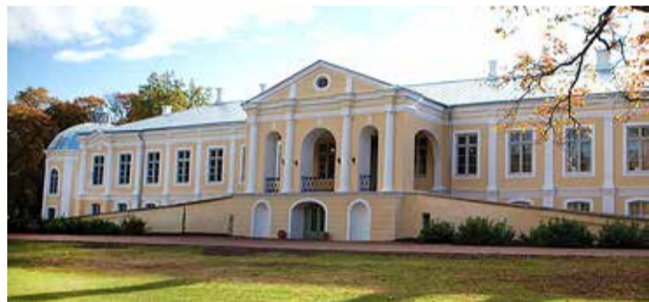
Vääna mõisakool.