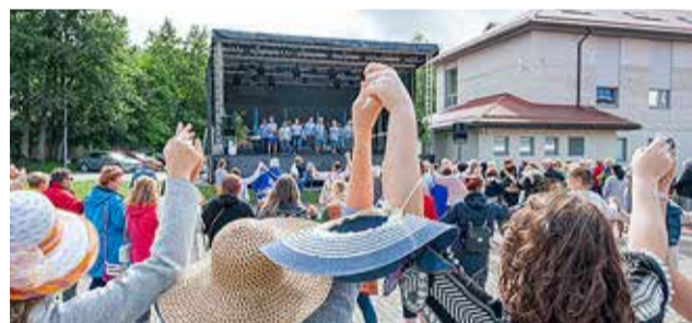
Kultuurikorraldajad suvekoolis. / Foto: Rene Mitt

Kolmepäevane suvekool on mõeldud kõigile omavalitsustes töötavatele kultuuritöötajatele. Üritust korraldatakse juba 16. korda erinevates Eesti paikades. Suvekool annab võimaluse erialaste teadmiste täiendamiseks, kogemuste vahetamiseks ja kohalike vaatamisväärsustega tutvumiseks. (HVT)