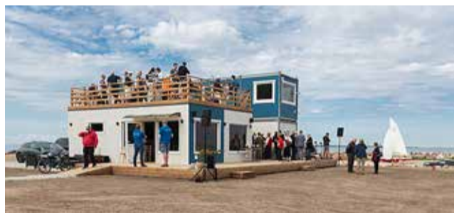
2021. aasta kaasava eelarve ideekonkursi võitis ettepanek rajada Tilgu sadama puhkeala.

Lisainfo www.harku.ee/kaasaveelarve (HVT)