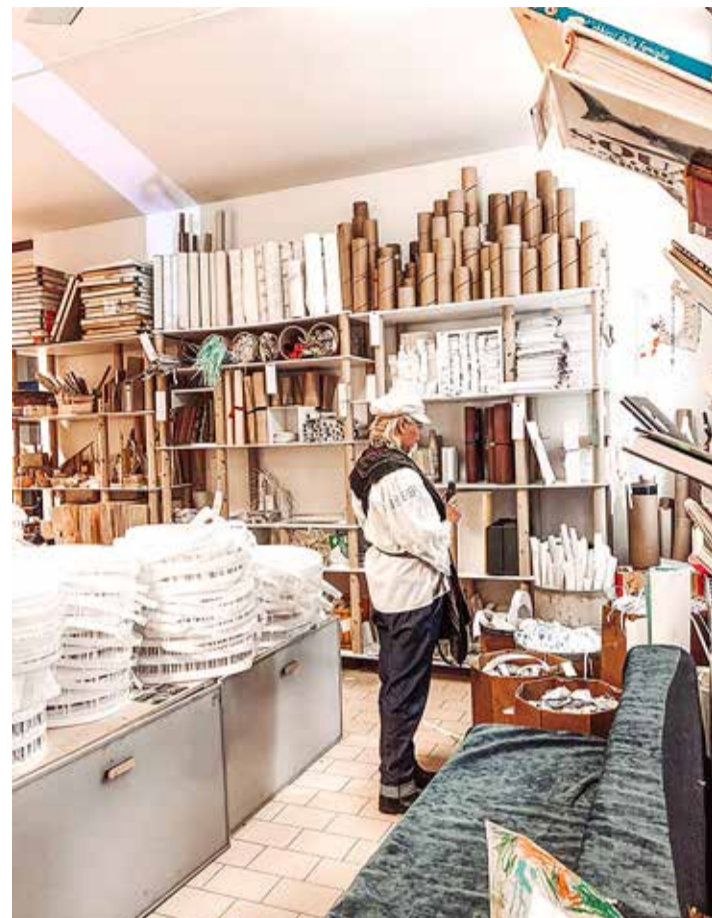
Et lastel oleks alati meisterdamise materjali, on Itaalias loodud n-ö jaotuskeskused. Sinna toovad oma ülejäägid firmad. Kõikidel õpetajatel on uksekaart (maksab 10 eurot). Õpetaja võib sinna igal ajal minna ja võtta, mida vaja. Jaotuskeskus korraldab ka õpitubasid ja loovuslaagreid.

Laste päev möödub tegevustes, mis nad ise valivad. Täiskasvanu osa on olla vajaduse korral olemas. Tavaliselt sellest piisab. Kõik lapsed leiavad endale ise tegevuse ja sõbrad.