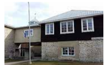
Harkujärve põhikool.

Kooliaasta avaaktus toimub tarkusepäeval kell 10.30 kõikidele klassidele korraga. Oodatud on kindlasti ka esimeste klasside õpilaste vanemad. Traditsiooniliselt on etteasted nii õpilastelt kui ka õpetajatelt, kõne direktorilt ja tervitussõnad kooli presidendilt. Igatahes aabitsad ootavad juba jagamist.