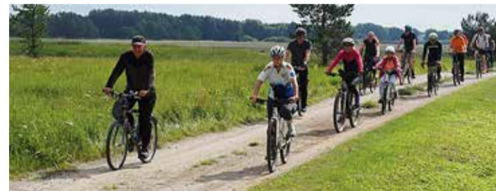
Rattaretk pakkus osalejatele avastamisrõõmu.

Retkega meenutati kolmekümne kahe aasta taguseid sündmusi. Tõusti kahekümne aasta vanusele Sõrve tehismäele ja imetleti seal avanevat vaadet. Loodusobjektide juures mindi ajatelge pidi tagasi ja tutvuti tuhande ja kahe tuhande aasta vanuste