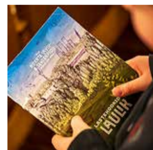
XIII noorte laulupeo eelproovil.

XIII noorte laulupeo maakondlikud eelproovid on läbi ja kunstiline toimikond valis välja koorid ja orkestrid, kes 2. juulil laulukaare all üles astuvad. Kokku on sellesuvisele suurpeole tulemas ligi 800 kollektiivi ligi 25 000 koorilaulja ja orkestrandiga.