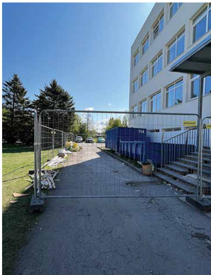
Väljas on töösoon piiratud aiaga.