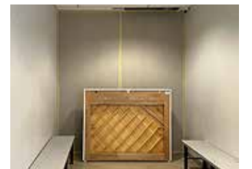
Ehitustsooni kõrvalised isikud ei pääse – see on kaitstud ajutise seinaga ja sinna viiv uks lukus.

Tabasalu kooli peamaja re- konstrueerija leidmiseks kor- raldas Harku vallavalitsus riigihanke, millest soodsaimaks osutus Luxen OÜ pakkumine maksumusega 1,21 miljonit eurot, millele lisandub käibe- maks. Kokku osales riigihankes kolm ehitusfirmat.