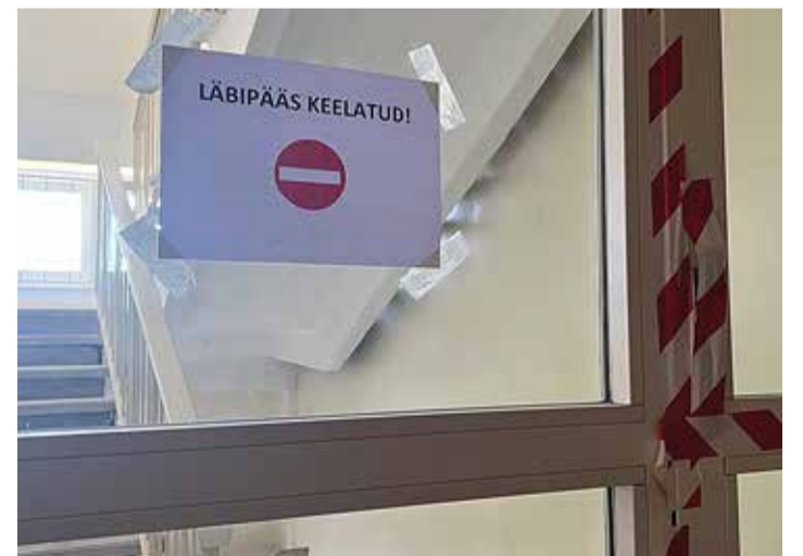
Koolimaja sees on ehitustsoon tähistatud ja kindlalt piiratud.