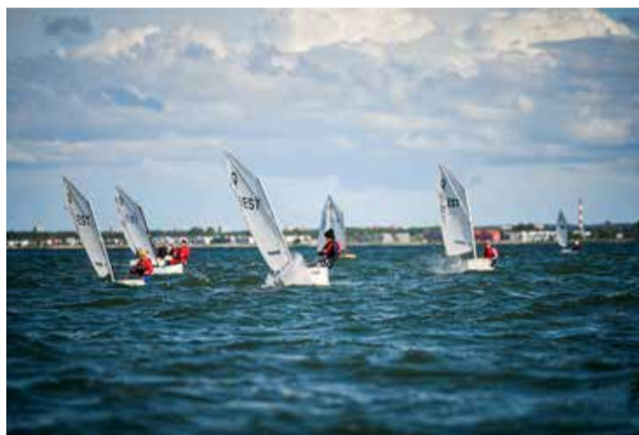
Teel karikate poole.

Ka sel suvel kutsume purjetamise algkursustele uusi lapsi. Kursused algavad 19. juunil. Kolmenädalastel kursustel saavad lapsed teoreetilised algteadmised ja omandavad praktiliste treeningute käigus Optimistidega purjetamiseks vajalikud emased tehnilised oskused. Ootame kursustele kõiki 7-12-aastaseid poisse ja tüdrukuid. Registreerimine kestab 14. juunini jahtklubi