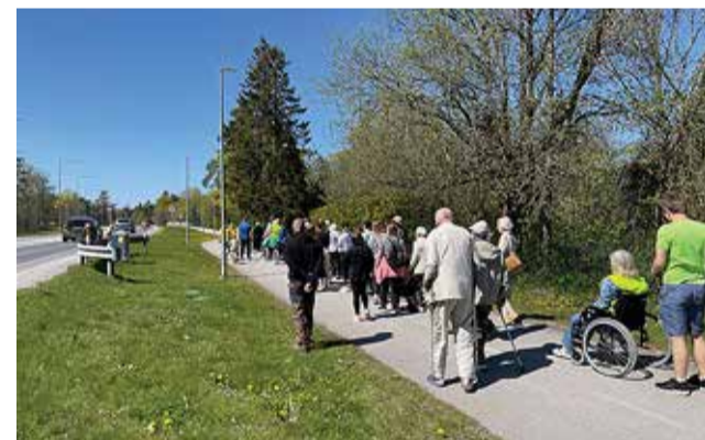
Matkajad teel Tabasalu pangale.

(Angela Adamson, Tartu ülikooli Pärnu kolledž)