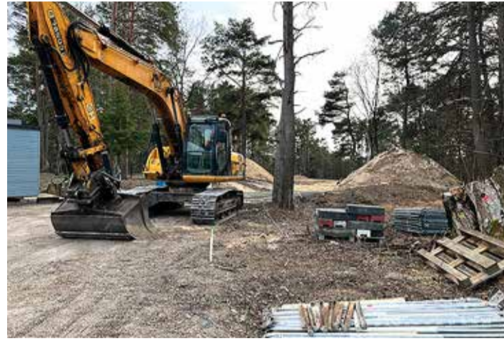
Lasteaia ehitustööd Vääna-Jõesuus. 7-rühmaline lasteaiad valmib järgmiseks kevadeks.

keskpaigaks Tallinna ülikoolilt tõenduspõhist informatsiooni, milliste aspektidega peab arvestama III kooliastmes keskkonna, õpetajate ja õppekava kontekstis. Plaanide kohaselt saame selle teema suhtes volikogu otsuse käesoleva aasta septembri lõpuks.