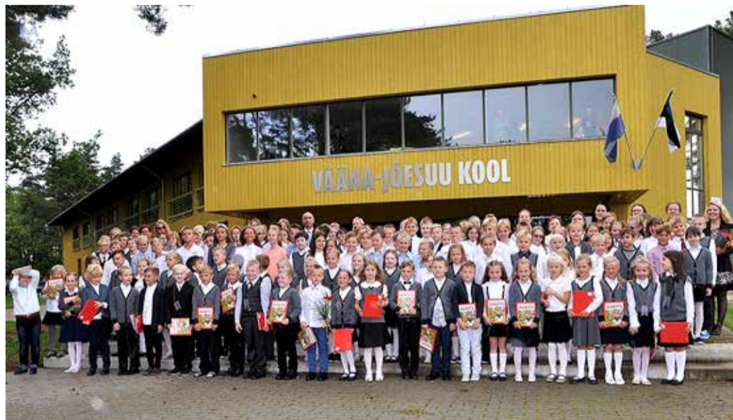
Vääna-Jõesuu koolipere.