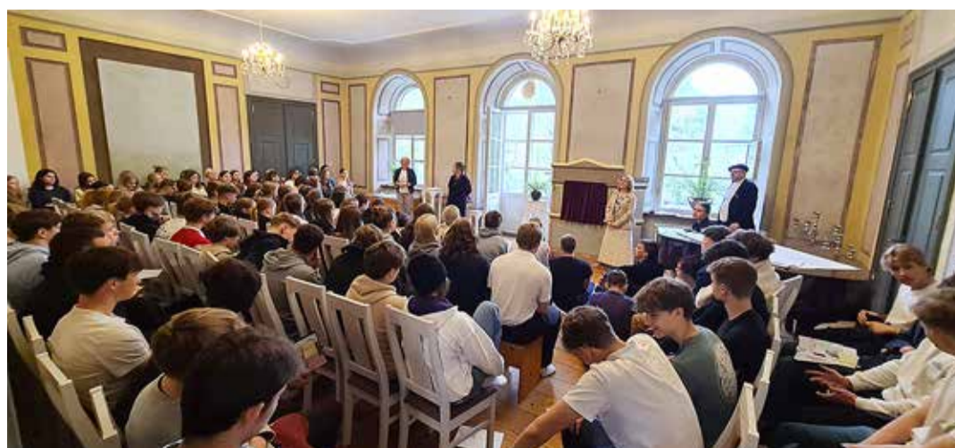
Tabasalu gümnaasiumi barokipäeval Vääna mõisakooli aulais.