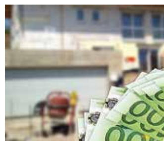
Lasterikaste perede kodutoetuse taotlusvoor avaneb 29. mail.

Toetus on suunatud peredele, kus kasvab vähemalt kolm kuni 19-aastast (19 k. a) last, kes moodustavad ühise leibkonna ja kelle 2022. aastal saadud maksustav tulu leibkonna liikme kohta kuus jääb alla 450 euro.