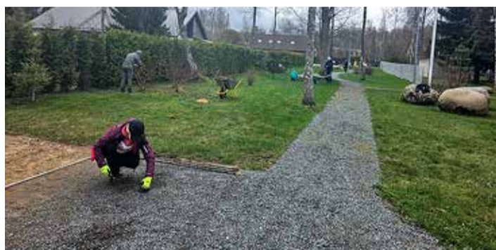
Kohalikud elanikud panustavad mänguväljaku-spordiplatsi hooldusesse ühiselt.

Koostegemise tahet on jätkunud ning ühised heakorrastu-