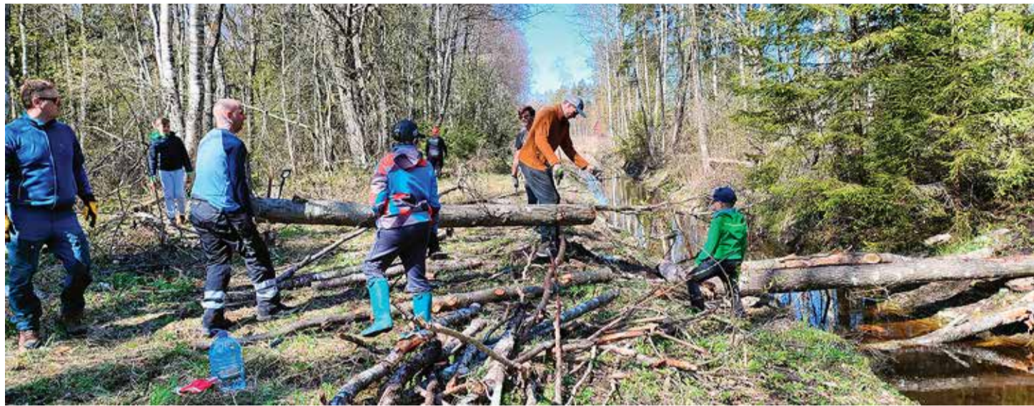
Rohesildade ehitusel kasutati sillapalkideks tormis langenud puid. / Fotod: Vääna kogukond