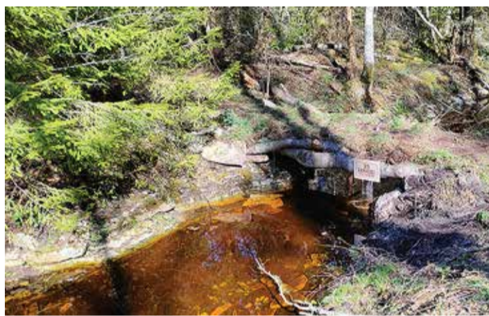
Valminud rohesild on kaetud peenravaiba ja mätastega.

gida, kes ja kui aktiivselt uut liikumisvõimalust kasutavad.