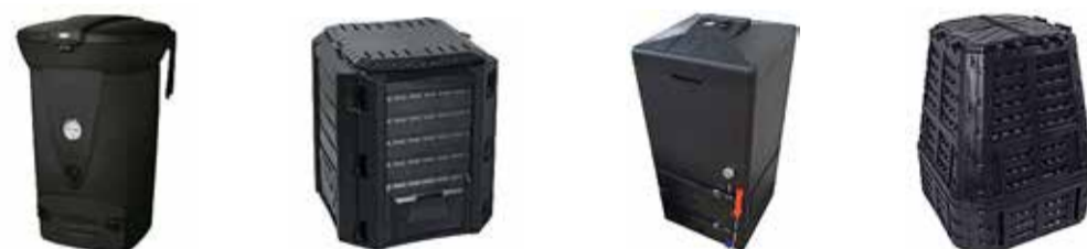
Eri suuruses kompostrid, mida müüakse ehitus- ja aiatarvikute poes ja on külgedelt kinnised ning pealt kaanega.

Seega isegi kui majapidamises on olemas köögihunn, ei vabasta see jäätmevaldajat kompostri või biojätmete konteineri kasutamise kohustusest.