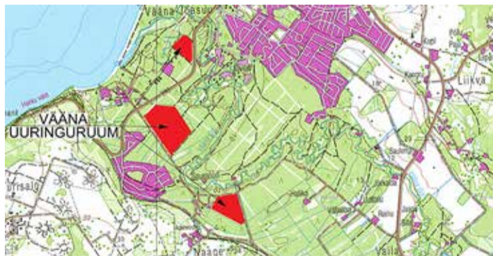
Kavandatavad uuringualad (punasega) kolmel maatükil. / Kaart: maa-amet

Tänavu 29. juunil peetud vallavolikogu istungil otsustati ühel häälel mitte anda Sokkel Karjäärid OÜ-le luba maavarade uuringuteks Vääna-Jõesuu külas. Kaevandusfirma vaidlustas keelduva otsuse ja jätkab loa taotlemist kohtu kaudu vallaelanike vastuseisust hoolimata.