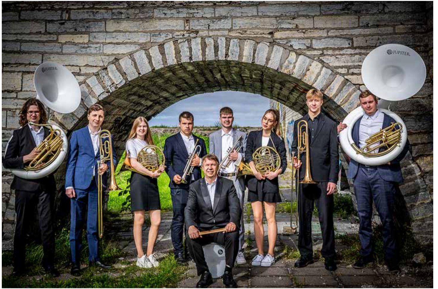
Tabasalu Brass Tallinna linnahalli kaare all. / Fotod: Rene Mitt

Tabasalu Brass on esindanud meie valda paljudel üritustel. Eriliselt teeb aga rõõmu nende valmisolek muuta oma esinemisega pidulikmaks ka valla enda ettevõtmised ja sündmused.