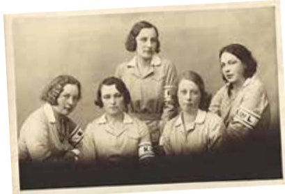
Naiskodukaitse Harju ringkonna ennesõjaaegsed juhtfiguurid.

Harku jaoskond kogub isiklike kogemusi ja pilte inimestelt, kes on olnud seotud naiskodukaitse või kaitseliiduga või kelle esivanemad kuulusid nendesse organisatsioonidesse.