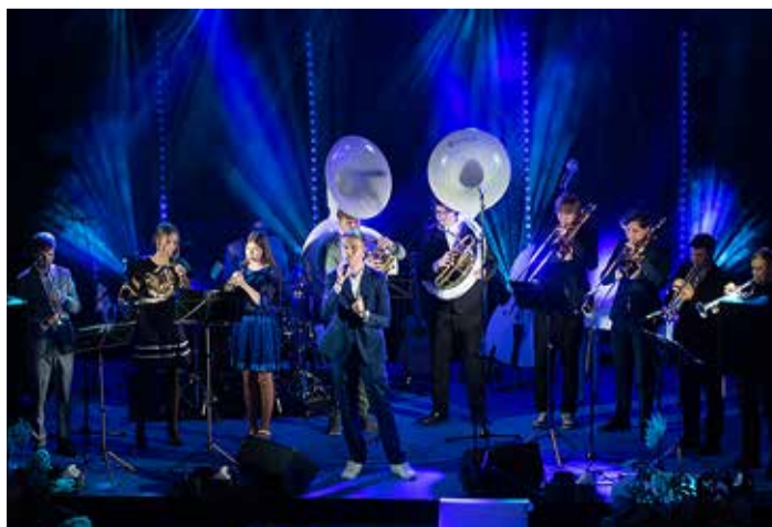
Tabasalu Brass esinemas Harku valla vastuvõtul möödunud aasta sügisel.

Eelmisel aastal andis Tabasalu Brass ligi 30 kontserti üle Eesti ning pälvis Tabasalu muusika- ja kunstikooli aktiivseima esineja tiitli. Ansambel on esinenud ka firmapidudel, eraüritustel ja tähtpäeval. Tänu laiale repertuaarile on Tabasalu Brass sobiv igale üritusele või sündmusele ning annab publikule hea annuse nooruslikku energiat.