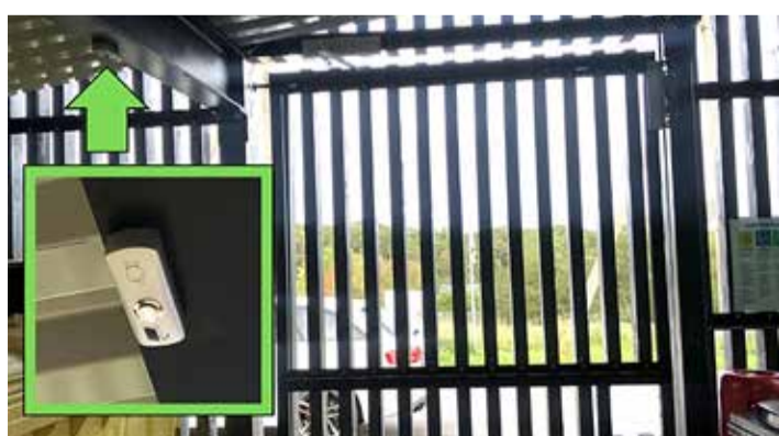
Avamise nupu asukoht jäätmemajas.

arendus- ja haldusosakonna keskkonnaspetsialist