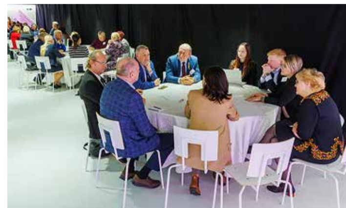
Omavalitsuspäeva töötubades "Paindlikud lahendused hariduses – võtmeks õpetaja" ja "Paindlikud lahendused hariduses – võtmeks haridusvõrk" lahati teemasid mitme kandi pealt.