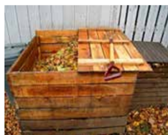
Kinnise kompostri võib ka ise ehitada, aga komposter tuleb vooderdada metallvõrguga ja ehitada peale kaas.

kehtestatud nõuetele ja ühis-kanalisatsiooni juhitav reovesi ei tohi kahjustada ühis-kanalisatsiooni toimimist. Täpsemad nõuded kehtestatakse kohaliku omavalitsuse ühisveevärgi- ja kanalisatsiooni kasutamise eeskirjas. Jäätmeseadus näeb ette, et köögi- ja sööklajät-