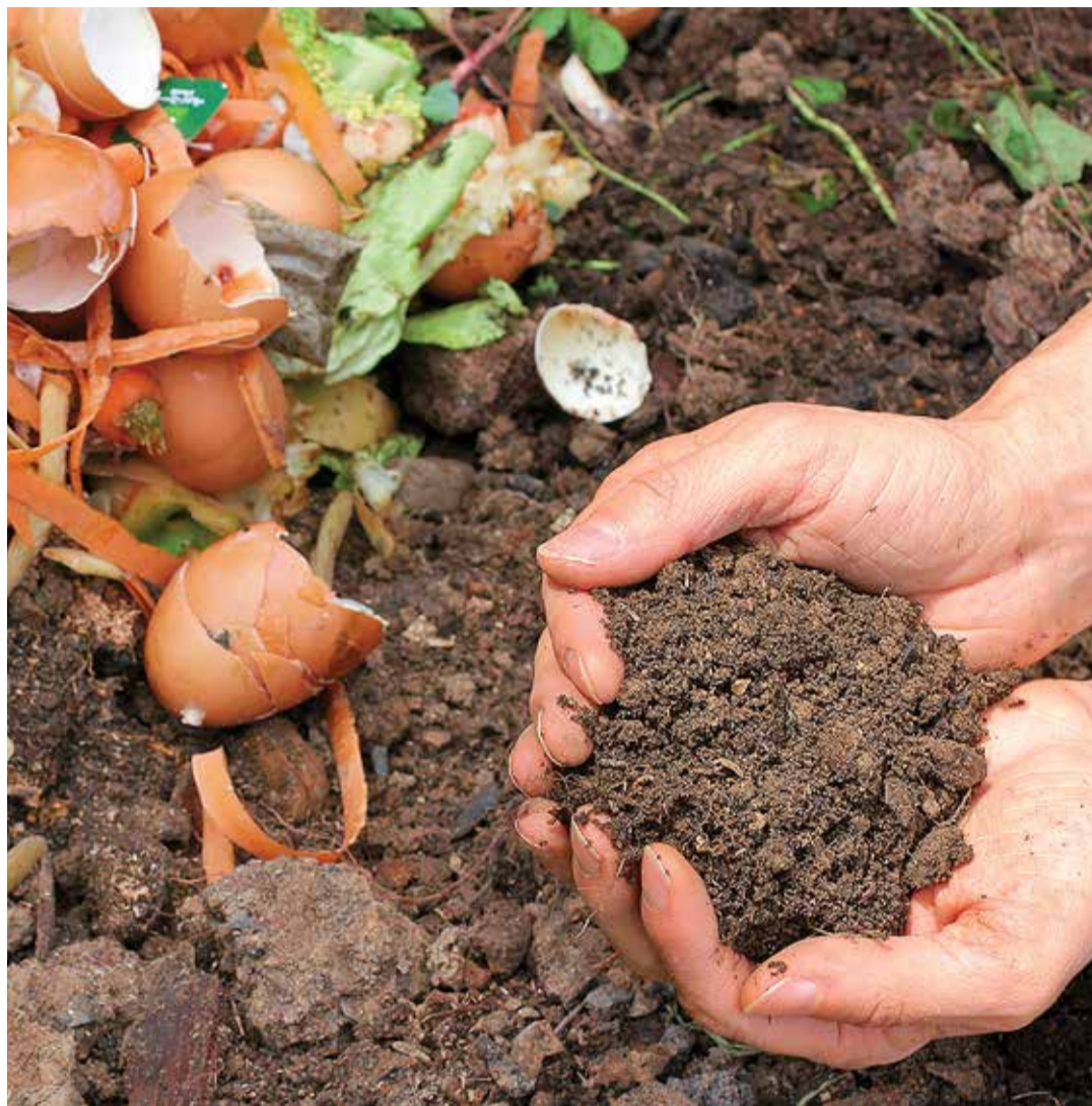
Biojätmetest saab teha väärtuslikku komposti.