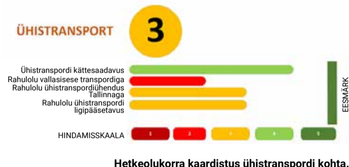
Hetkeolukorra kaardistus ühistranspordi kohta.