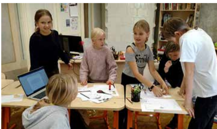
Väana Talendipunkti lapsed.

Seda kinnitab ka õpilaste endi mõte, et talendipunktis