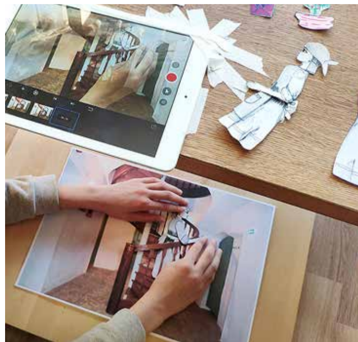
Töö talendipunktis.

osalemine on andnud neile varasemast erinevama võimuse end proovile panna, mis omakorda toetab mõtet, et neil on midagi, mida maailma hüvanguks kasutada.