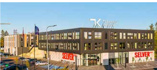
Tabasalu Keskus sai aastaseks.

Tabasalu Keskus tänab kõiki rentnikke, kliente ja külalisi: "Aitäh, et olete meiega olnud terve selle aasta. Loodame, et jätkame naabrina, kelle küllastamist kõik alati ootavad." (HVT)