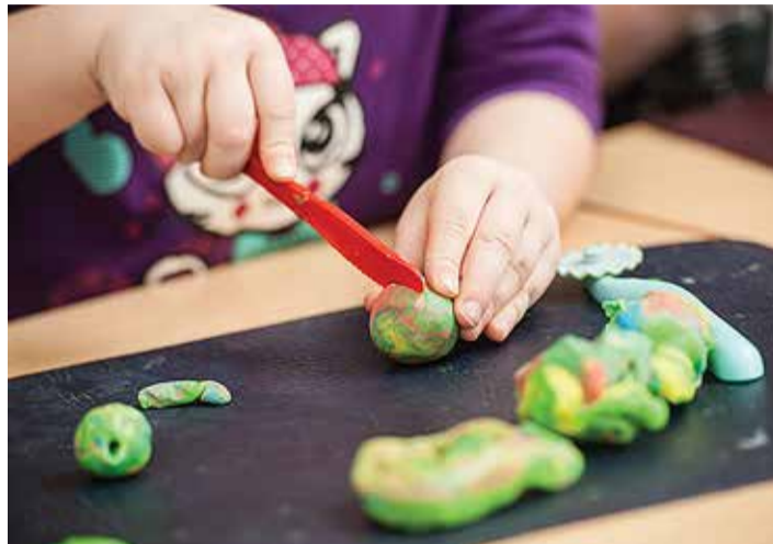
Sõimerühmade komplekteerimine algab maikuus.

Järgmisena komplekteeritakse tasandus- ja arendusrühm ning seejärel, ajavahemikus 2.–15. mai on planeeritud