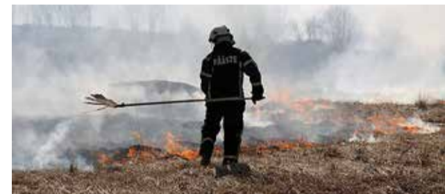
Kulupõleng on väga ohtlik.

Kulupõletamine on ohtlik ja kõikjal Eestis keelatud! (Allikas: päästeamet)