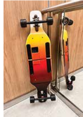
Õpilasfirma Longfold valmistatav kokkumurtav pikkruula, mille eest pälvib tiim uuenduslikkuse preemia.