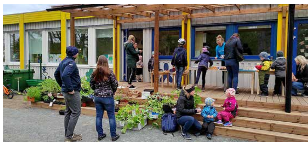
Taimelaat toimub teist aastat.