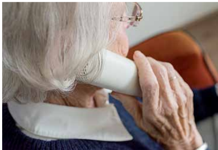
Eestis on suurusjärgus 200 üldhooldekodu, kus elab umbes 10 000 eakat.

Kohatasud on hooldekodudes erinevad ja omaavalitsusel võib olla hoolduskulude tasumisele seatud piirmäär. Piirmäär ei ole takistuseks hooldekodukoha leidmisel, kuid võib olla eba- piisav kõigis hooldekodudes hoolduskulude katmiseks ja