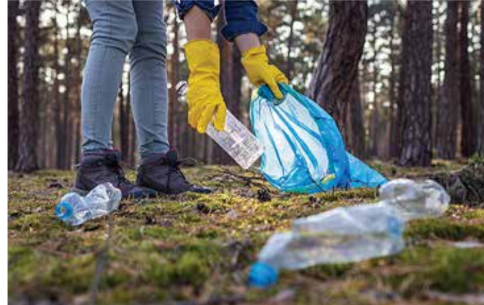
Maikuu esimesel nädalavahetusel toimuvad koristustalgud üle valla.

(FB üritus on loodud kolmes etapis: 15.–30. aprill ning 1.–15. ja 15.–31. mai) Mõnusat prügisõrkimist!