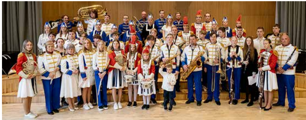
Pärast meeleolukat sünnipäevakontserti.