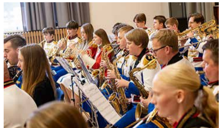
Muusika teeb meele rõõmsaks.

Harku valla rahvast kutsun Tabasalu muusika- ja kunstikooli puhkpilliorkestri esinemistele ja üldse kasutama võimalust, et Harku vallas on palju muusikakollektiive, keda kuulata. Kutsun lapsevanemaid üles lapsi suunama muusikat õppima. See annab paljudele uurimustele tuginedes laste arengule suure edasiminek.