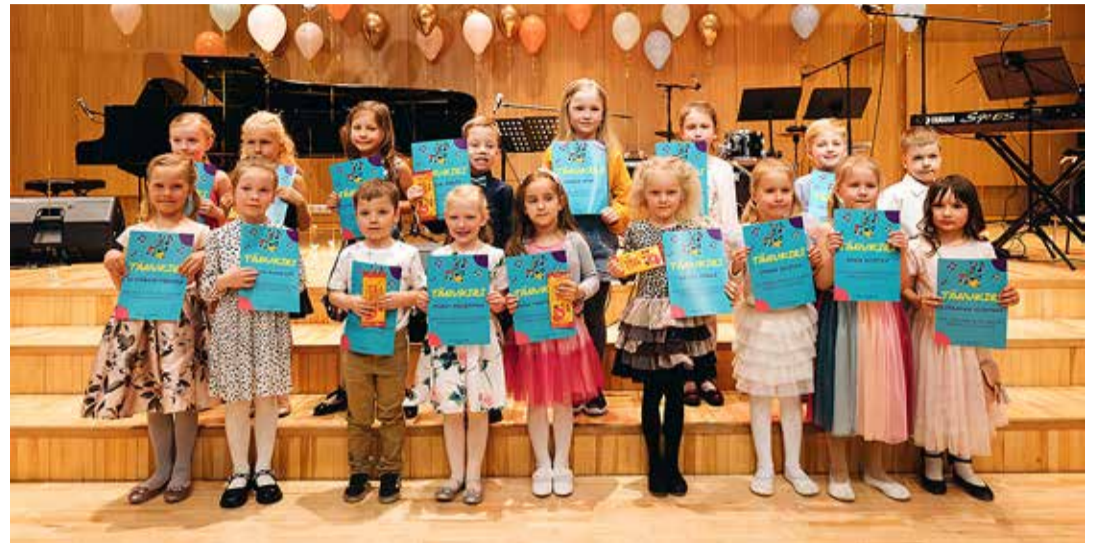
5–6-aastaste vanuserühma laululapsed.

saadeti lauluõpetajatele järgmisel päeval e-postiga.