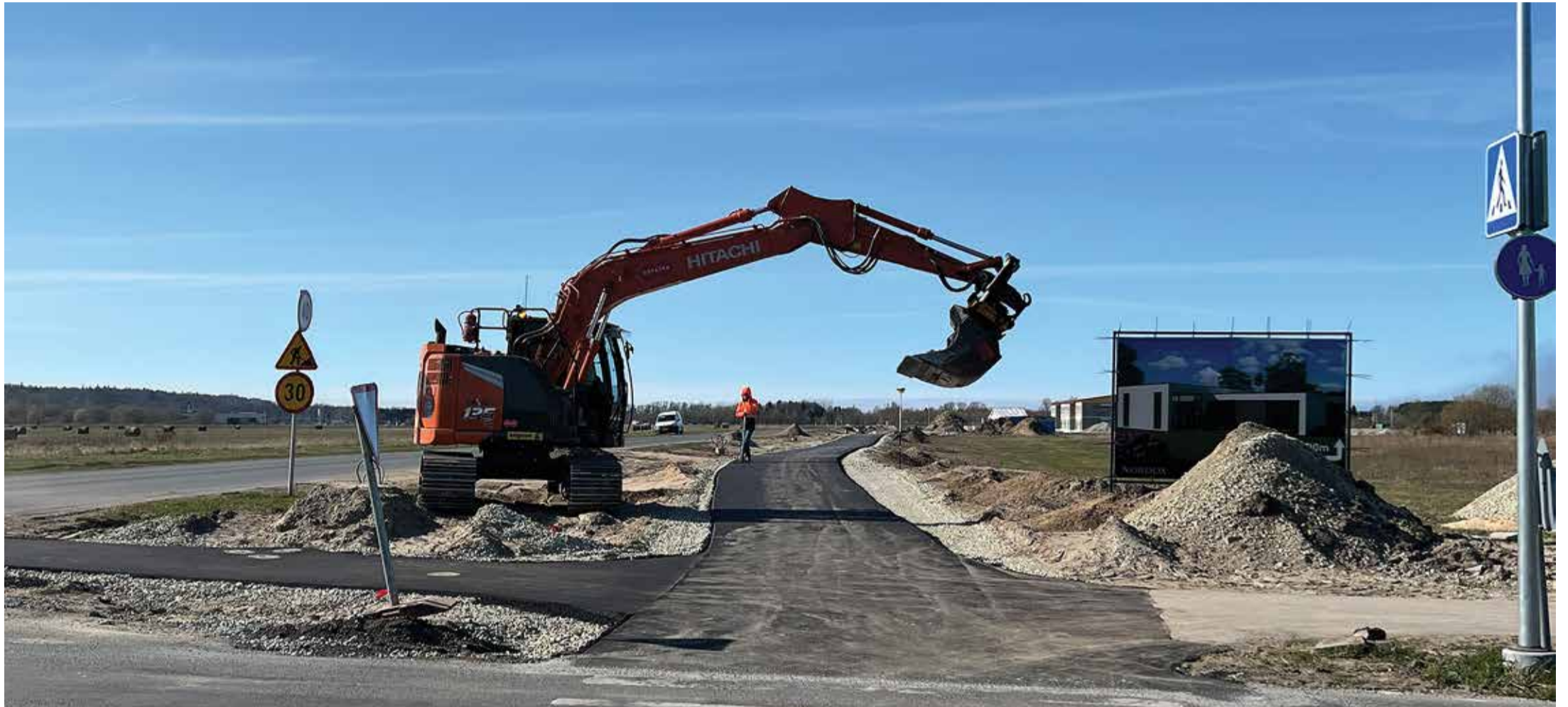
Tiskre külas käib Liiva tee kergliiklustee ja valgustuse rajamine täie hooga.

Lasteaia-kohtade eraldamine Harku vallas 2023/24. õppeaastaks Lk 3