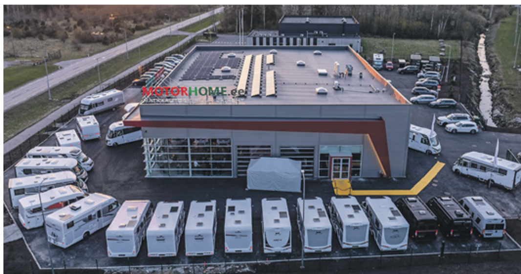
Matkaautosid maja ümber mahub, territoorium on kokku üle 6000 ruutmeetri.

saaks,” kirjeldas Valtri. „Kolides tundus, et meil on nüüd piisavalt tootmispinda laienemiseks vähemalt kolmeks aastaks, kuid juba kolme kuu pärast olime ruumipuuduses.“