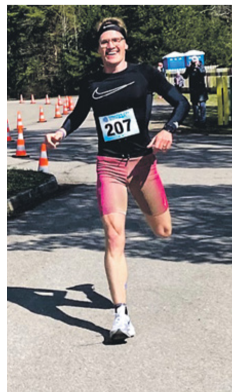
Võitja finiš.