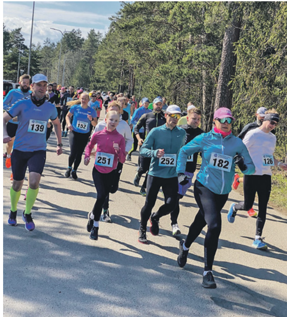
Jooksumõnu jooksurajal.