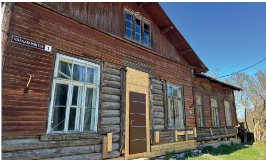
Vääna endine raudteejaamahoone.

Loomulikult, elementaarne. Kui vaatad 100-200 aastat vana ust ja keegi on sinna mingi torx kruvi sisse keeranud, ajab ikka harja punaseks küll, see lausa karjub näkku. Mitte seda, et ma vanu naelu sirgeks taon, kui ei ole midagi väga