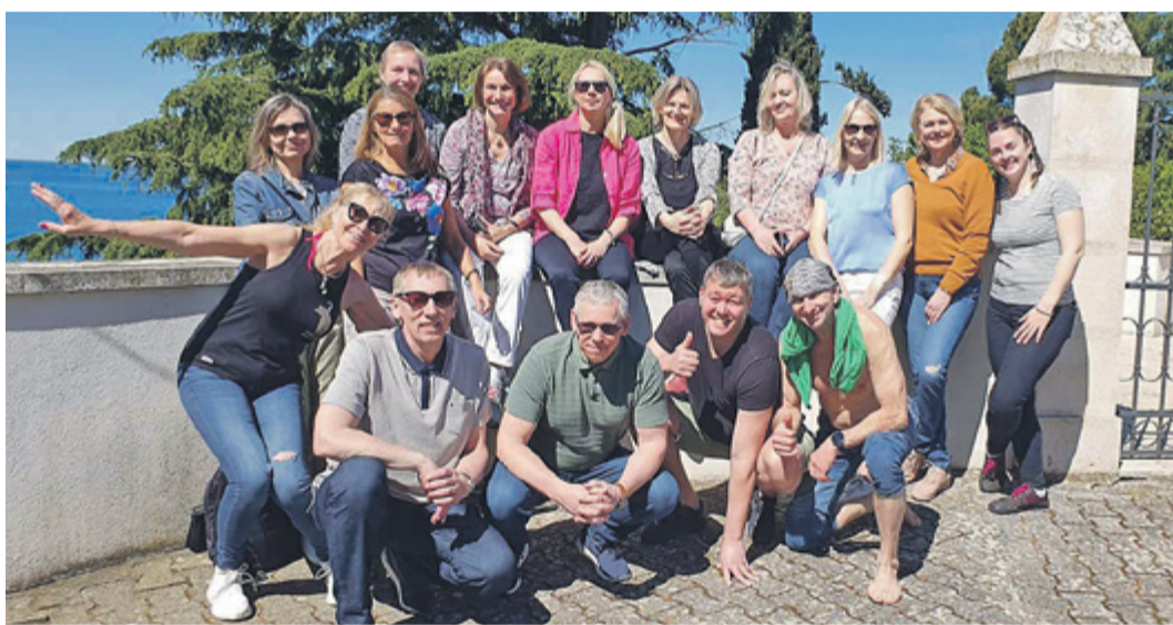
Tabasalu koori ligi nädal kestnud reisi mahtusid avastusretked Horvaatias, Sloveenias, Itaalias.

Tabasalu Kammerkoor osales 19.–21. aprillil Horvaatias Istras toimunud rahvusvahelisel koorifestivalil.