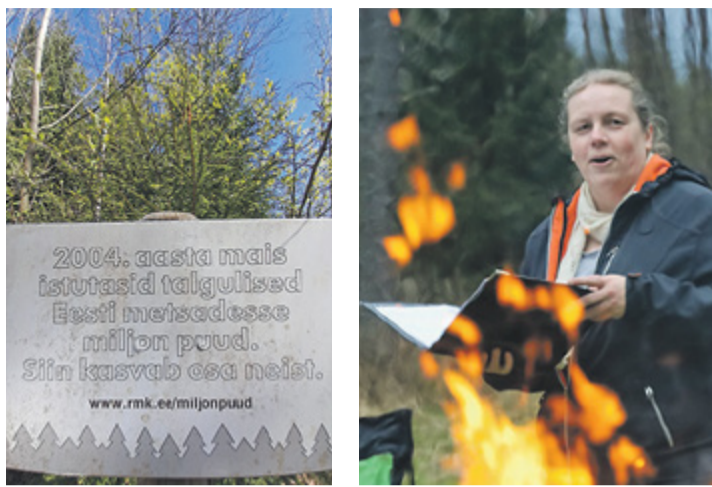
27. aprillil toimus Väana metsas jüripäeva matk.

Meie kandi unikaalne pärandkultuur ja nüüd siis ka hästi kaitsitud looduskosulus saavad kokku Väana metsas. Mõõda siinseid metsaradu tulid kaheksasada aastat tagasi ilmselt tollased usuaktivistid, kes ristiusu meie kandi vanaküladesse tõid. Seda võib ju mitmeti tõlgendada, aga sellisel Liikva, Sõrve, Ilmandu, Adra ja teiste vanakülade rahvas esimest korda Euroopasse integreeriti. Huvitav oli kevadisest metsas, kus vanad teed ja rajad hästi looduses nähtavad, liikuda ja aja kulgemise üle mõtiskleda.