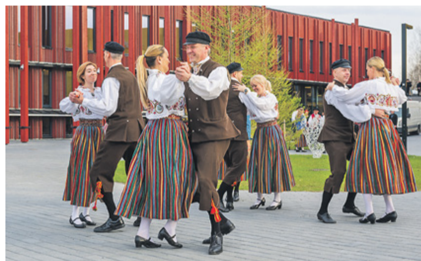
Harjumaa rahvatantsurühmad Tabasalus rahvusvahelisel tantsupäeval tantsimas.