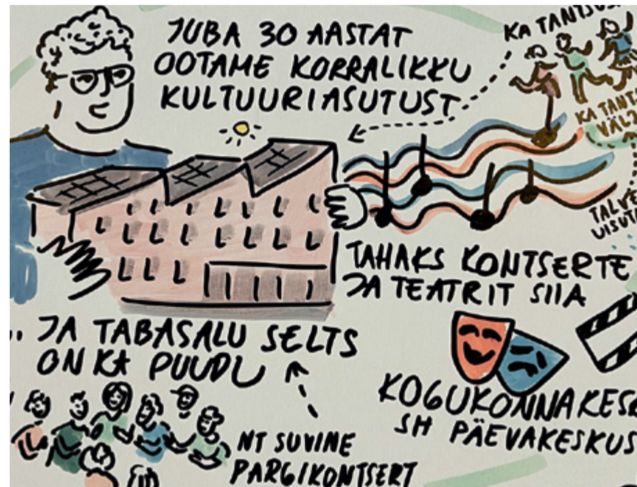
Möödunud Tabasalu päeval laekus hulga ettepanekuid kultuuri- ja kogukonnakeskuse ehitamiseks, mille visualiseeris Joon Meedia.

Sellise maja teoks tegemiseks tuleb seda algusest peale arendada koos kogukonnaga ja siin vajame väga teie kõigi abi – loovaid ideid ja uuenduslikke läheneviise. Et neid teada saada, plaanime korraldada arutelusid ja kohtumisi, et kõik inimesed saaksid kaasa rääkida ning kultuuri- ja kogukonnakeskuse loomises osaleda. Mõtete ja ettepanekute põhjal