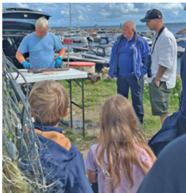
Kalapuhastamise töötuba Tilgu sadama päeval.