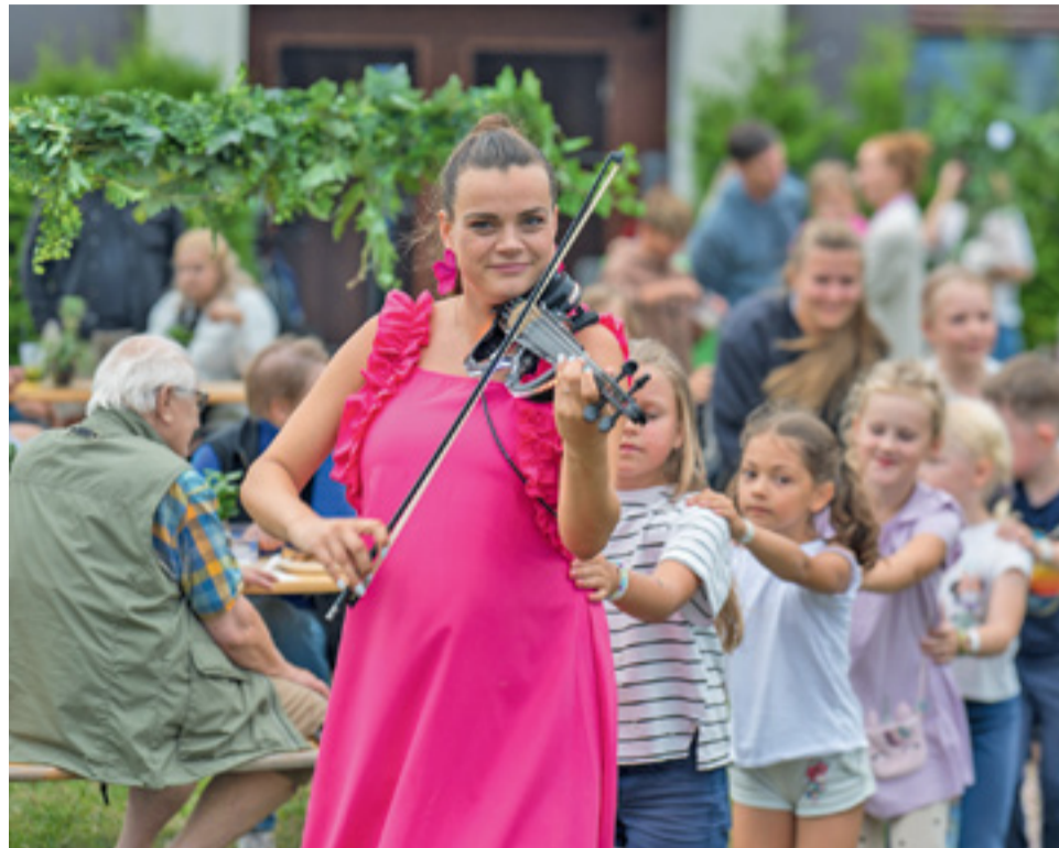
Kontsert marimelli hoovirestoranis.