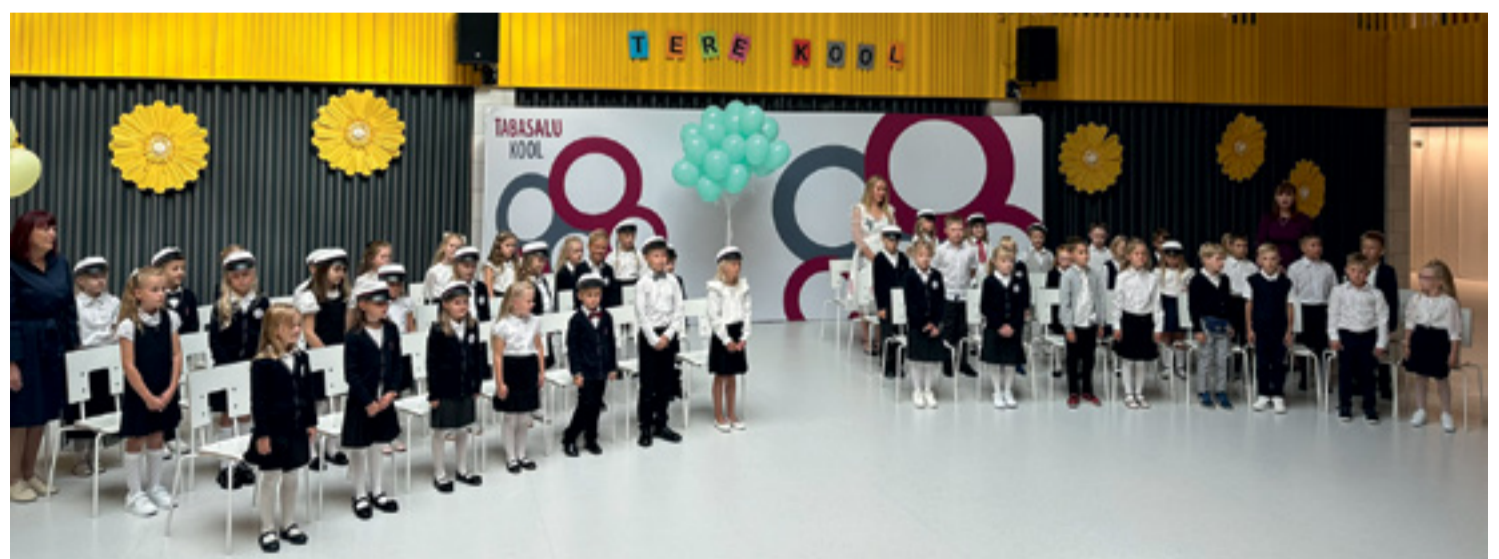
Aabitsate ootuses: hetk Tabasalu koolist esimesel koolipäeval.

Kõige rohkem esimest korda kooliteed alustajaid on Tabasalu koolis, kus aabitsad sai 112 last. Kaks klassitäit lapsi alustas kooliteed Harkujärve põhikoolis, Murastes läks 1. klassi 46 ja Väana-Jõesuus 24 õpilast ning Väana mõisakoolis alustas kooliteed 19 last.