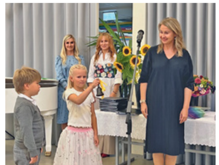
Nii helises esimene koolikell Muraste koolis.