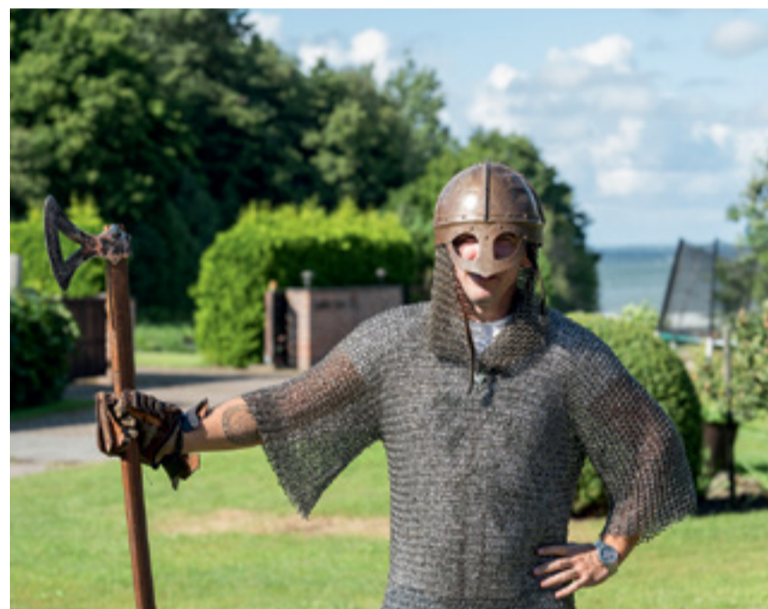
Meriküla viiking.

Harku valla Avatud külade festival oli erakordne kogukondlik sündmus, mis tõi elu ja elevust neljal nädalavahetusel. Festival, mis toimus uues formaadis, haaras endaga 12 külapäeva ja avas ukse 41 kodukohvikule. Iga nädalavahetus oli täis naeratusi, maitsvaid elamusi ja sooja külalislahkust, mis tõi kokku nii vanad sõbrad kui ka uued tuttavad.