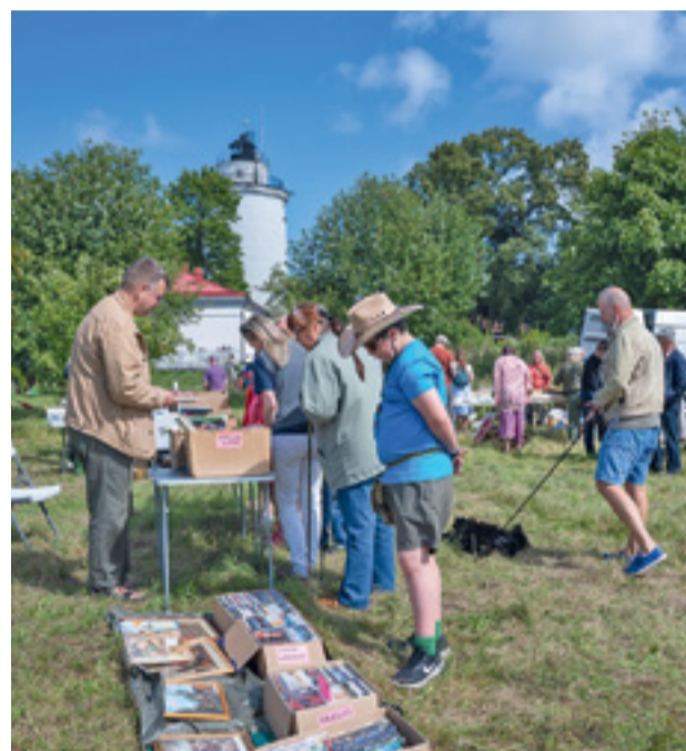
Suurupi vanavara- ja käsitöölaadal.