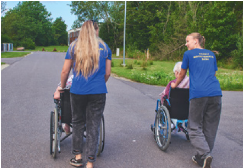
Malevlased said suvel proovida paljusid erinevaid töid.

Katri (Harkujärve lasteaed) kirjeldas koostööd malevlastega: "Igal hommikul kohtudes noortega tegime nendega vestlusringi. Saime omavahel tuttavaks ja igaüks rääkis, milliseid töid nad on teinud, kus abiks käinud, mis on olnud kõige põnevam ja mis võiks olla uus ja huvitav. Noored oli lõbusad, aktiivsed, töökad, kordagi ei öelnud keegi töödele "ei". Õpetajametile peale pani vist nii mõnegi noore mõtlema."