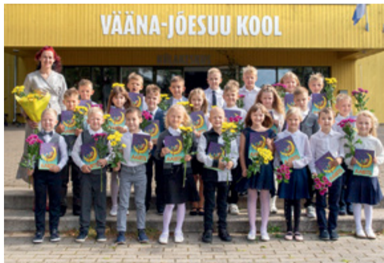
Väana-Jõesuu koolis on traditsioon, et esimese klassi õpilased astuvad saalist välja läbi suure aabitsa ja teevad kooli ees ühispidi.