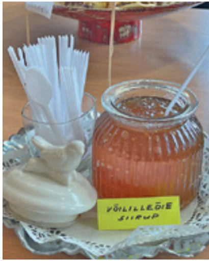
„Maitseelamused sügisandidest“ on pak- kunud alati põnevaid hoidiseid. Fantaasial pole piire, mida kõike saab purki panna.

Eks igal perenaisel on omad retseptid ja oskus hoidiseid ületalve