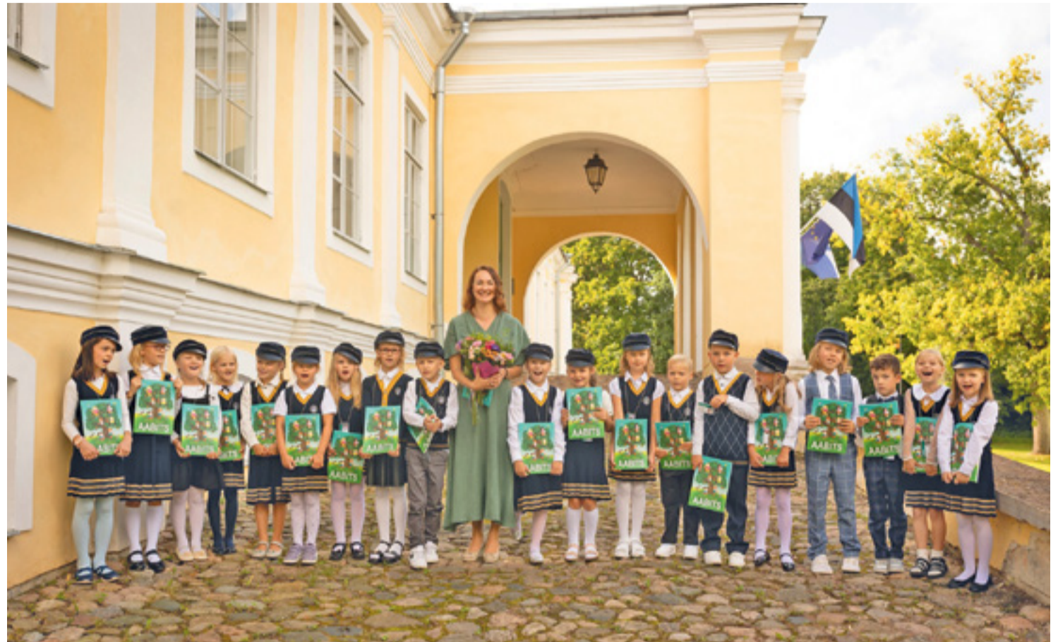
Väana mõisakooli esimene klass ja klassijuhataja.

Sel sügisel läks Harku vallas kooli 2002 last, neist esimest korda alustas kooliteed 249 last.