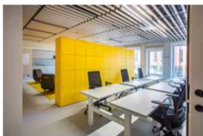
Avaramad õppimisvõimalused on nüüd kõigil Harku valla õppureil.