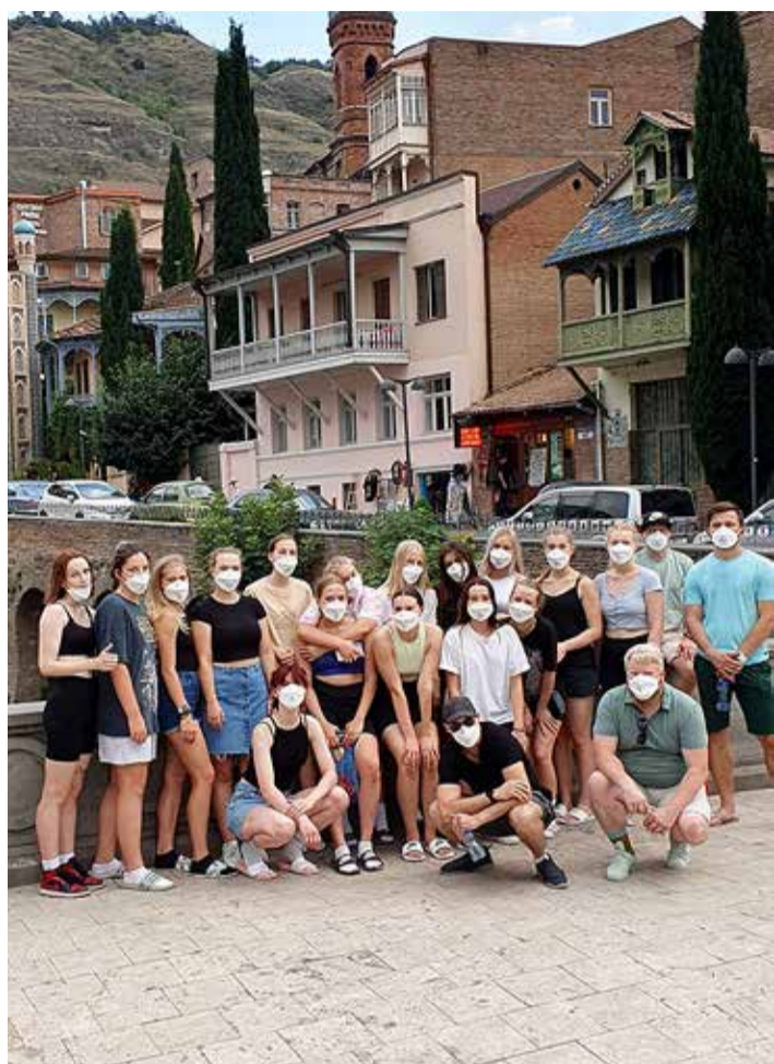
Reeglid olid karmid ja sundisid meid viibima ühes kohas, meie aga näppasime hetke ja sõitsime linna vabadusesõõmu ning vaatamisväärsuste järele.

trenn. Öhtusel mängul jookseb Itaalia meist üle, nii et tüdrukud ei saa vahepeal aru, kus on taevast, kus on maa ... Oleme saanud maitsta võistluste taset.