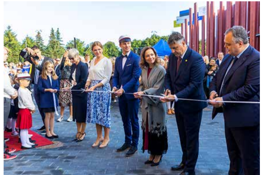
Lint on lõigatud ja hariduslinnak pidulikult avatuks kuulutatud.