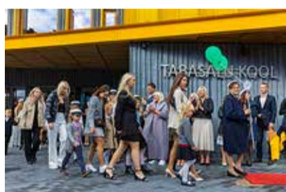
Esimese klassi õpilased läksid abiturientide käevangus uude hoonesse.