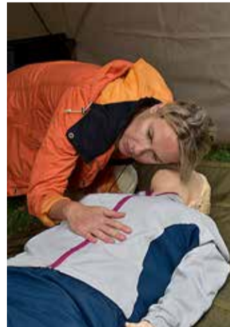
Kas tead, kuidas kriitilises olukorras käituda? Mina nüüd tean, tänu naiskodukaitsse õpetusele.