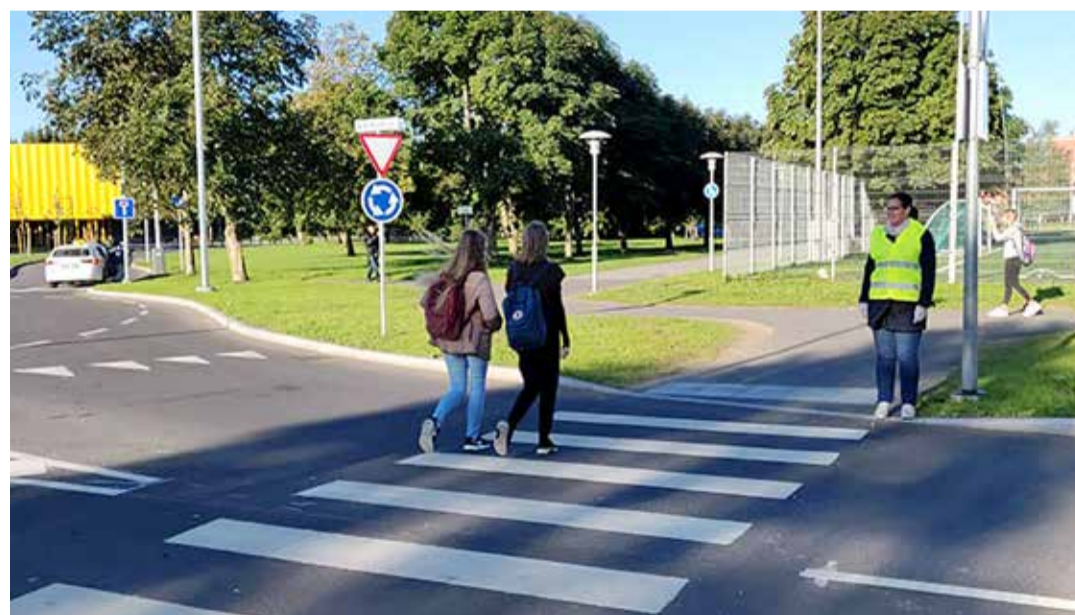
Ka sel aastal olid vallavalitsuse töötajad hommikuti Tabasalus kooli lähedal valvepostil, et vajadusel lapsi liiklusküsimustes aidata.

Olenemata sellest, et rattaga võib ka üle tee sõita, tasuks siiski lapsi õpetada teed üle-