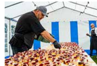
Laul on kook, mis ka kook on.