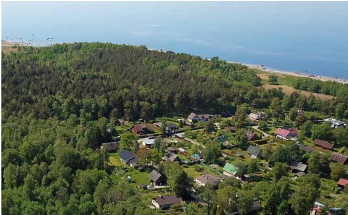
Praegu pakutakse Harku vallas portaali Kv.ee andmetel 85 maja, 41 majaosa, 32 korterit ja 136 kinnistut. Lähiaastatel on lisandumas uued projektid.

langusest ja üüripakkumiste arv on vähenenud. Aasta lõpuks oodatakse üürihindade täielikku taastumist. Võib öelda, et kinnisvaraturg kasv on olnud tunduvalt kiirem kui majanduskasv Eestis tervikuna. Kuid muretsemiseks ei ole analüütikute hinnangul põhjust, sest laenureeglid pankades on karmistunud ja omafinantseeringu osakaal kasvanud, mis peaks vähendama riskimise ohte.