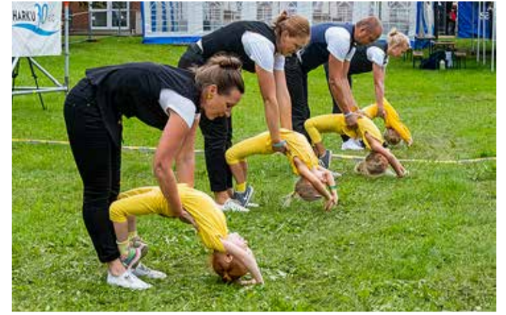
Esimesed Tabasalu Päeva esinejad olid meie kõige pisemad ja nende akrobaatiliste võimetega vanemad.