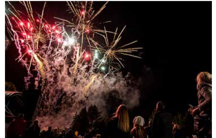
Tabasalu Päeva, viimase augusti laupäeva lõpetab ilutulestik. Kuidas siis teisiti?

punkti kõrval asuvast kartulispiraaliputkast, mille ees lookeb hirmipikk saba. Ei jaksa ootama jääda, pealegi oleksin järjekorras ainuke täiskasvanu. Ka jääjoogi- ja suhkruvatikiiosk on rõõmsalt sädistavate laste piiramisrõngas.