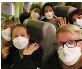
Lennukiselfi. Juhuu, siit me tuleme!

Kõik tüdrukud said lisaks lõunamaa kuumuse nuusutamisele aimu ka käsipalli tase-mest Euroopas, ja loodetavasti indu edasisteks treeninguteks ning kahtlemata kuhjaga kogemusi.