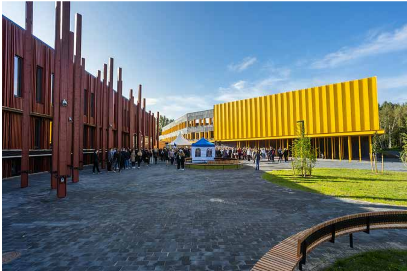
Tabasalu riigigümnaasium (vasakul) ja Tabasalu kool. Linnakusse kuulub ka Tabasalu muusika- ja kunstikool.