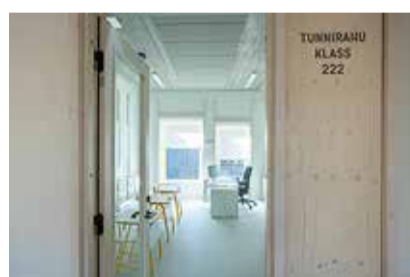
Õppekeskkond aitab noortel oma andeid arendada parimal võimalikul viisil.