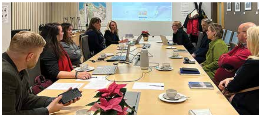
Nõupidamine vallamajas.

Kokkulepete saavutamine võib küll olla keeruline, aga on ka häid näiteid ja praktikaid nii meie oma vallast (Muraste kool ja külaselts)