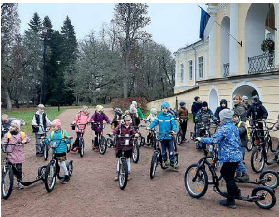
Maastikurattaid proovimas.

Nagu liikuma kutsuvale koolile kohane, siis liigume iga ilmaga! (Väana mõisakool)