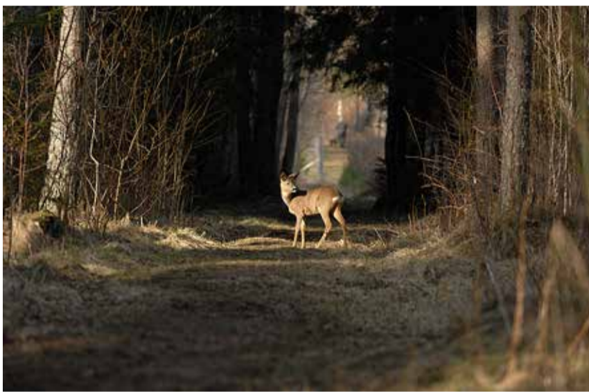
Metskits Sõrve metsateel.

lisis, et alal on palju terviklikke tootumisahelaid, mis näitab, et seal on väga palju tippkiskjaid ja ka röövlinde. "Mõne kakuliigi asustustihedus on suurem kui näiteks Lahemaal, mis on juba sensatsioon," märkis Klein. Kindlasti tuleb pidada otstarbekaks riikliku kaitseala rakendamist looduskaitseala režiimis, seisab uuringus. Alal esinevaid väärtusi – kaitstavate liikide elupaiku ja väärtuslikke kooslusi – ohustavad ehitusarenduste surve, maavarade kaevandamine ja metsaraie, mida ei saa kahjuks tõhusalt reguleerida vaid valla üldplaneeringu ja rohevõrgustiku lahendusega.