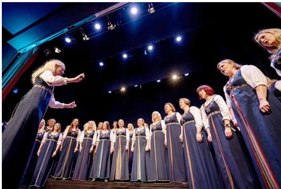
Meretule Lissabonis kontserdil.