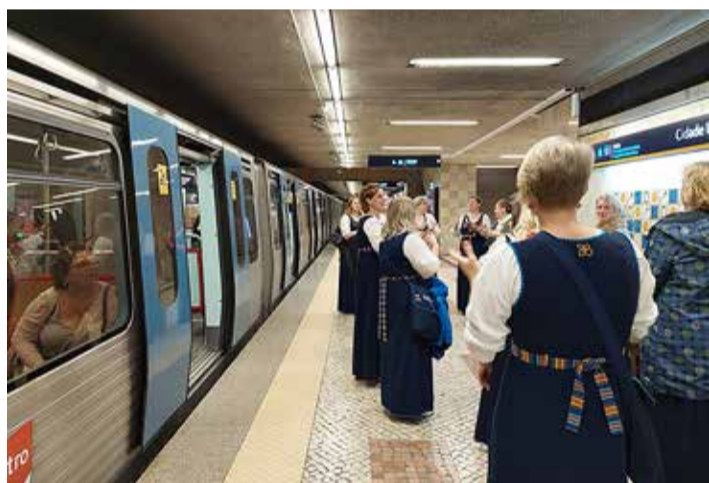
Meretule Lissaboni metroos laulmas.