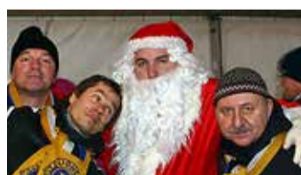
Heategijad koos jõuluvanaga.

13. novembril 2021 tähistasime ülemaailmset lahkuse päeva, mille eesmärk on tule-tada meelde maailma, üksteise ja iseenda vastu lahke olemise tähtsust. Lahkus on see, mis