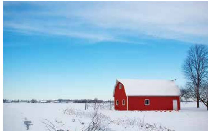
Kodualuse maa maksuvabastus jääb kehtima.

oktoobrist maa-ameti veebilehel kõigile kättesaadav. Maaomanik ei pea tegema muud, kui üle kontrollima oma maa andmete õigsuse andmekogudes. Võimaliku andmevea puhul tuleb tagasisidet anda maa-ametile.