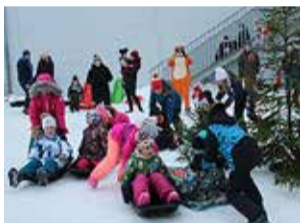
Meenutus möödunud-aastasest jõululusti peost.

Jõululusti pidu toimub Murastes pühapäeval, 18. detsembril kell 12–15.