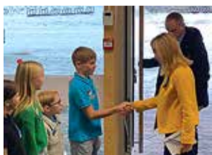
Peaminister Kaja Kallas Harkujärve koolis.