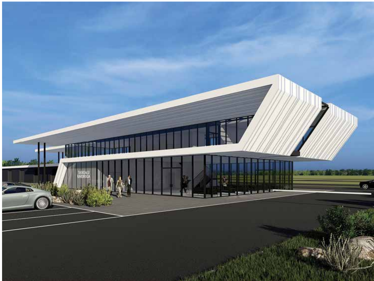
Plaan on ehitada kardirada moodsaks sõidukoolituskeskuseks. / Visuaal: Martin Aunin

Harku-Rannamõisa tee ääres asuv Tabasalu kardirada kujuneb moodsaks keskuseks, mis pakub koolitusi ja sobilikke tingimusi sõidu- oskuste parandamiseks ning ohutu liiklemise õppimiseks. Kokkulepitud aegadel antakse rada ka rulluisutajate kasutusse.