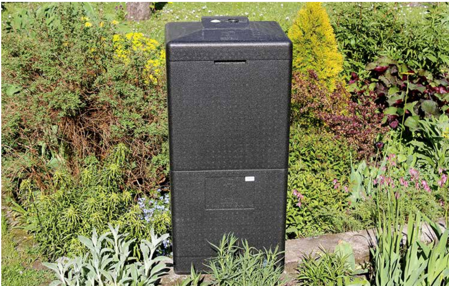
Ka teie aias võib olla selline kast, mille abil näiteks kartulikoored, puulehed, niidetud muru ja muu selline väärtuslikuks kompostiks töödelda.

Ajalooaates on kasutatud materjale Terje Urbaniku koostatud kogumikust "Seltsielu Harku vallas".