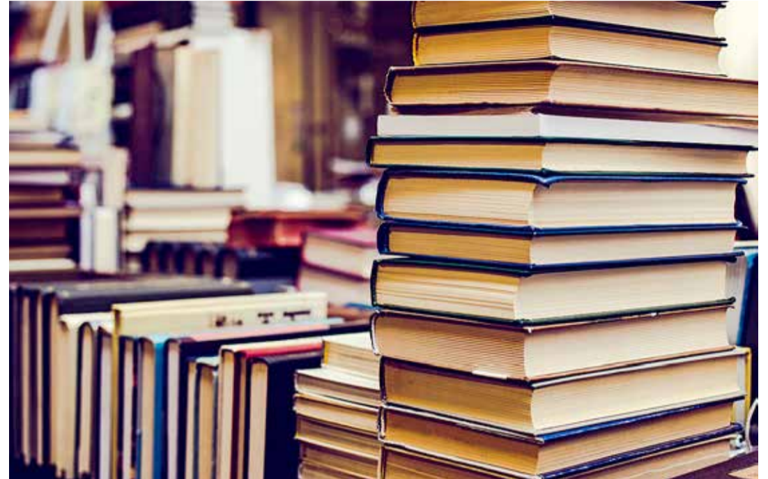
Teadmisjanus vallaelanik saab tellitud raamatule Väänasse tulevikus järele minna kasvõi südaööl.

150 aasta tagusel ajal said paruniproua eestvõttel tema isiklikust raamatukogust raamatuid laenutada kohalikud mõisatöölised ja -teenistujad. Aastal 1925 asutas Vääna Haridusselts Vääna valla avaliku rahvaraamatukogu. Raamatukogu avati Vääna mõisahoones paikneva kooli ühes toas, kus raamatud olid paigutatud