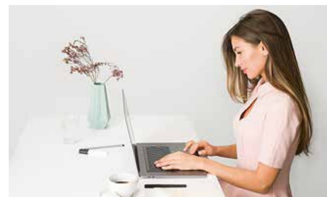
11.–16. oktoobrini saab hääletada nii pabersedeliga jaoskonnas kui ka elektrooniliselt.

Kandideerida võivad kõik hääleõiguslikud Eesti ja Euroopa Liidu kodanikud, kes on hiljemalt 12. septembriks 18-aastased ja kelle püsiv elukoht rahvastikuregistris on Harku vald hiljemalt 1. augusti seisuga.