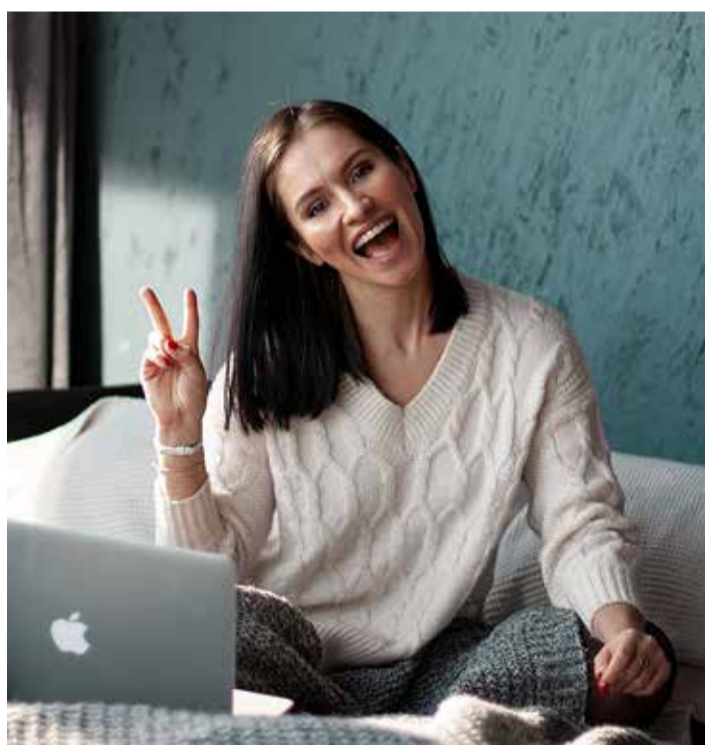
Veendu, et su andmed on õiged. Nii oled rahvaloendusele kaasa aidanud.