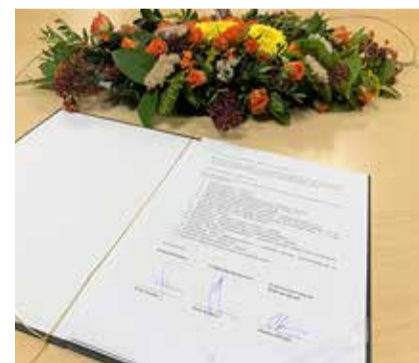
Võimuliidul on 21-liikmelises volikogus 11 kohta.

Harku vallas inimesi kaheksast erakonnast, millest seitse erakonda pääsesid volikokku.