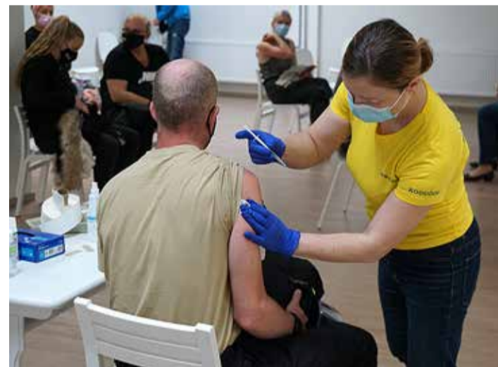
Ole kursis kehtivate piirangute ja käitumisjuhistega, vaata www.kriis.ee .

toimetulekuks hädavajaliku hankimiseks, kui see pole muul viisil võimalik, ja õues viibimiseks, kui võetakse kasutusele kõik meetmed haiguse võimaliku leviku tõkestamiseks ning toimitakse Terviseameti juhiste kohaselt.