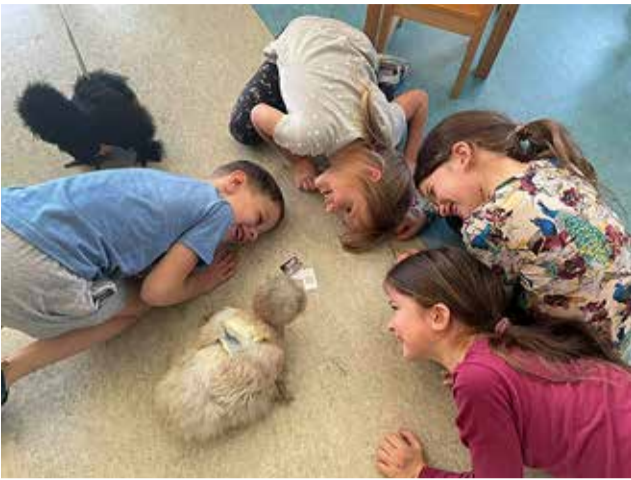
Tegevuste käigus saab jälgida suleliste reaktsioone. Arutleme, mida kanad kardavad, millal on nad julged ja uudishimulikud, millal pahurad ja kuidas võita nende usaldus.