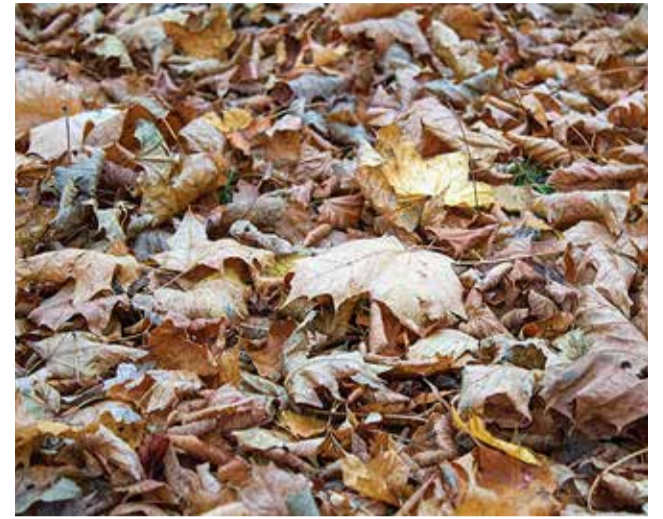
Riisumistöödega ei maksa end ära nikastada. Las lehed olla maas ja rikastavad pinnast.