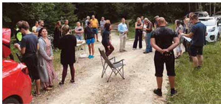
Suvel toimus RMK ja Vääna elanike koosolek, kus arutati, kuidas teha nii, et mõlemad osapooled oleks rahul.

Kevadel ja suvel kogus RMK kohalike arvamusi seoses Vääna küla ümbritseva metsa raieplaanidega. Esialgne kava nägi ette raieid juba augustis, praeguseks on protsess külmutatud kuni 2023. aasta lõpuni.