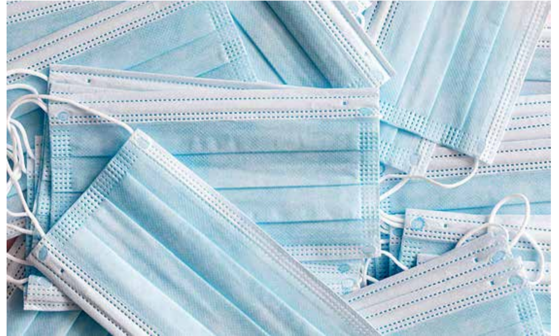
Vabariigi Valitsus koostöös teadusnõukojaga hindab iga nädal nakatumisriski riigis ja kehtestab või leevendab meetmeid vastavalt riskitasemele.