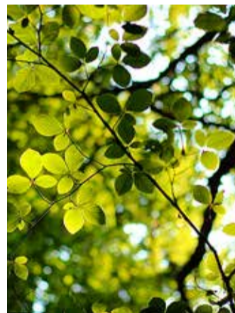
Sõrve looduskaitseala on meie piirkonna kopsud.

riigi valitsust üles kehtestama Sõrve riiklik looduskaitseala, et tagada elurikkuse riiklik kaitse viimasel pealinna vahetus läheduses säilinud terviklikul looduslal. Harku ja Saue vallas asuval moodustataval Sõrve looduskaitsealal on palju väärtusi. Muu hulgas leidub seal Põhja-Eestile iseloomulikke looalasi, metsi ja niite, rabakooslusi, lamminiite Vääna jõe kallastel, vanu palu- ja nõmmemännikuid ning soo- ja laanemetsi.