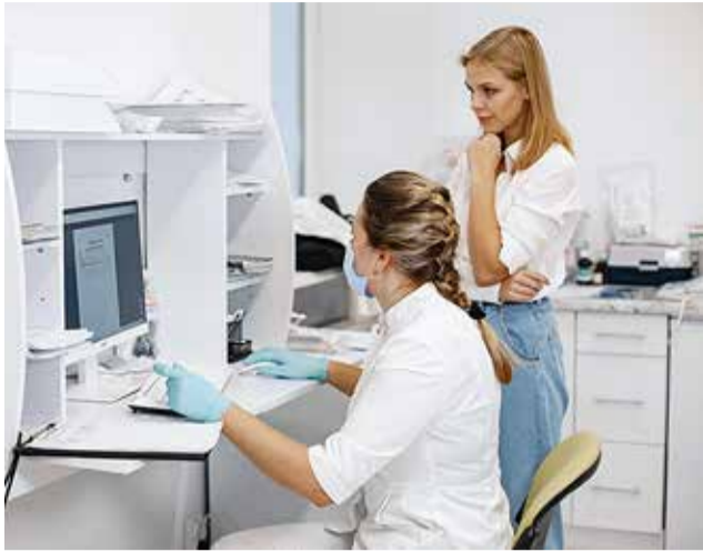
Võimalike rakumuudatuste varajane avastamine on oluline, kuna võimaldab ravi õigeaegselt alustada ning haigust saab sel moel edukamalt ravida – nii võib sõeluuring päästa inimese elu ja hoida tema elukvaliteeti.