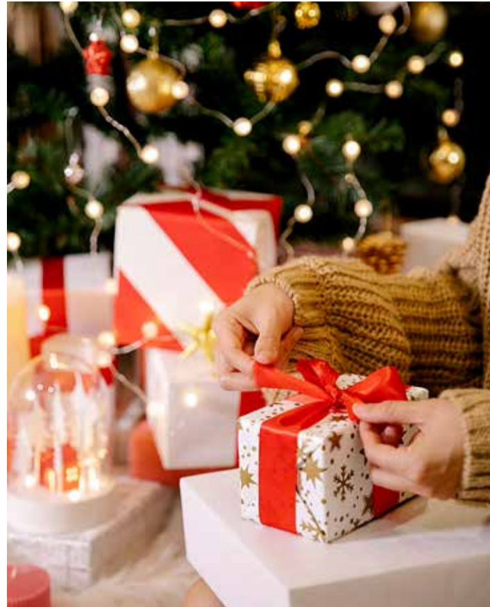
Väike meelepidamine jõulude ajal kulub ikka ära.

lauas, eakate päevakeskuses, Harku ja Vääna raamatukogus ning Kumna kultuuriadidas. Avalduse võib saata ka e-posti aadressile harku@harku.ee .