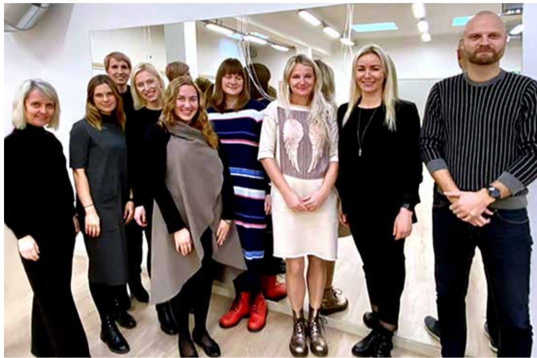
Meie haridus- ja kultuuriosakond tegutseb selle nimel, et kõigil valla lastel ja noortel oleks võimalus parimale haridusele.

või noorele, kui tal tekivad sotsiaalsed raskused või õppetingitud probleemid. Vajadusel nõustab ta ka õpetajaid või vanemaid, kuidas raskustest üle saada. Põhikooli- ja gümnaasiumiseaduse ning koolieelse lasteasutuse seaduse järgi on tugispetsialistid logopeedid, eripedagoogid, koolipsühholoogid ja sotsiaalpedagoogid, kuid õppeasutuses võivad töötada muud lastele ja noortele