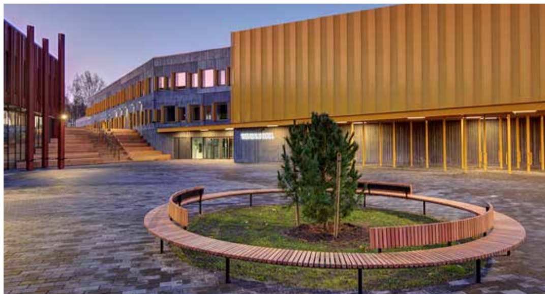
Tabasalu hariduslinnak, kuhu kuuluvad Tabasalu gümnaasium ja Tabasalu kool, avati eelmisel sügisel.

6. Kindluse kool, Roheluse tee 4, Järveküla, Rae vald, Harjumaa