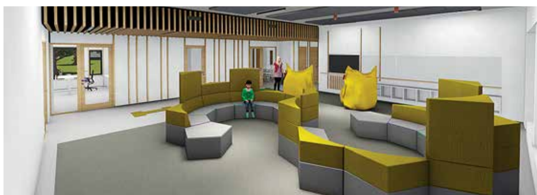
1.–6. klassid asuvad hoones oma tiivas koos suure rekreatsioonialaga. / 3D-eskiis: Doomino Arhitektid

Kui sellest ei piisa, kaasaetakse toe vajaduse hindamise protsessi Rajaleidja keskuste nõustamismeeskonnad ja spet-