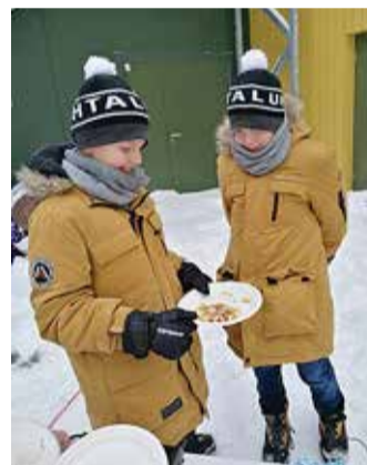
Väana-Jõesuu noored löid kaasa suure vahvlikupsetustrallis.

juba liitunud TikToki keskkonnaga, teistel keskustel ja tubadel (aga ka Harkujärve omal) on Instagrami ja Facebooki kontod, kust infot saada. Kõige popim on noorte seas