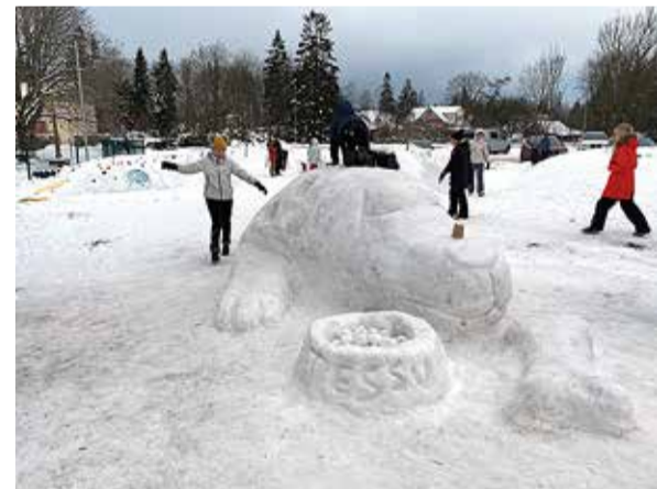
Hiigelsuur Tessu on lamava asendi sisse võtnud, tema ees kauss ja kopsakas kont. Iga koera unistus!