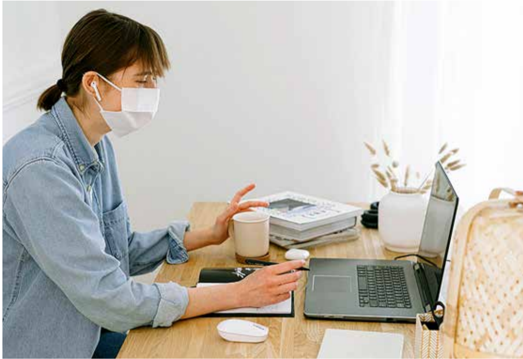
Eesti Kirjandusmuuseumi Eesti kultuurilooline arhiiv ja ühendus Eesti Elulood kutsuvad inimesi jätkama koroonaviiruse mõju mõtestamist ning kirjapanemist.

sile elulood@kirmus.ee või paberkanjal aadressile Eesti Kirjandusmuuseumi Eesti kultuurilooline arhiiv, Vanemuise 42, 51003 Tartu.