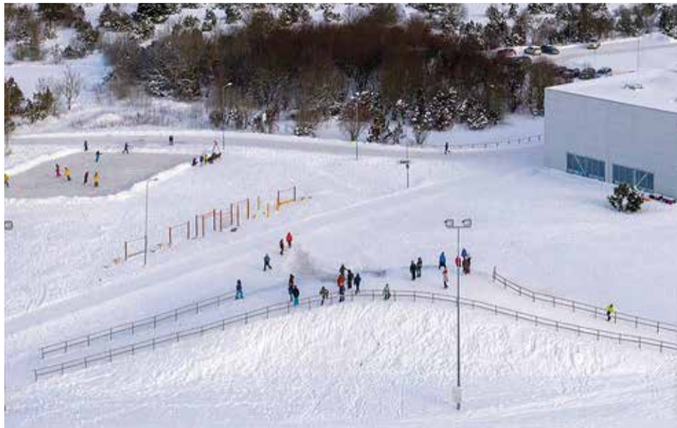
Laske liugu või lustige jääle. Muraste kooli kõrval asuv plats on ootel. / Fotod: VisitHarku.com

Kohalikud tragid inimesed on võtnud südameasjaks pakkuda kõikidele jääl liuglemise lusti. Uisutamise- ja hokihuvilised saavad talverõõme lisaks Tabasalus asuvale väljakule nautida ka Väänas ja Murastes.