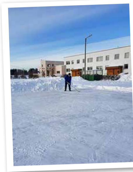
Vääna uisuplats asub Tiigi tänaval, kortermajade keskel.