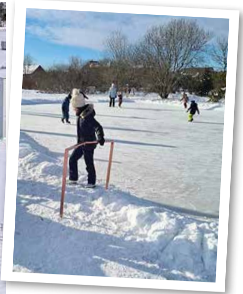
Muraste liuväljale on paigaldatud ka käsipuu – et jääle minek lihtsam oleks.