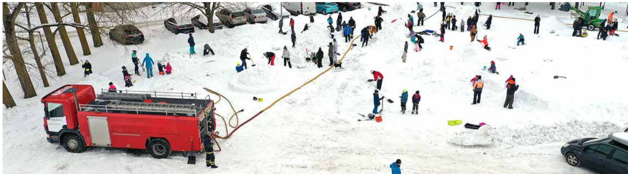
Lumelinna eestvedaja ei jõua ära kiita meie asjalikke vabatahtlike pitsumehi. Nendeta juba lumelinna ei ehita!