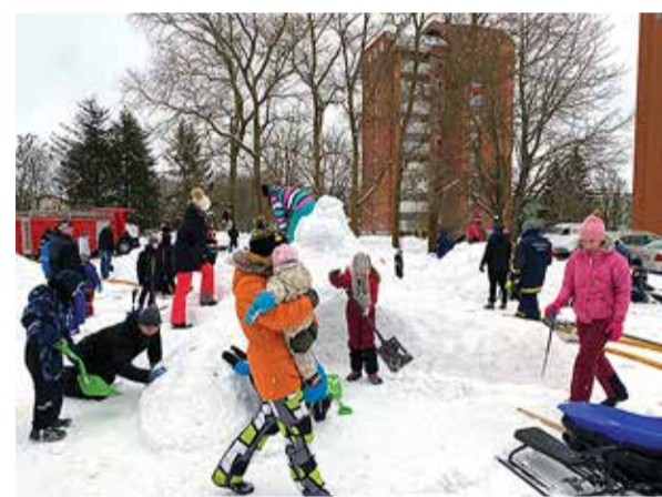
Käis kibe töö. Mõne tunniga kerkis platsile suurejoonelisi skulptuure, mille otsast kas liugu lasta või tunnelisse pugeda. Või hoopis niisama istuda ja jalga puhata.