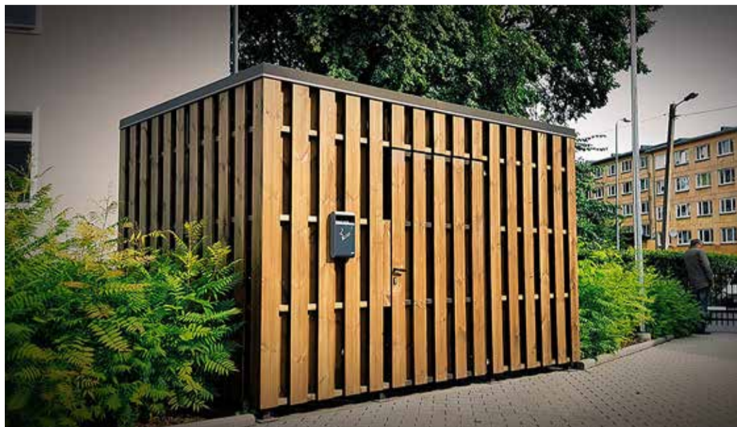
Umbes sellised hakkaks välja nägema jäätmemajad, mis aitavad tublisti kaasa jäätmete käitlemisele ja keskkonna puhtana hoidmisele.

jäätmed. Sellega saab hakkama igauks – tuleb vaid jäätmed eraldi koguda ja olmeprügikasti asemel panna need kompostrisse. Lihtsa kompostri saab ise valmistada või poest osta. Soojustatud kompostrid, mis soetada konteinerid jäätmemajadesse ja teha keskonnaalast teavitustööd.