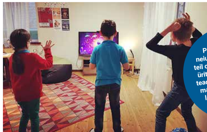
Harkujärve noortekeskuses lüüakse tantsu. "Uus "Just dance 2020" on vägev!" ütlevad asjaosalised.