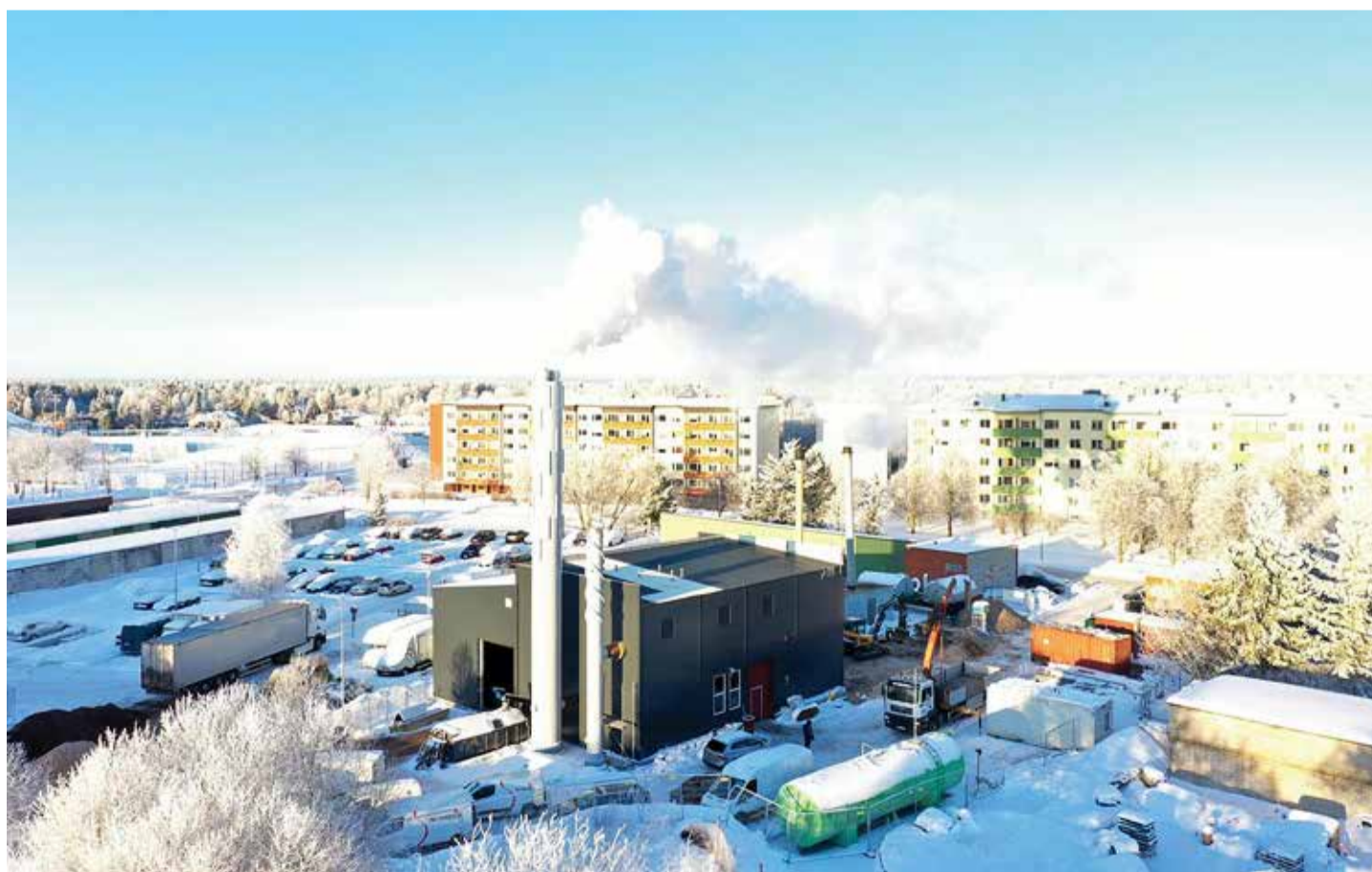
Tabasalu uus katlamaja vastav täielikult rangetele EU normidele suitsugaaside puhtuse osas.

Hetkel on veel lõpetamisel suitsugaaside pesuri paigaldus. See annab lisasoojusenergiat suitsugaasidest kuni 0,5 MW ning tagab suitsugaaside täiendava puhastuse. Esialgu oli plaan jätta reservi vana gaasikatel, aga kuna on lisandunud uusi suuri tarbijaid (Tabasalu Kodu hooned, Tabasalu riigigümnaasium, Tabasalu kooli uus hoone, uus ärikeskus ja