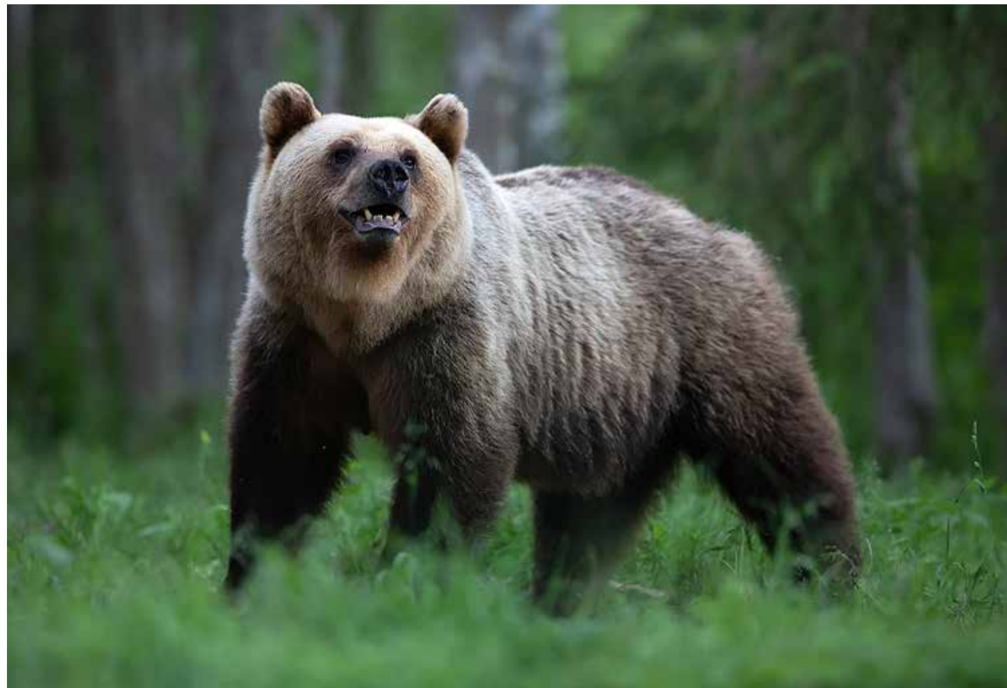
Pruunkaru arvukus on Eestis viimased 15 aastat olnud tõusutrendis.