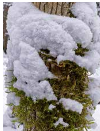
Sulgjas õhik.

Bioloogia- ja loodusainete õpetaja Marje Loide sõnul on sulgjas õhik natuke haruldane sammal, mis elab väga vanadel