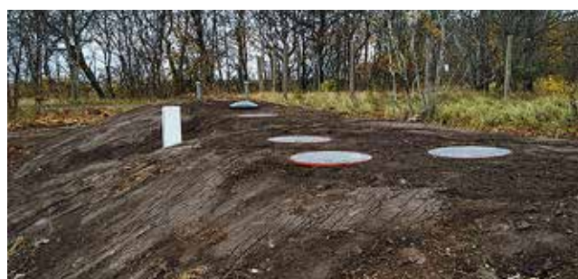
Harku vallas on alates 2014. aastast toetust saanud 51 projekti peale kokku 42 majapidamist.

Hajaasustuse programmi programmdokumendi ja taotlusvormid leiab Harku valla ning Riigi Tugiteenuste Keskuse kodulehelt. Harku valla poolne programmi kontaktisik on Lembe Reiman, lembe.reiman@harku.ee, 606 8823.