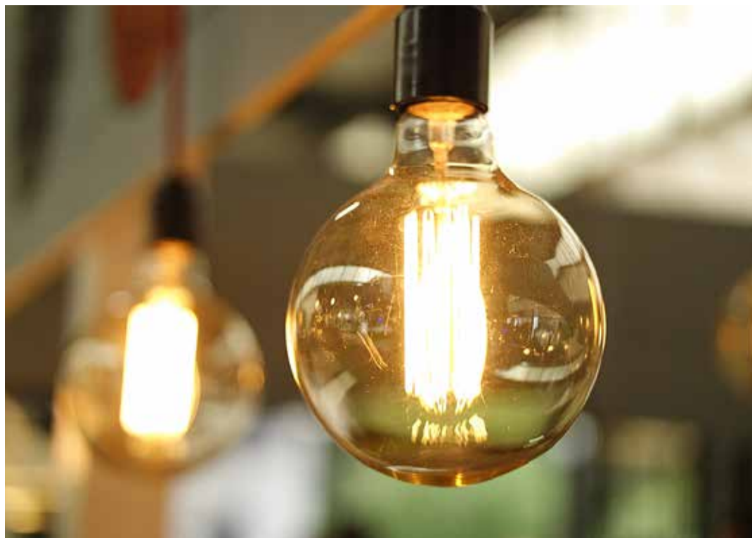
Energiatoetuse taotlusi saab esitada kuni 31. maini.

taotlejale on olnud 1223,3 eurot ja kõige väiksem summa 13,85 eurot. Keskmise väljamakstav summa on umbes 300 eurot.