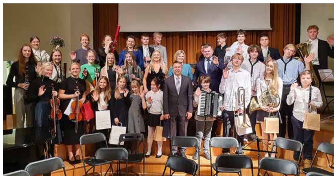
Kekava laval.

Tabasalu Muusika- ja Kunstikooli 20 õpilasest ning üheksast õpetajast koosnev seltskond veetis oktoobrikuises Lätis viis päeva, neist viis õpetajat koguni seitse päeva ja seda Kekava muusikakooliga kahasse kirjutatud projekti “Nordplus” toel. Nägime veel nende rahvuslikku ja moodsat kunsti ning ka põnevast