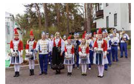
Tabasalu Muusika- ja Kunstikooli puhk- pilliorkester esinemas Norra saadikule ja külalistele.