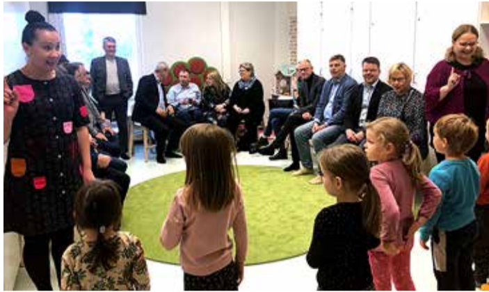
Lasteaialapsed ja -õpetajad külalistele esinemas.

Just üheksakümnendaid iseloomustab kümnete või isegi sadade koostöösuhete loomine sõprusvaldade vahel. Nüüd, 30 aastat hiljem, on aga toona loodud koostöövormid väga vähestel valdadel püsima jäänud. Ja mitte ainult Eestis, vaid ka Soomes. Seda enam on rõõmustav, et Harku ja Eura valla vaheline koostöö on aktiivne veel tänaselgi päeval. Seda rõhutasid mitmetel kohtumistel mõlema poole esindajad, kui Harku valla delegatsioon möödunud nädalal Eura vallas viibis.