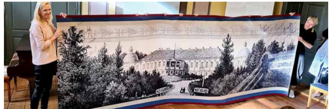
Vaiba esitlus.

Pärast mõisa renoveerimist aastail 2014–2015 kasvas mõisakooli õpilaste arv pea poolteist korda ja oluline oli kasutusele võtta iga ruutmeeter hoonest. Soklikorruse alale planeeriti sisustusprojekti raames nii pikapäevarihma õpi-