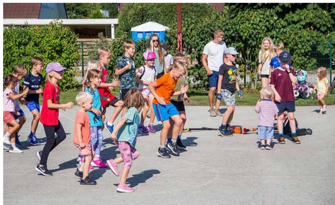
Ettevalmistused enne Pereoolümpia starti.

15. augustil 2007. Liikmeskond on pidevalt kasvanud. Kui vaadata ehitustrendi ja ümbruskonna planeeringuid, siis mõistagi eeldame, et see kasvutrend on jätkuv.