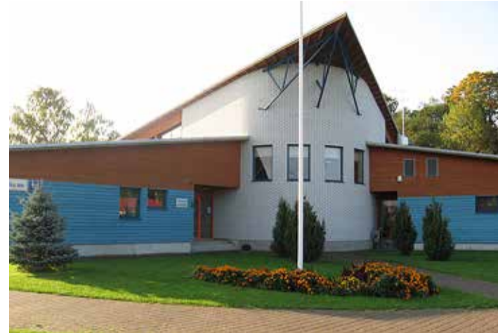
Tabasalu Teelahkme lasteaed tähistas 16. oktoobril oma 20 aasta juubelit.