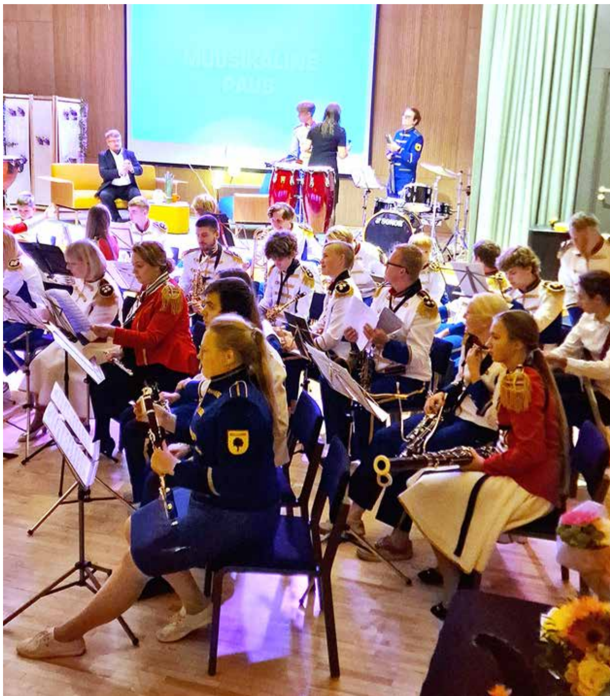
Pildikesi Huvitegevuse ja Noorsootöö Sihtasutuse meeleolukast sünnipäevapeost.

set huvitegevust. Tabasalus olid olemas suured klubid – näiteks jalgpalli-, käsipalli-, triatloni-klubid, aga väiksematele huvigruppidele nappis tegevusi. Soovisime anda võimaluse ka neile noortele, kelle huviala hõlmab väiksemat ringi, olgu selleks siis kabe, kitarriõpe või midagi sarnast. Valla poolt saime anda tasuta ruumid, katta tuli vaid juhendajate tasu. Teine, üsna pragmaatiline põhjus oli pikapäevavõimaluste korralduse äravõtmine koolidelt, kuna see ei ole just õpetajate põhitegevus. Läbi sihtasutuse oli võimalik ka pikapäevavõimaluste õpetajaid tasustada,” meenutab Rätsepp.