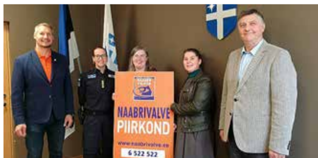
Rahulolevalt röömsad osapooled.