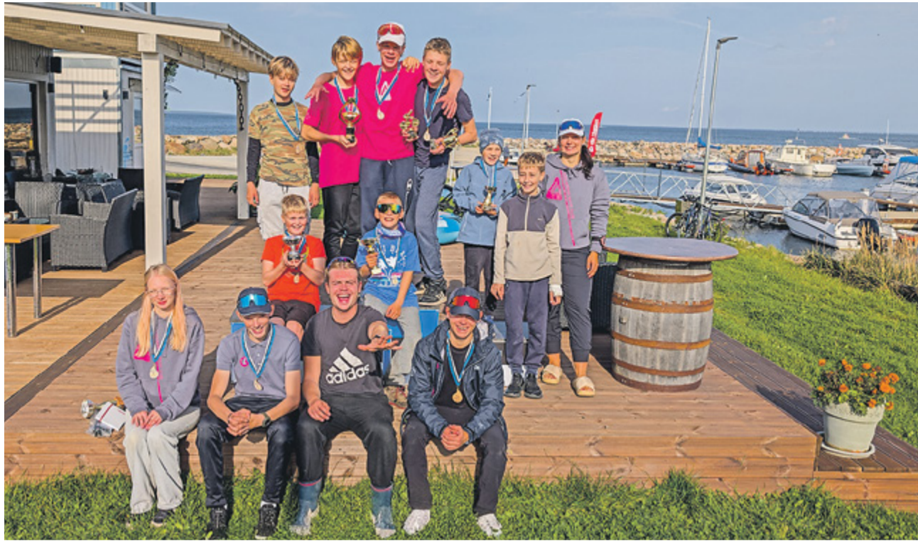
Õnnelikud purjetajad koos treeneritega hooajalõpuvõistlusel Tilgus.