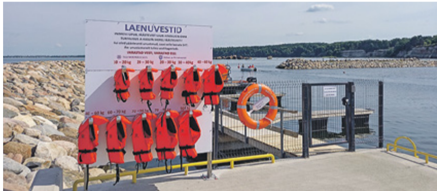
Tilgu sadamas toimib juba aastaid hästi seltsi algatatud päästevestide laenutussüsteem.

vajaduse korral on käidud abiks ka kaugemal – näiteks Pakri saarest lääne pool. Vabatahtlik SAR-üksus on valmis merele minema 30 minuti jooksul. Tilgu päästjatel olemas ka merereostustõrje võimekus.