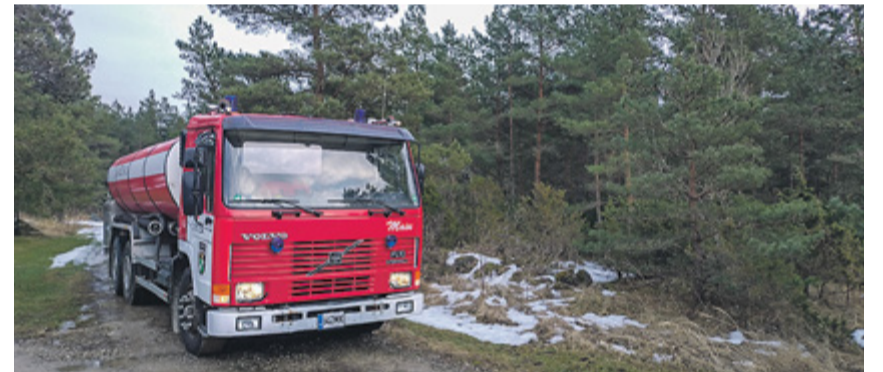
Väana Vabatahtliku Tuletõrje Ühingu paakauto Maiu.

Seltsi liikmete sõnul on iga ennetustund väärtuslik. Kui teadmisi jagada kolmele, kümnele või kahekümnele inimesele, kasvab nende