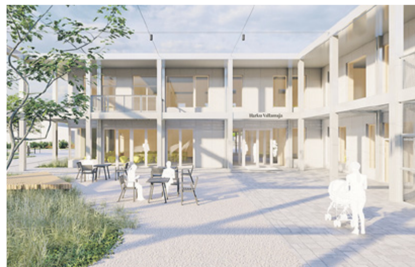
Rajatava uue Harku vallamaja eskiis.