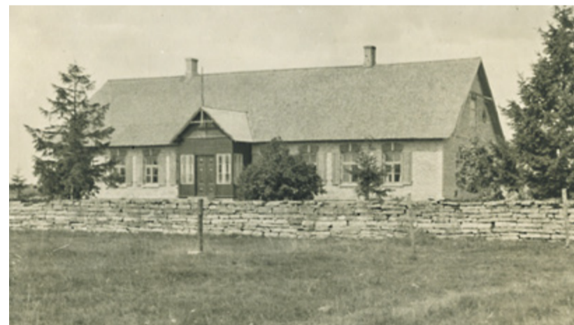
Esimene Harku vallamaja.

Uus ehk Harku valla teine vallamaja maksab 4,65 miljonit eurot, millele lisandub käibemaks. Ehitamist kaasrahastatakse riigi liginullenergiahoone ehitamise toetusest 1,7 miljoni euroga. / Maris Viisileht , abivallavanem