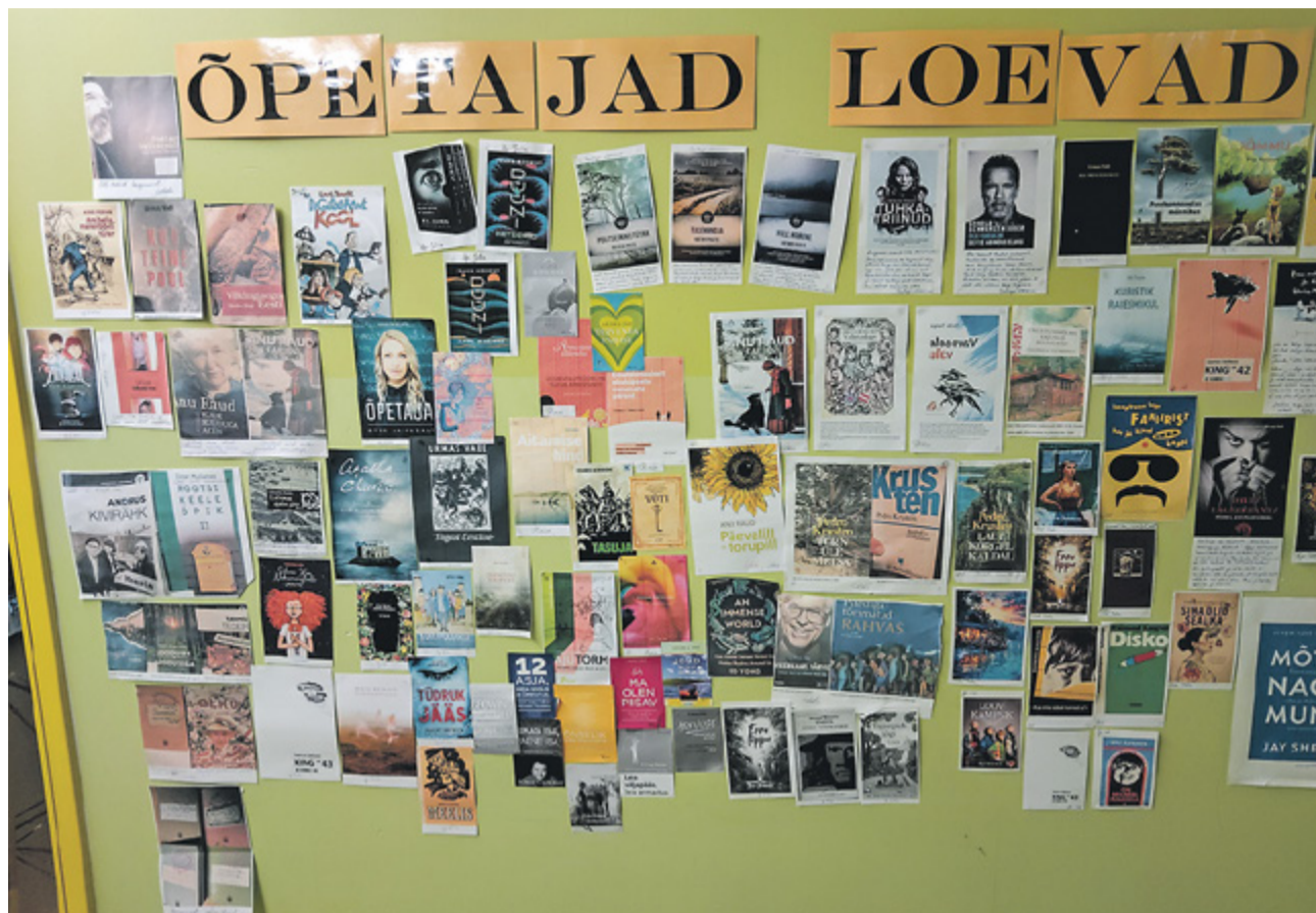
Mida loevad Väana-Jõesuu kooli õpetajad?

4.–6. klasside õpilased kohtuvad meie valla luuletaja Julia Aroldiga. Luule kaudu avastavad noored, kui