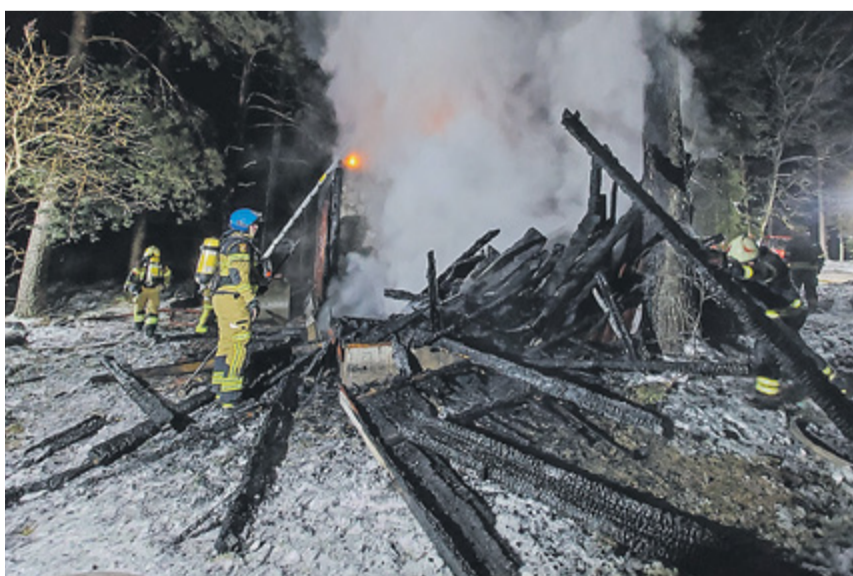
Vabatahtlike päästjate argipäev.

Kõik, kel on põnevat materjali Harku valla ajaloo kohta ning ideid ja ettepanekuid juubeliaasta tähistamiseks, võtke palun ühendust e-posti teel harku@harku.ee või helistades telefonil 505 4894.