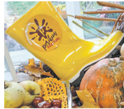
Porikuu Festival 2026 toimub 3. oktoobrist 1. novembrini.

Fosfor on veekogudes oluline piirav toitainet. Kui seda on vees liiga palju, võib see soodustada vetikate vohamist ja halvendada veekogu seisundit. Uuring aitab paremini mõista, miks on Harku ojas fosfori sisaldus