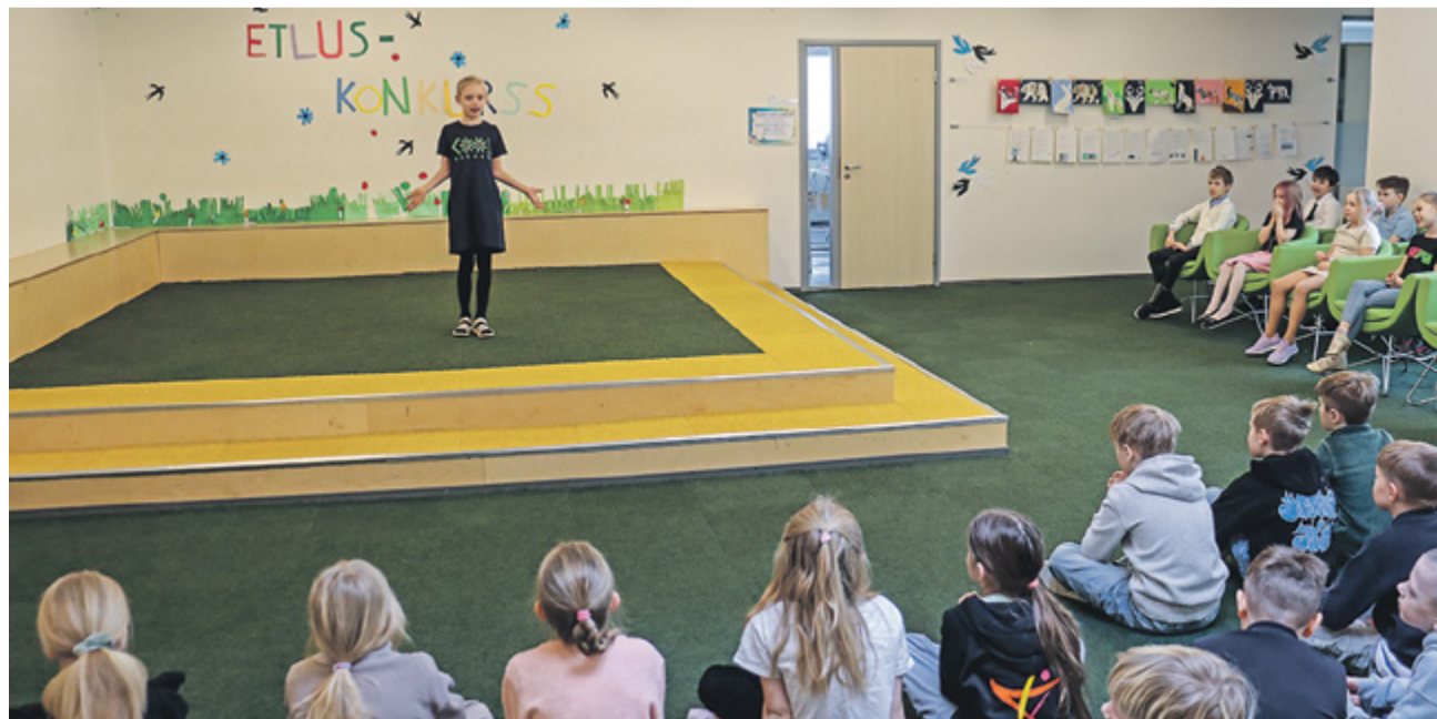
Etluskonkurss Muraste koolis.