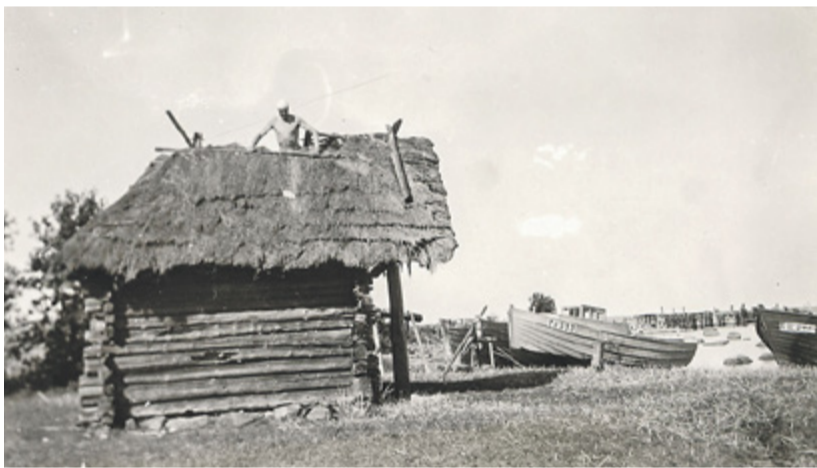
Vörgumaja Rannamõisa Tilgu rannas.