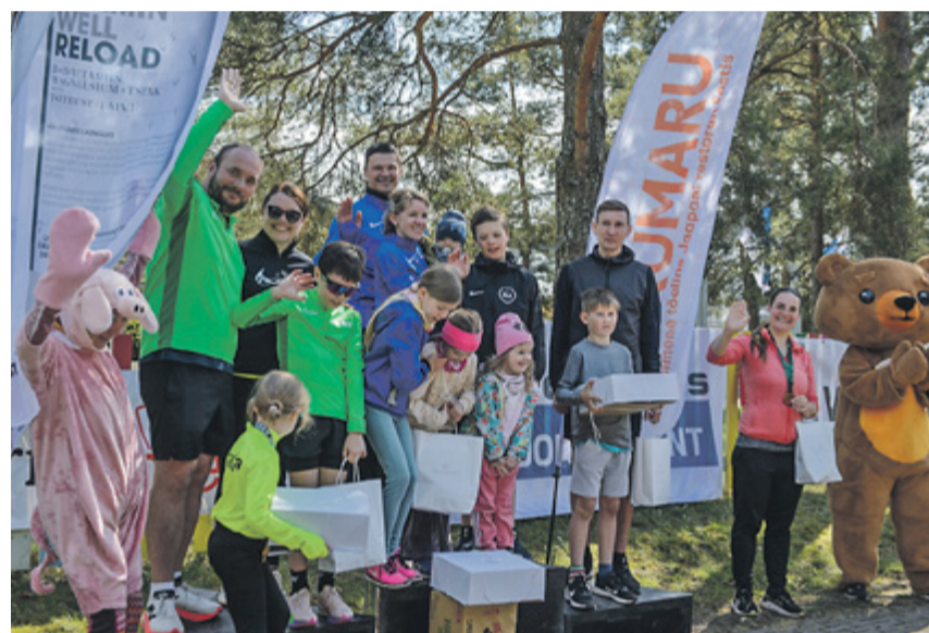
Perede autasustamine. Fotod: jooksu korraldaja

Traditsiooniliselt joosti vanuse järgi kolmel distantsil: kuni seitsmeaastased lapsed läbisid 250 m, 7–12-aastased 1300 m ning 14-aastased ja vanemad 4650 m. Sel aastal osales kokku 227 jooksusõpra. Laste rõõmuks olid kohale tulnud ka Karupoeg Puhh ja Notsu, kes aitasid enne jooksu soojendusharjutusi teha, toetasid jooksurajal ja jagasid kõige väiksematele lõpetajatele eakohaseid kingitusi.