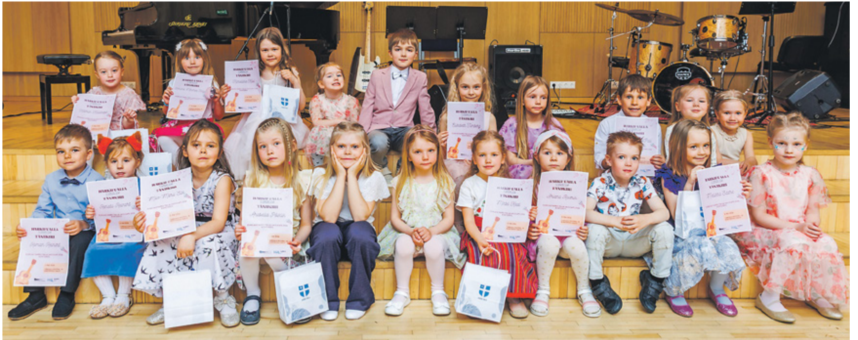
3-4- ja 5-6-aastased laululapsed.

Harjumaa piirkondlikule lauluvõistlusele pääsesid kõik kolm parimat tüdrukut.