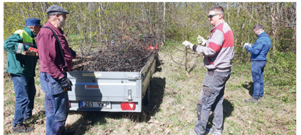
Talgupäev Rannamõisas.