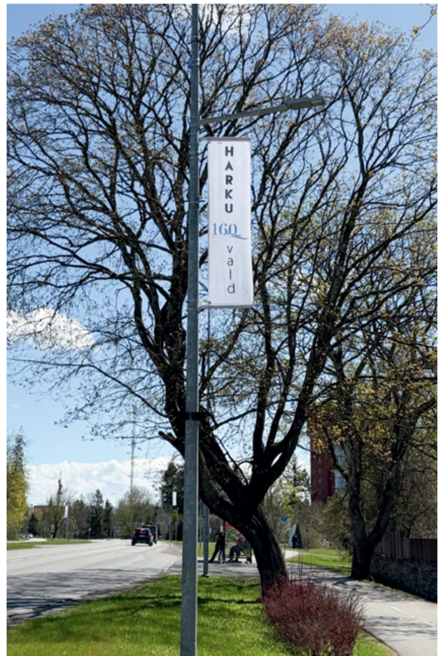
Juubelilipud ehivad valla keskust Tabasalus ja teisi suuremaid külasid.