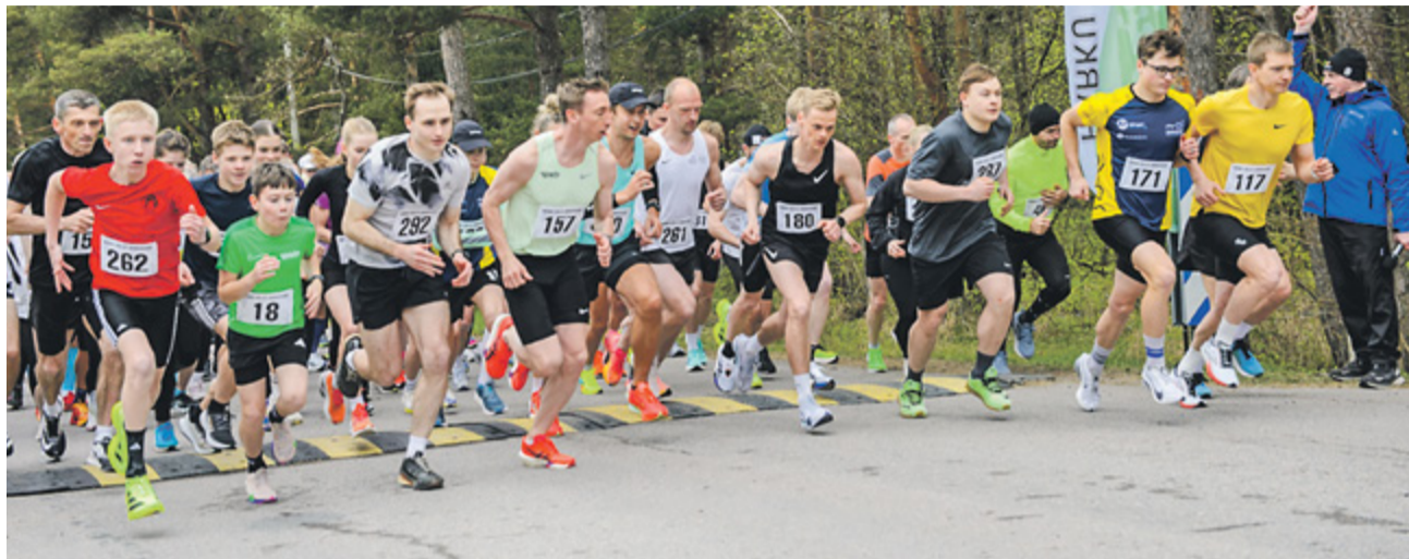
1650 meetri start.